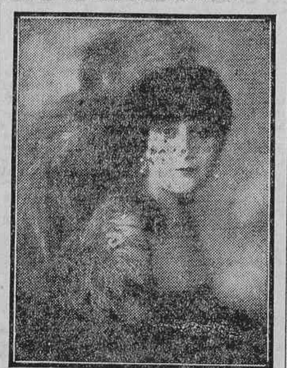
Lel Dagaven, artista cinematográfica alemana