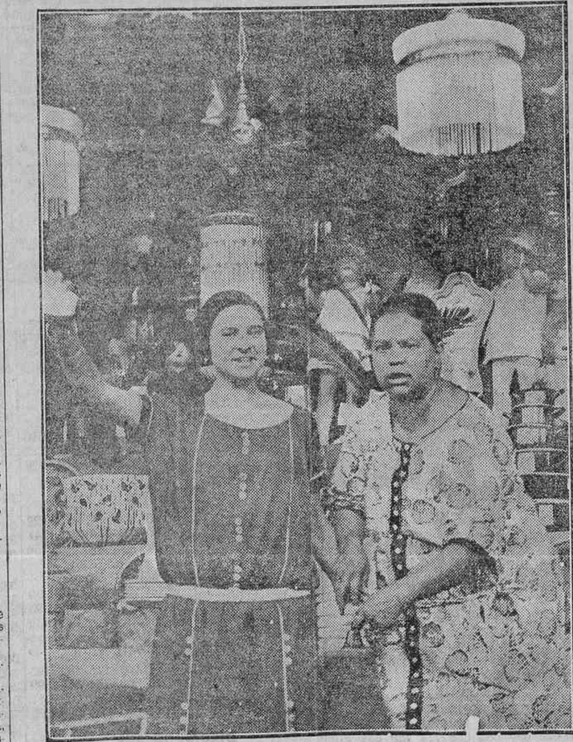
MADRID VERBENERO.—PREMIO: LA CALLE DEL SOMBRERO

Elsingfors 1.—La Prensa comunista rusa habla mucho del Congreso de los obreros de la región parisina que acaba de celebrarse en París. «Es una verdadera fuerza—dice—que se levanta contra la guerra de Marruecos. Por otra parte, Moscú ha dado orden de reunir a todos los obreros, comunistas o no, para agruparlos en organizaciones obreras. «Los propagandistas harán el resto», declaran. Moscú ha ordenado igualmente a los oradores y propagandistas esparcidos en las grandes factorías parisinas que no anuncien abiertamente pertenecer al partido comunista. La nueva táctica de Moscú consiste en organizar movimientos obreros por medio de reivindicaciones puramente económicas, con el fin de crear a toda costa un descontento general en Francia. Se han ingresado importantes sumas en las cajas de socorros para organizar y, sobre todo, para prolongar las huelgas. Este procedimiento se extenderá después a otros países.