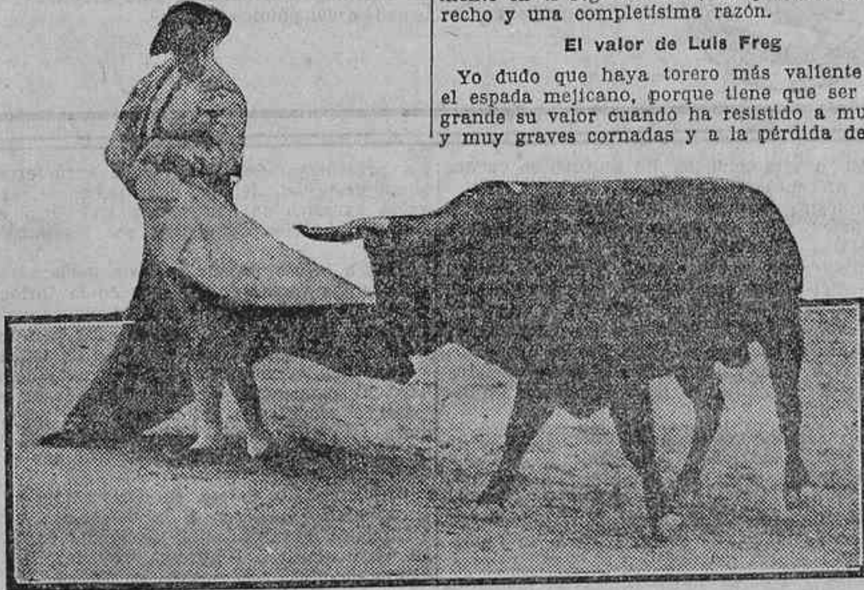
VILLALTA ADORNANDOSE EN UN QUITE

Yo dudo que haya torero más valiente que el espada mejicano, porque tiene que ser muy grande su valor cuando ha resistido a muchas y muy graves cornadas y a la pérdida de dos