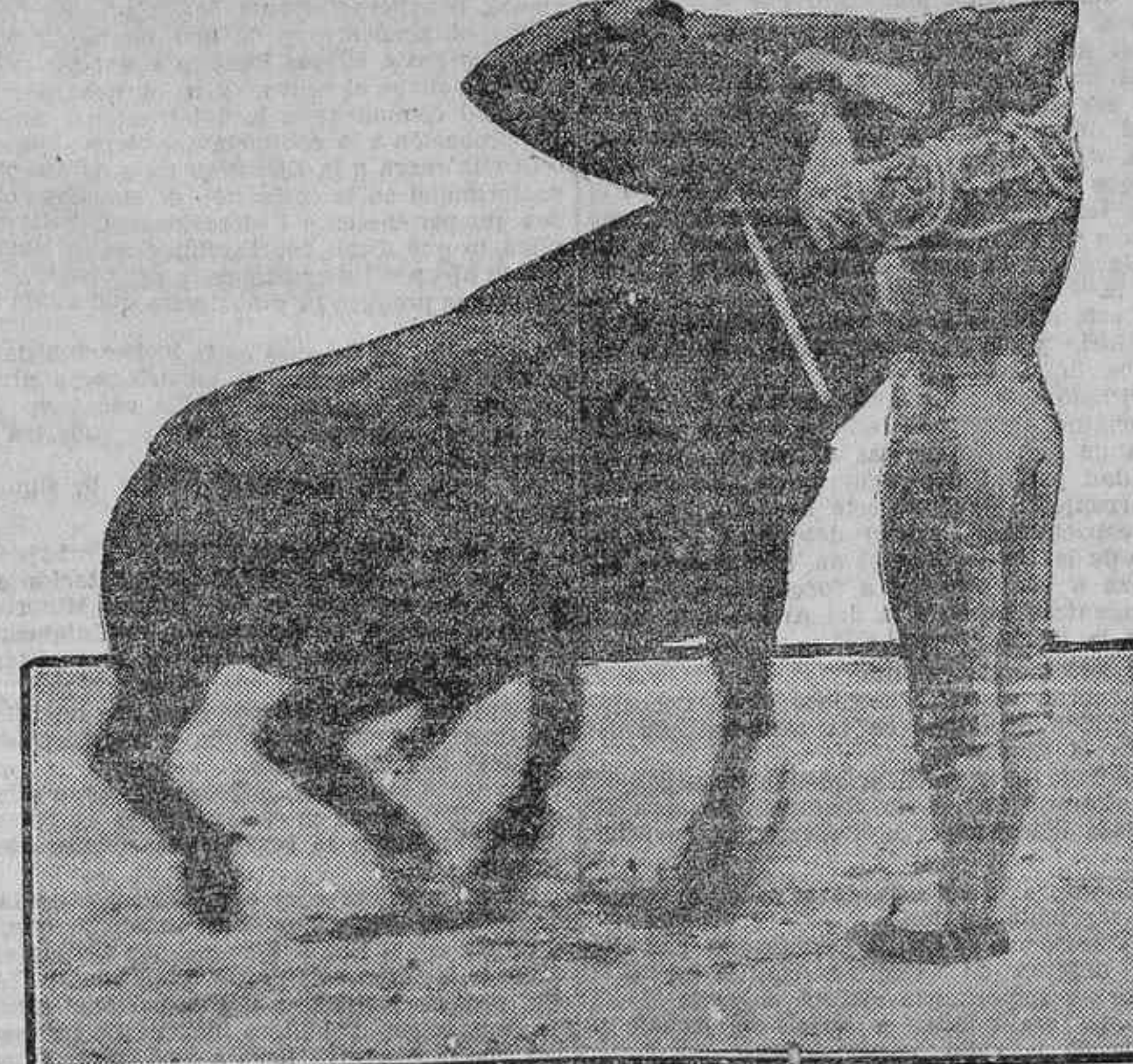
FREG EN EL PASE DE LA MUERTE