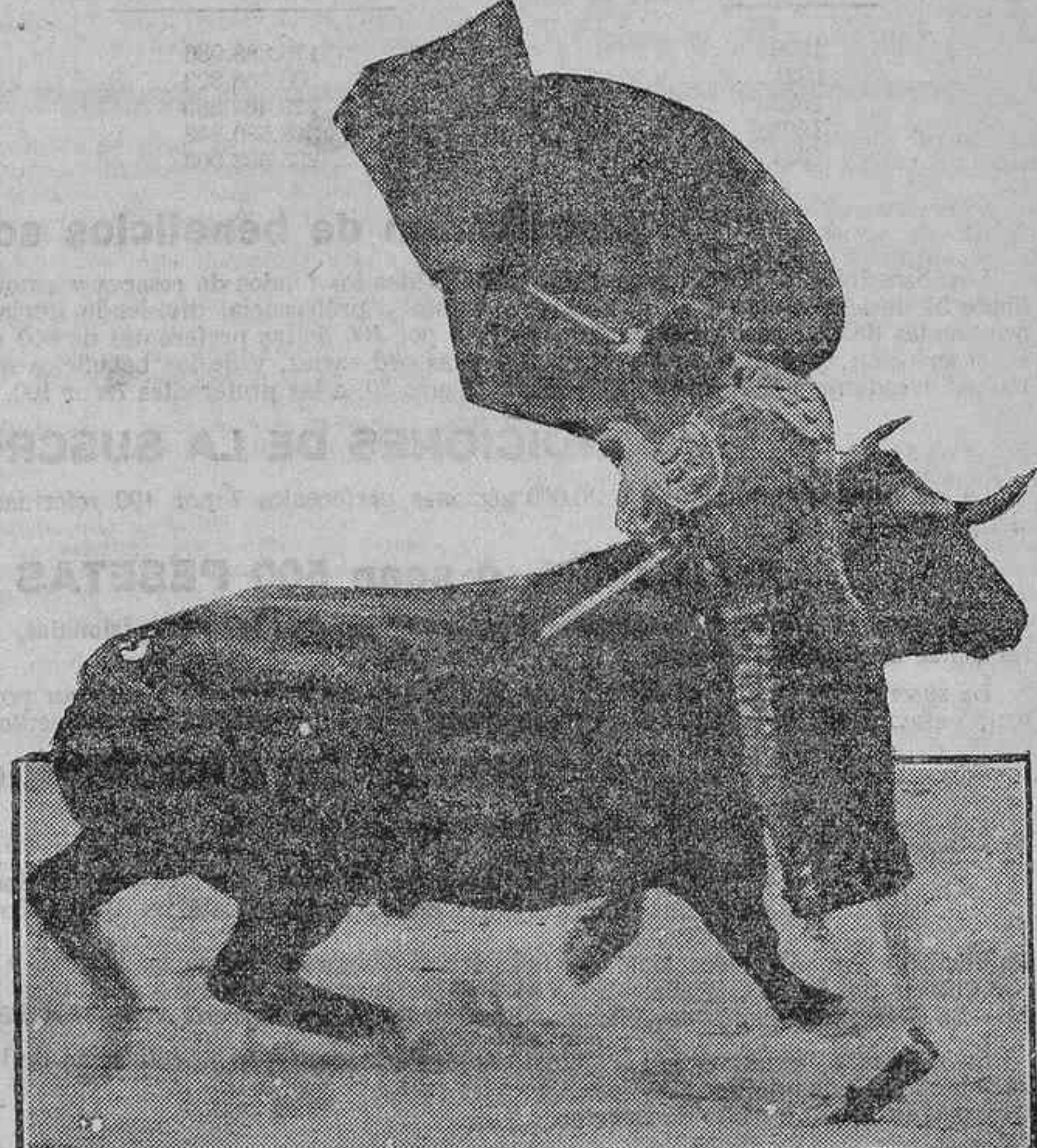
LITRI EN EL TORO DEL QUE SE LE CONCEDIO LA OREJA (Fotografías Alonsó.)