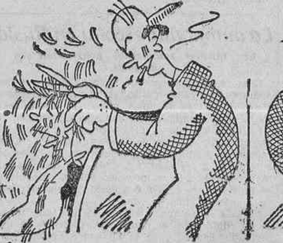
Y mientras el peluquero sigue rapándole, Felipín baña su rostro en lágrimas, y repite: —¡Señor! soy un niño.