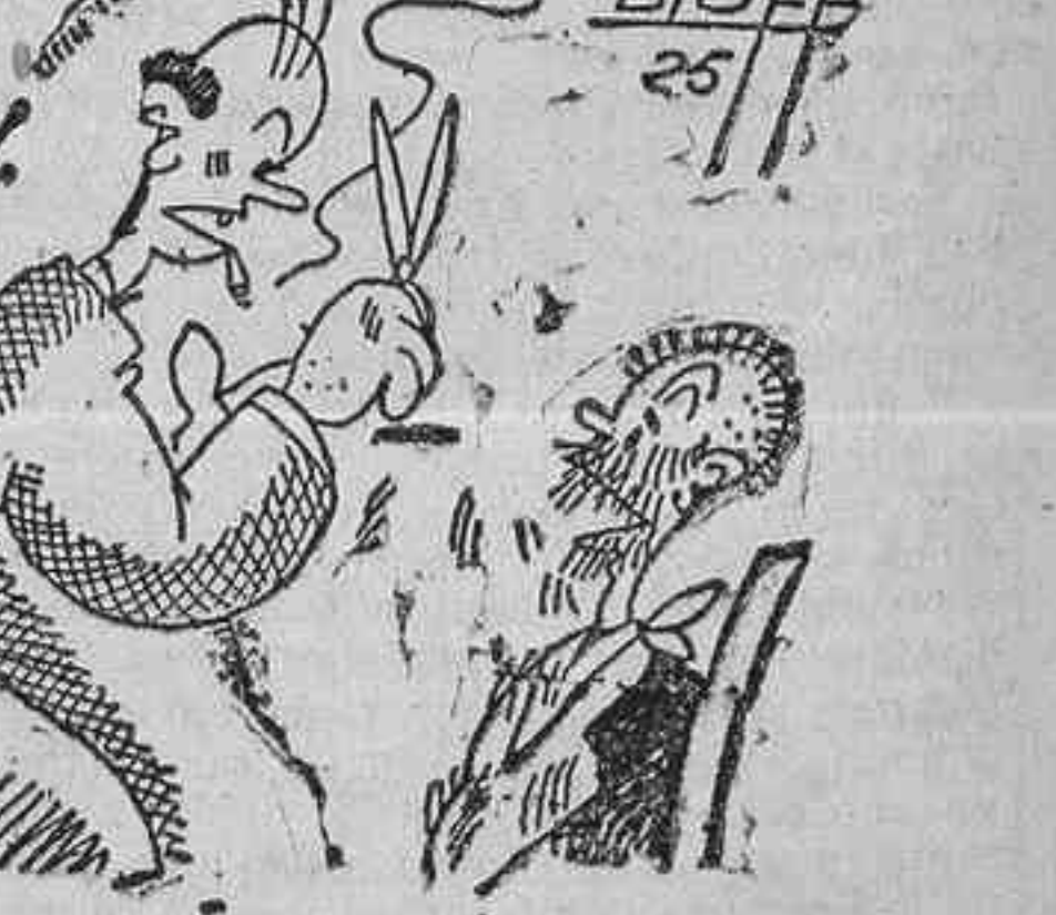
—¡Caray!—exclama el peluquero, aterrado— ¡Pero un niño con toda la barba!