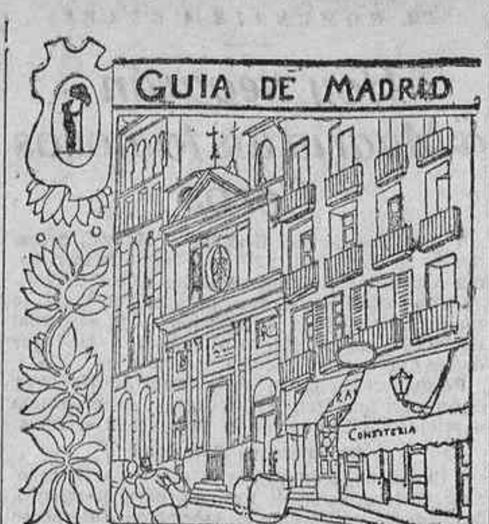
Calle de Torres Miranda