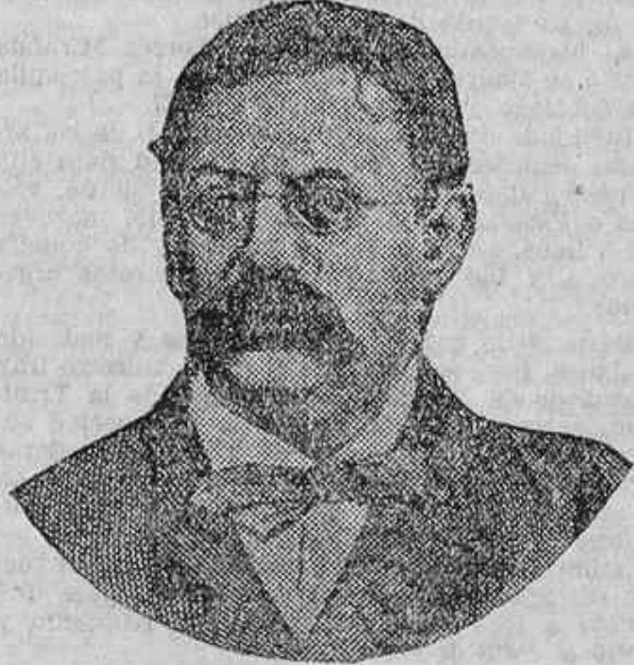
El muy ilustre José Anselmo Clavé, músico y poeta catalán, educador de multitudes, elevado espíritu liberal, a cuya memoria va a tributar Madrid un fervoroso homenaje

A mediodía de hoy llegarán a Madrid, procedentes de Barcelona, 1.200 coristas de la meritísima Asociación Euterpense de los Coros Clavé. Como anunciáramos días pasados, el viaje lo realiza la simpática agrupación para asistir al homenaje que Madrid va a tributar al fundador de los Coros, al que dedica una calle.