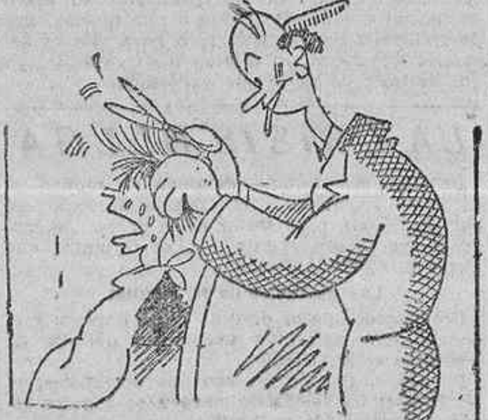
El buen peluquero trata de animarle: —Parece mentira que lleve así un hombreito.