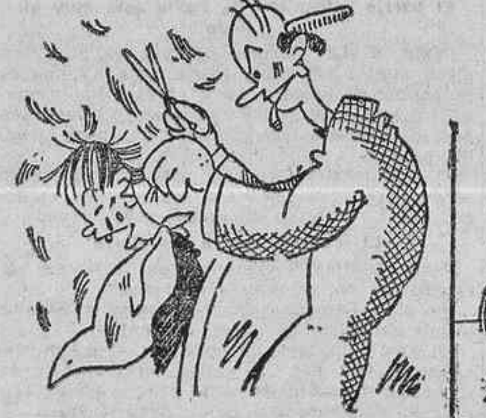
—Yo no soy un hombreito; soy un niño.