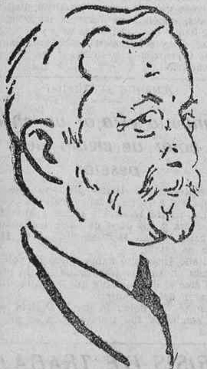
El congresista Calza, redactor del diario 'Giornale d'Italia'.