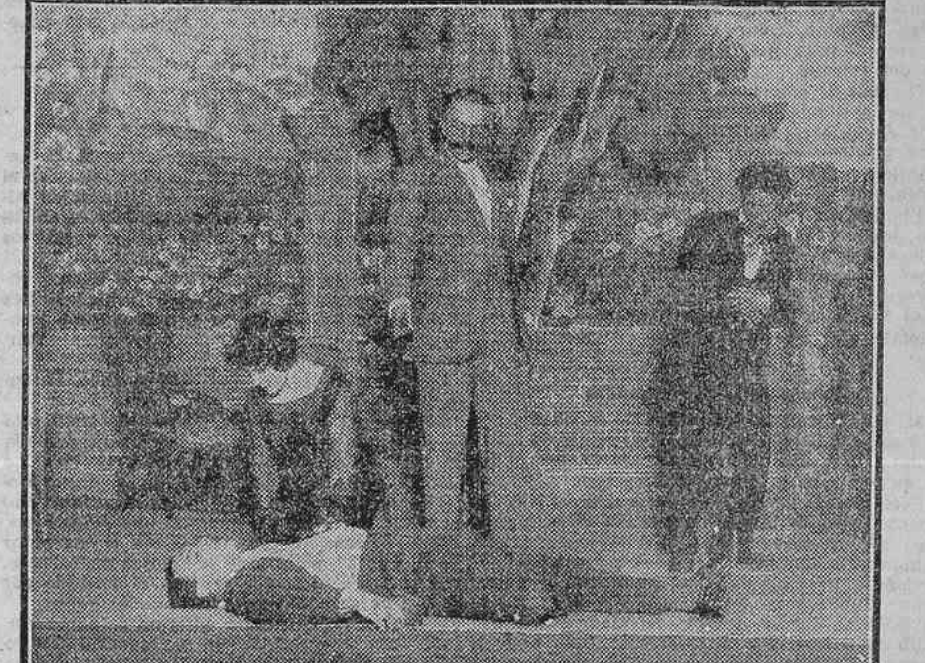
UNA ESCENA DE «MIEDO A LA VERDAD», ESTRENADA ANOCHE EN EL COMICO