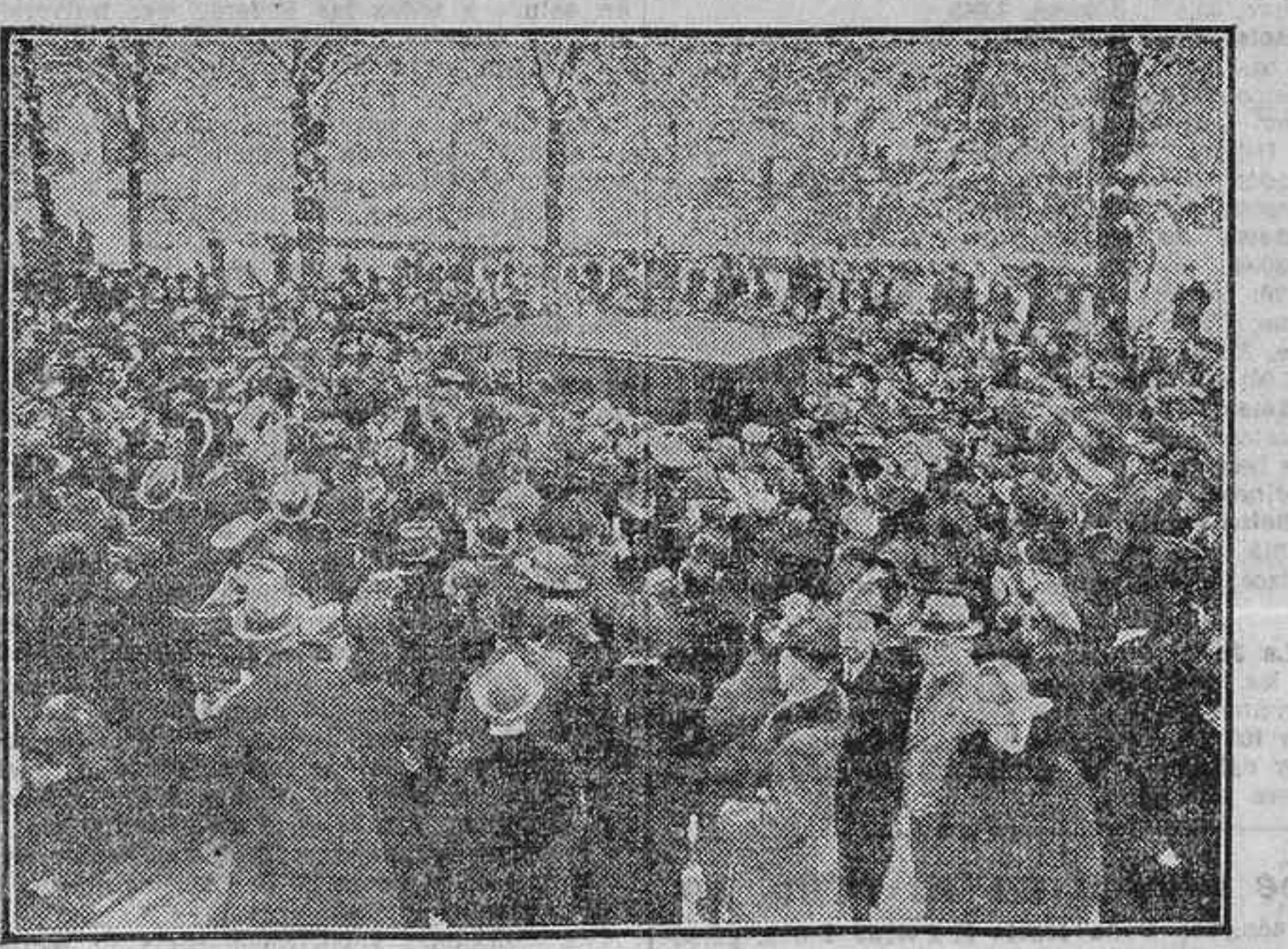
LOS REPUBLICANOS DE BERLIN ACLAMANDO AL IMPERIALISTA HINDENBURG

Berlin, 24.—En Pomerania se ha declarado una epidemia de tifus, registrándose ya seis casos seguidos de muerte.