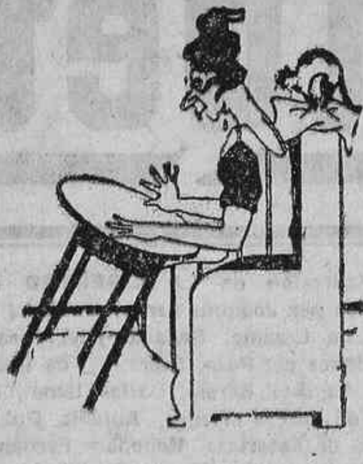
-De momento, sí...