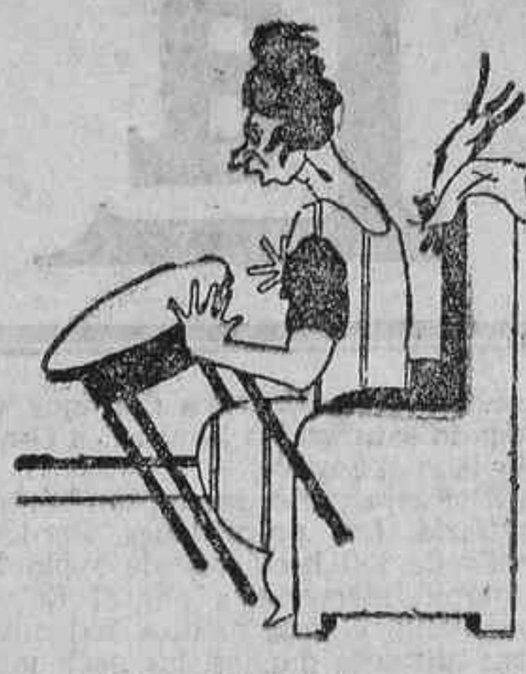
-¿Y por qué sólo de momento? -Porque me han dicho que ventas y me voy al infierno.