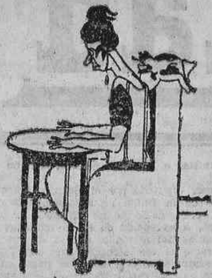
-Espiritu de mi marido, ¿es verdad que estás en el purgatorio?... -