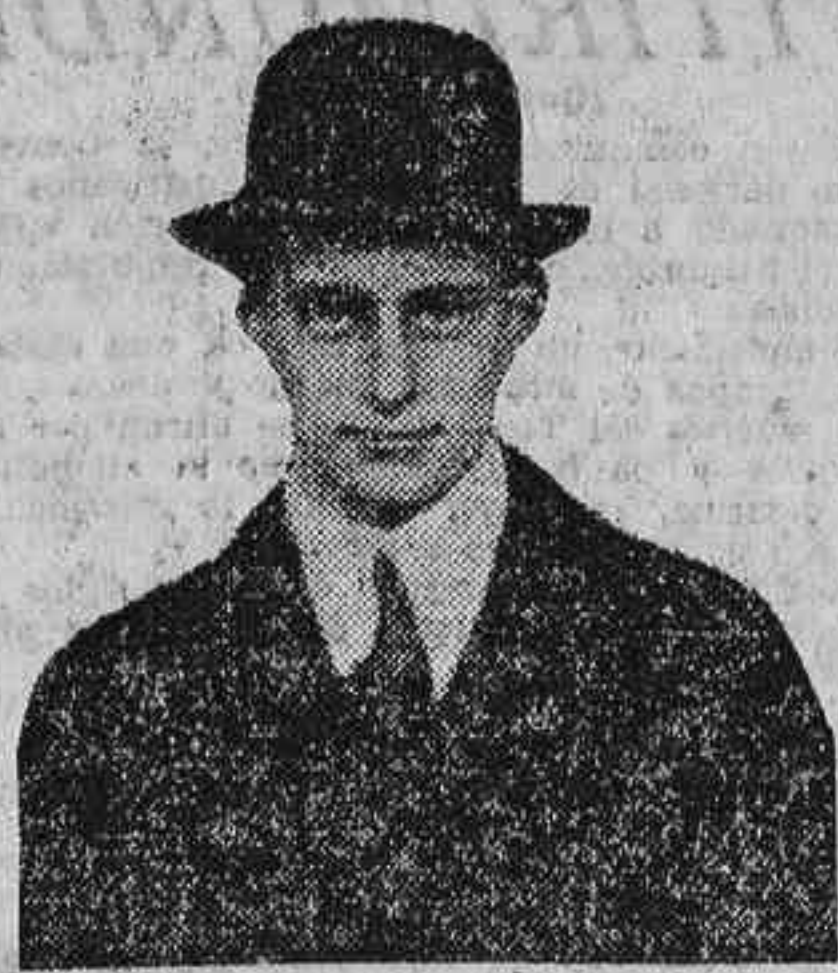
Guillermo de Hohenzollern, nieto del ex kaiser de Alemania, que actualmente se encuentra en Madrid