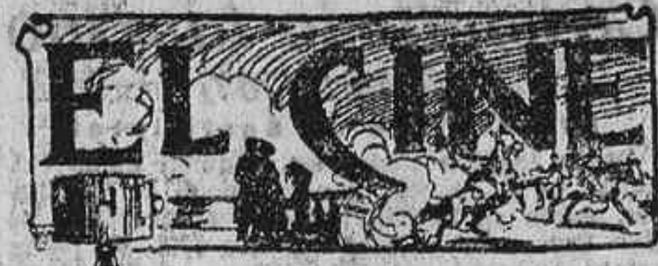
Por esos cines