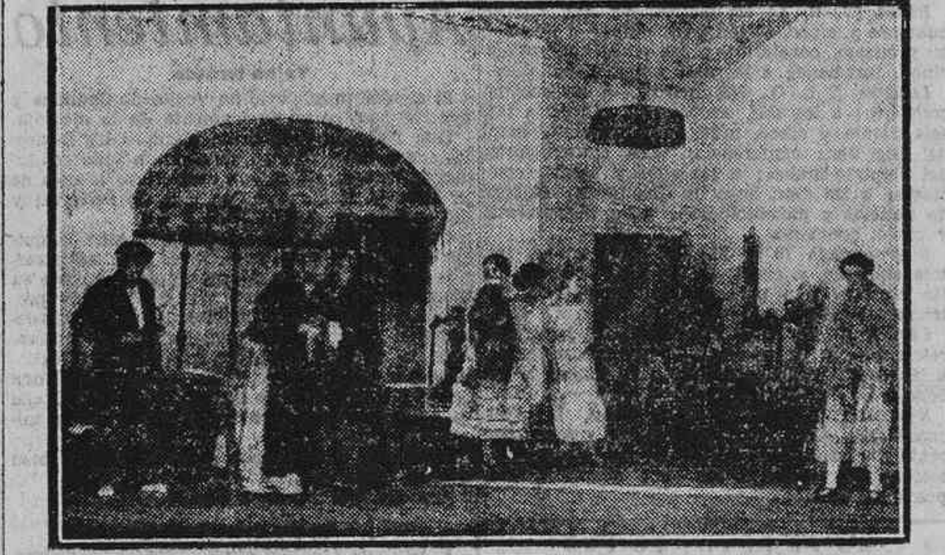
UNA ESCENA DE «EL AMOR QUE PASA», TAL COMO SE REPRESENTA EN EL TEATRO DE LA COMEDIE DES CHAMPS ELYSEES, DE PARÍS

¡Vamos, por lo tanto—y de ahí nuestra curiosidad—a contemplar una obra de los Sres. Quintero, desnuda de lo que pudiéramos llamar privilegio del acento y de la gracia de nuestros tipos meridionales. En la prueba—nos es grato no retrasar tal declaración—ha triunfado el me-