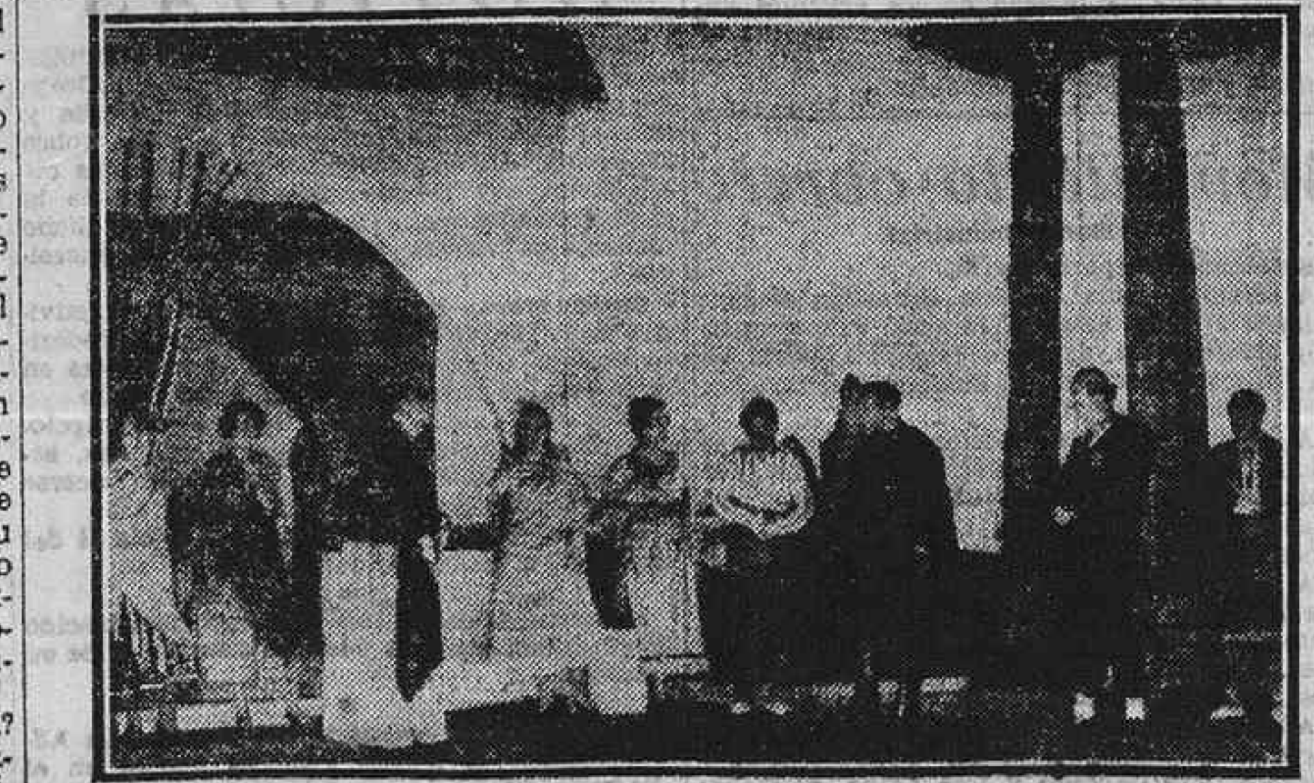
«L'AMOUR QUI PASSE», DE LOS HERMANOS ALVAREZ QUINTERO, MUY APLAUDIDA POR EL PUBLICO DE PARÍS EN LA COMEDIE DES CHAMPS ELYSEES