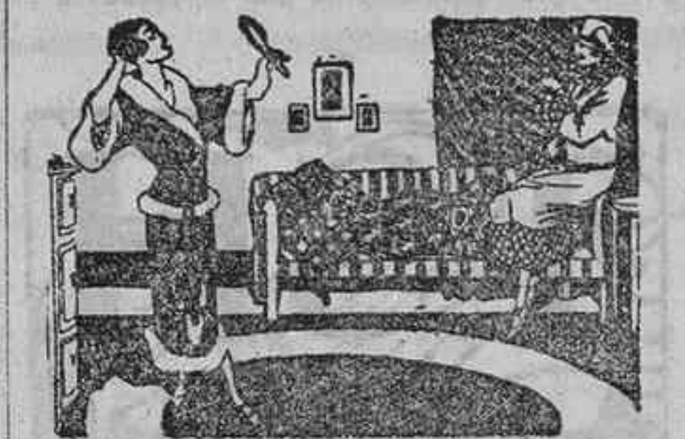
—Mucho te compones, Mercedes... —A ver si pescó a algún alcalde... (London Mail.)