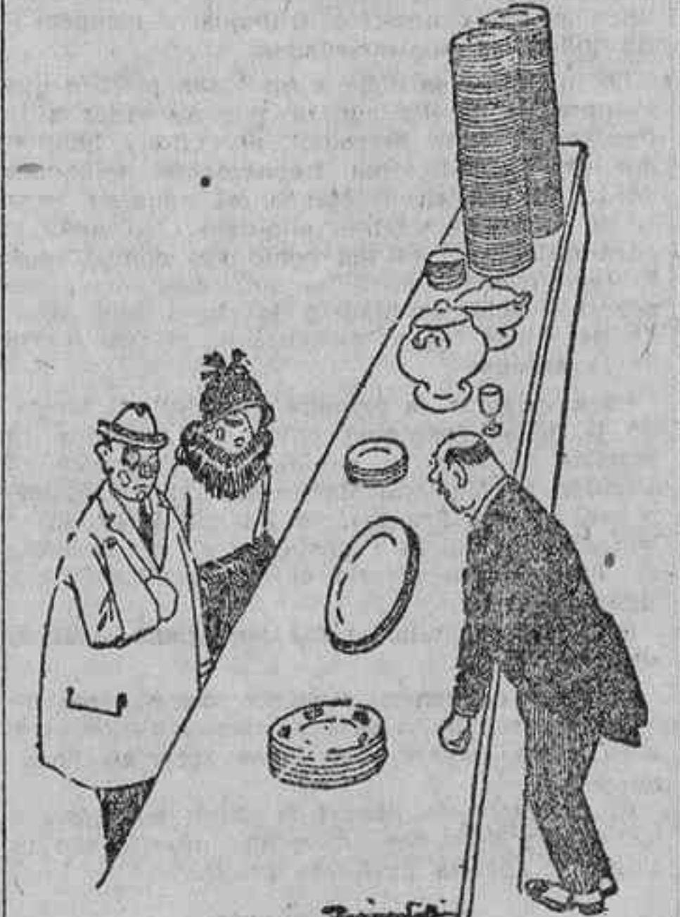
—Deseamos una vejilla para veinticuatro cubiertos. De la doce que nos vendió usted ayer no es suficiente. (Le Rire.)