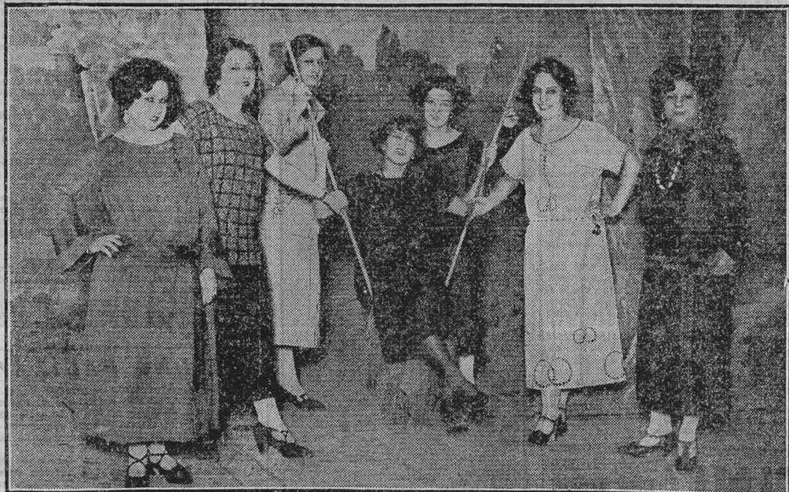
UNA ESCENA DE LA OBRA «LAS ENCAJERAS», QUE SE ESTRENO AYER TARDE EN EL TEATRO DE NOVEDADES