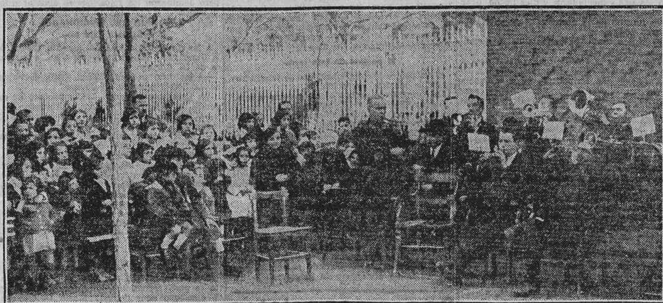
LOS MUSICOS CATALANES QUE FORMAN LA «COBLA» DE CASA DE LA SELVA DANDO UN CONCIERTO DE SARDANAS EN OBSEQUIO DE LOS NIÑOS DE LAS ESCUELAS DE AGUIRRE