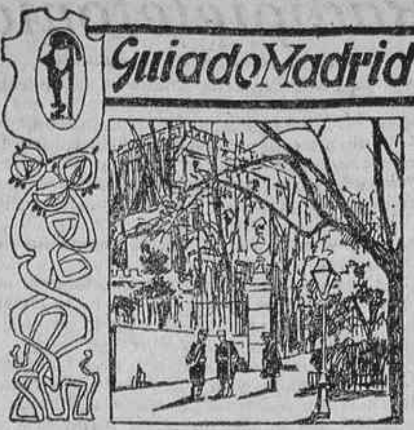
Paseo de San Vicente

De la plaza de España al paseo de la Florida. Barrios de Carlos III y de la Montaña, distrito de Palacio, parroquia de San Antonio de la Florida.