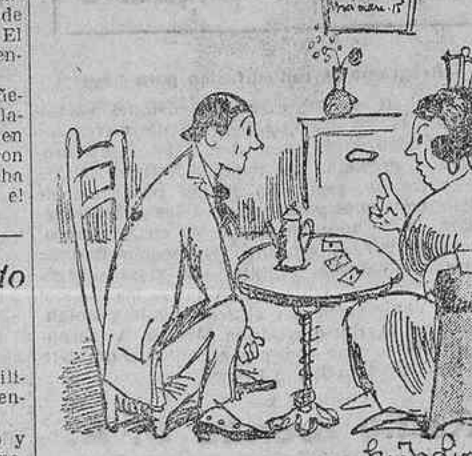
La pitonisa.—Le veo a usted en la miseria durante quince años. Sufrirá usted horriblemente. —Diablo, ¿y después? —Después le irá mejor, porque ya se irá acorturando. («Le Journal Amusant».)

Es admirable comprobar con qué rapidez los colaboradores de la Oficina, originarios de países tan distintos por sus lenguas, sus costumbres y sus aspiraciones nacionales, han conseguido, gracias a la armonía de sus esfuerzos personales, el asegurar el desarrollo de un organismo cuya potencia reside no sólo en su unidad, sino también en las fuerzas vitales que lleva en sí la diversidad misma de sus partes constitutivas.»