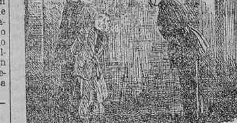
El sospechoso.—¿Pero qué se me acusa haber robado? El policía.—Un carro con su caballo. El sospechoso.—Pues que se me registre. («London Mail».)