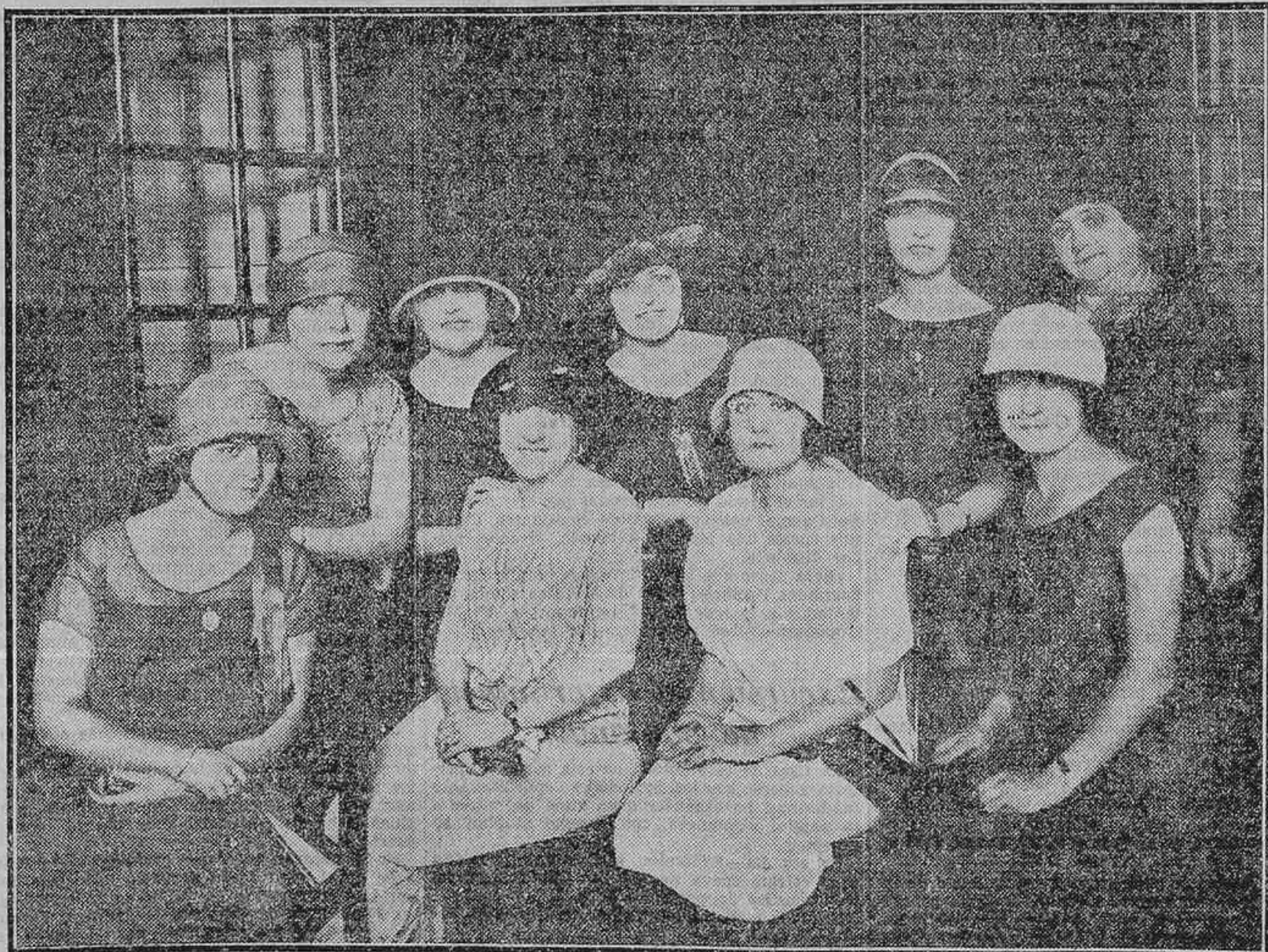
LAS ACTRICES DE LA COMPANIA DE JOSE ROMEU, QUE SE PRESENTARA EN EL TEATRO COMICO EL 3 DE SEPTIEMBRE