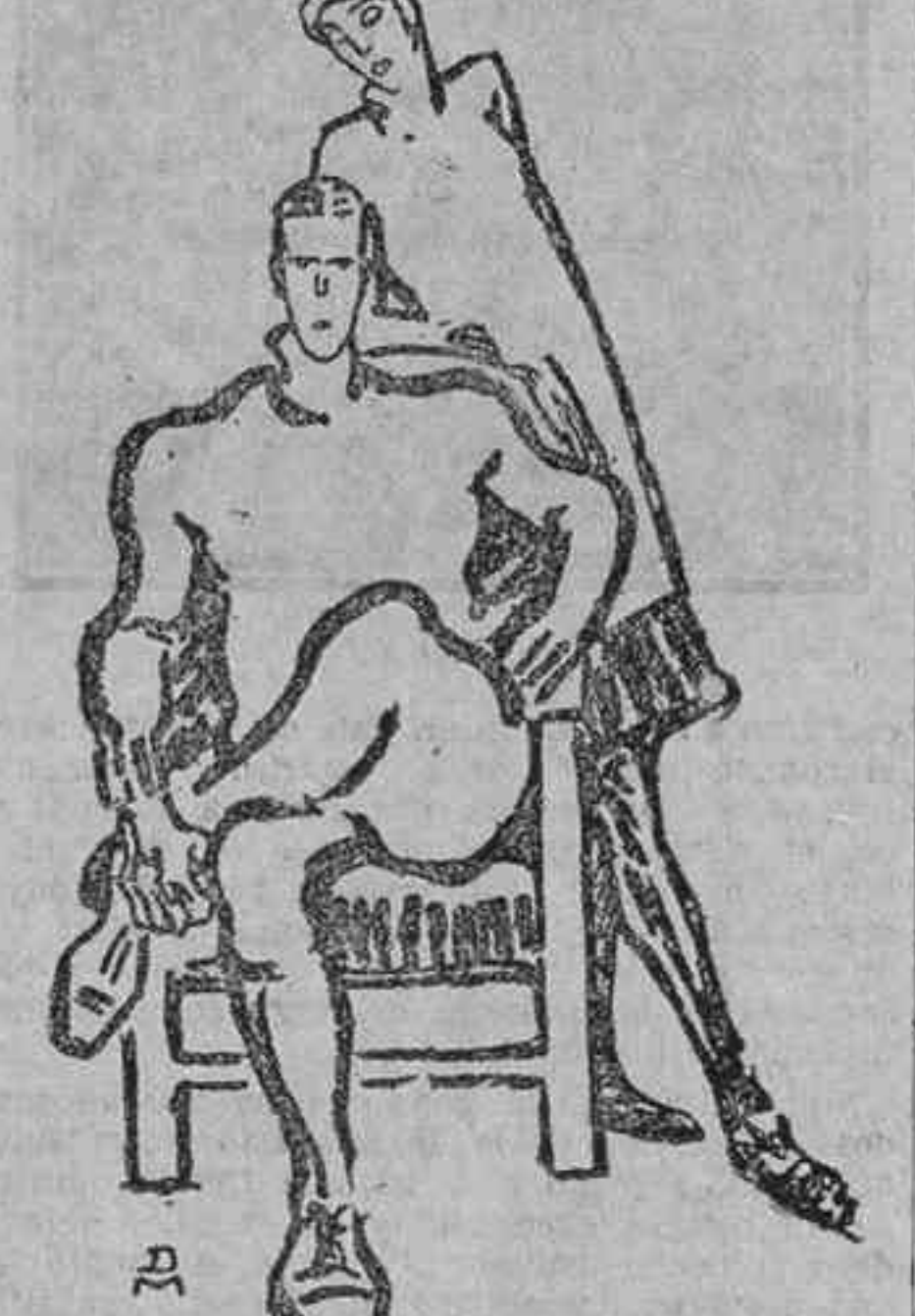
—Siempre hablar de Zola, de Renan, de Galdós... ¿Qué recordis batieron esos hombres?... (Le Rire.)