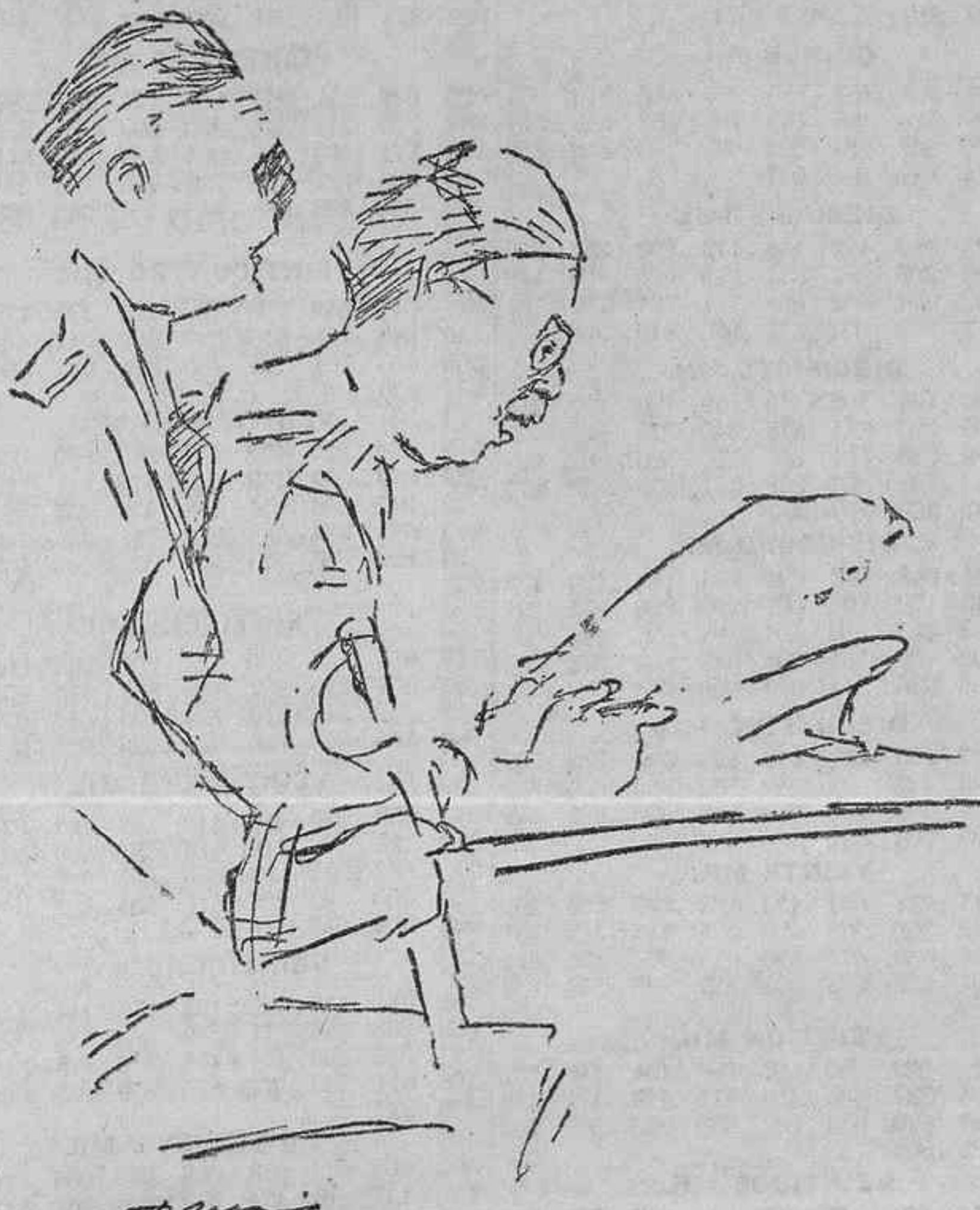
EL RELATOR LEYENDO EL EXPEDIENTE PICASSO Y LA ACUSACION FISCAL