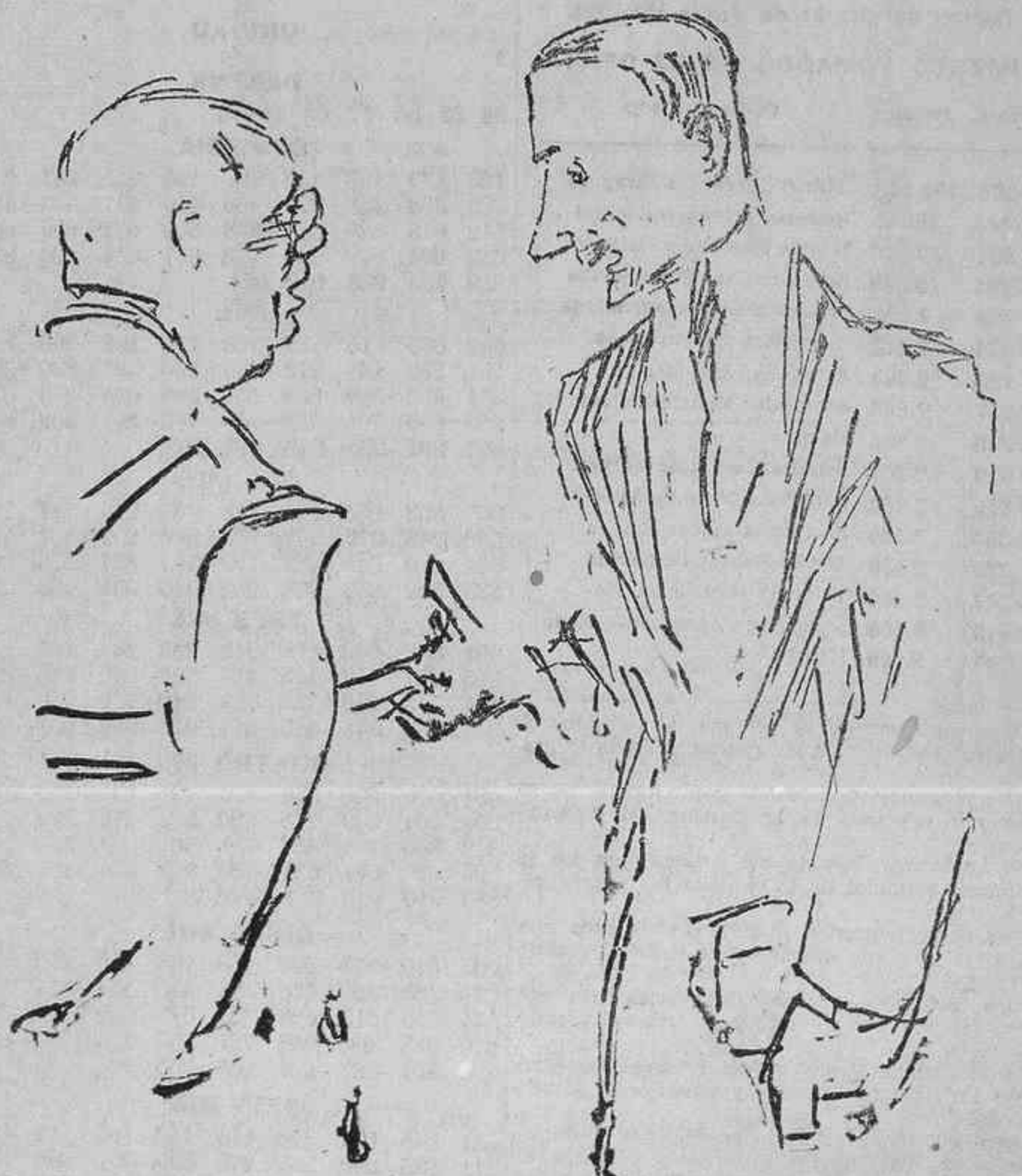
EL SECONDO DE ERA EN LOS PASILLOS DEL SENADO, ESPERANDO SER LLAMADO A DECLARAR

El hecho único aclarado es que por muerte del