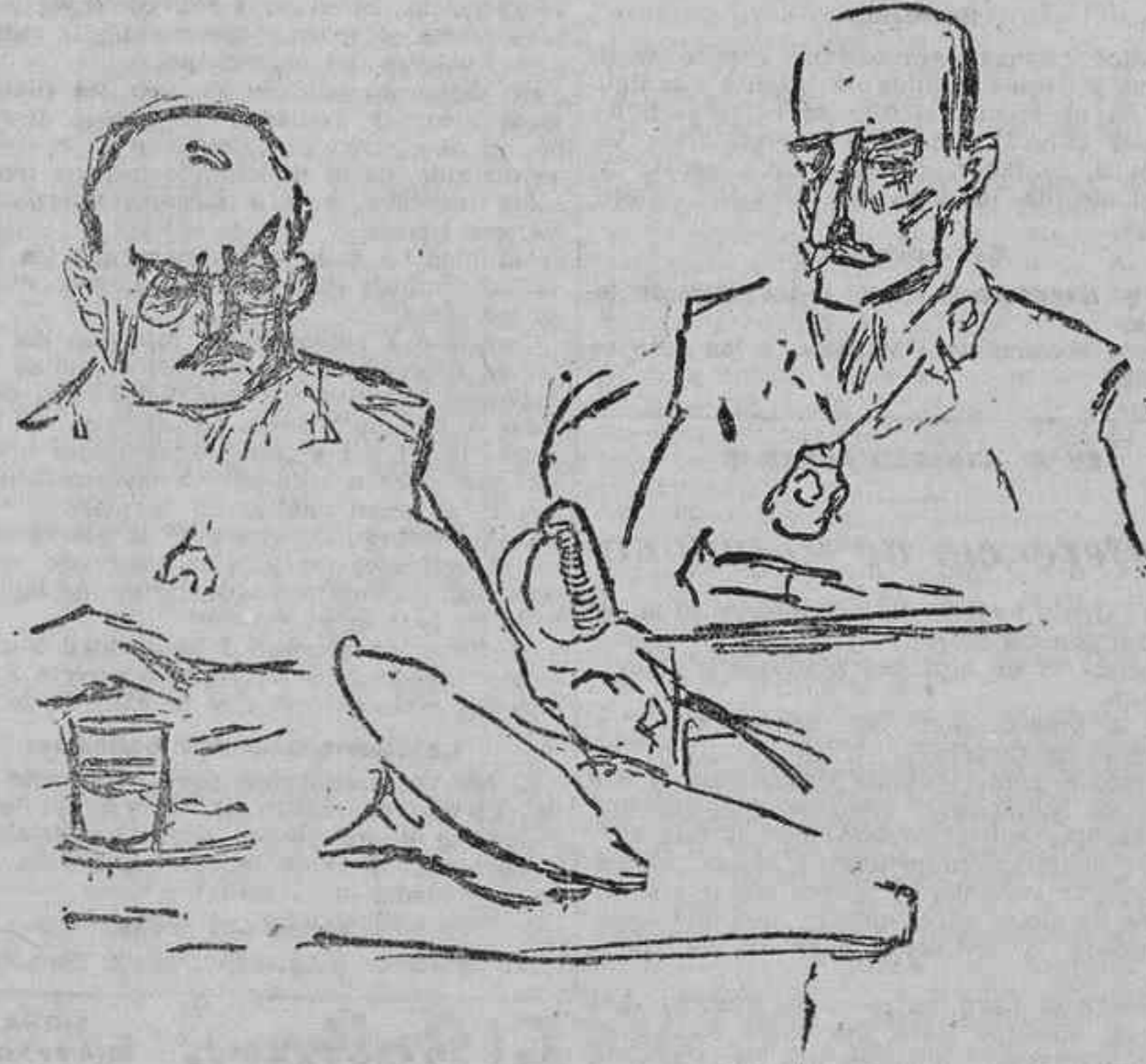
EL FISCAL Y EL GENERAL PICASSO OYENDO LA LECTURA DEL EXPEDIENTE Y LOS COMENTARIOS DEL RELATOR

Afirma que las posiciones de Mauro e inmediatas a la orilla del Kert hubieran podido quedar como último escalón de defensa si la más