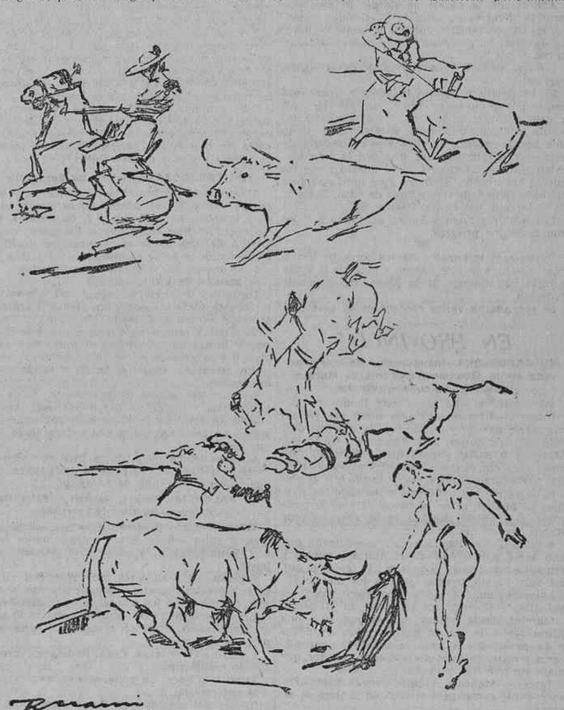
ESCENAS DE LA SUERTE DE VARAS.—LA MUERTE DEL CUARTO TORO

le perjudican, porque demuestran su falta de valor y afición, tampoco le miento.