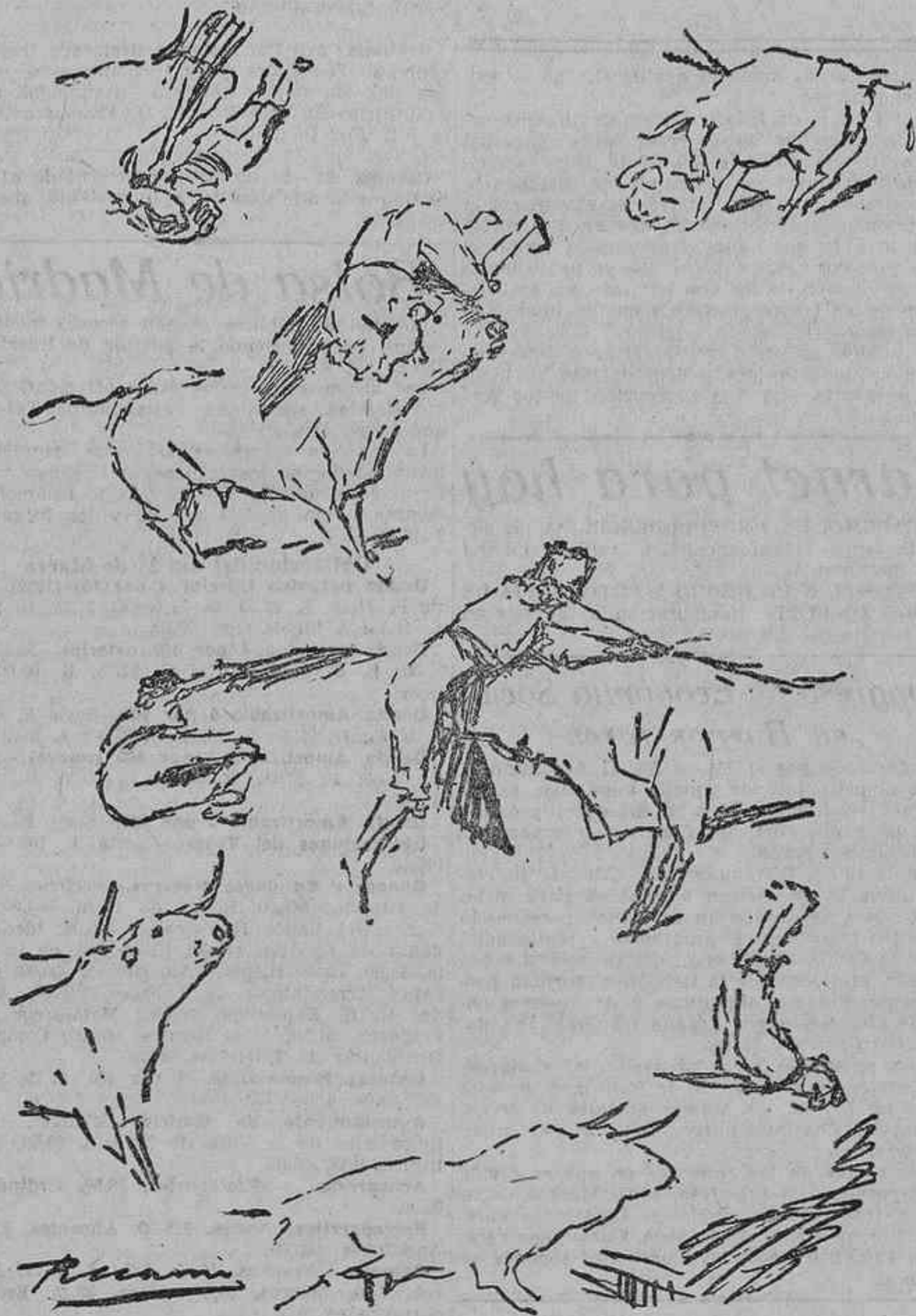
DIFERENTES MOMENTOS DE LAS COGIDAS DE SALAZAR Y TORQUITO II

Un buen amigo mío, que es un culto escritor y aficionado excelente a la fiesta nacional, me remitió hace poco unas notas de las cogidas que había sufrido el diestro Caranacha, y como