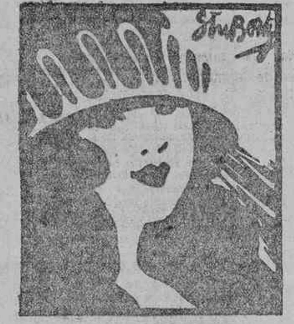
Con toda franqueza, señorita, ¿qué piensa usted del amor y del matrimonio? (Le Matin.)