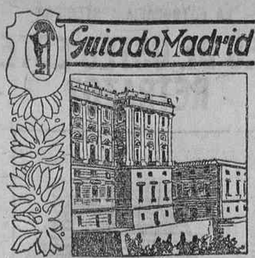
Plaza de Oriente VIII