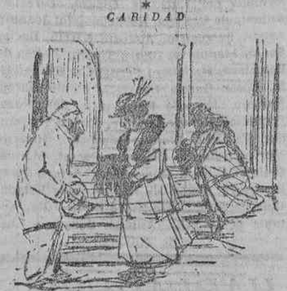
La señora, sin soltar prendas... (Le Journal Amusant.)