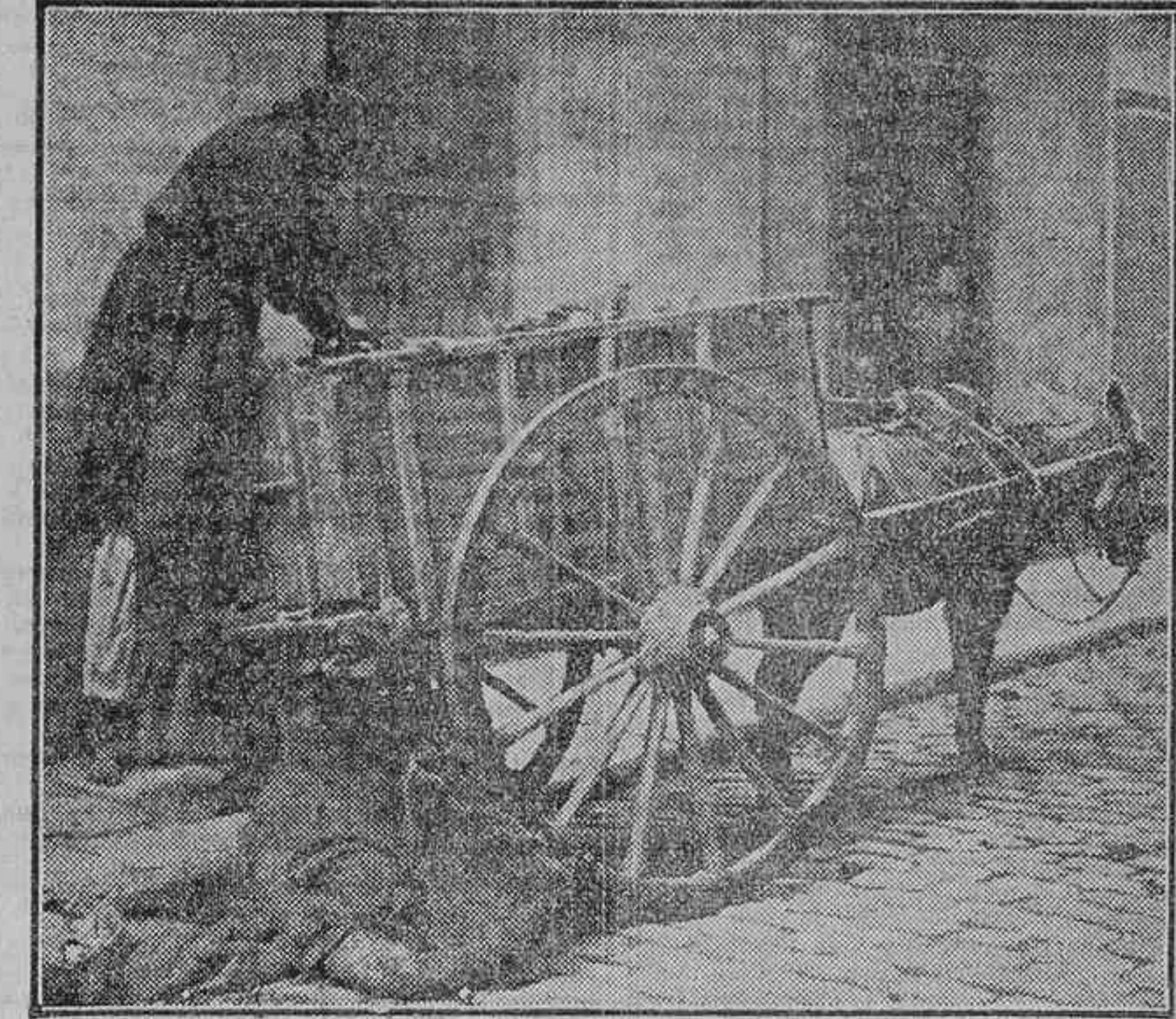
EN LA HORA DE LAS HUMILDES--POR LAS MAÑANAS, DE SIETE A NUEVE--LA TRAPEERA ES EL DOLOR DE LOS MISERABLES JUNTO AL SUEÑO TRANQUILO DE LOS POTENTADOS, QUE AUN DUERMEN...

velas rusas. Si es siempre hondo el dolor en todos los maltratados de la suerte, se hace aún más dramático en estas mujeres que se encorvan sobre lo roto, sobre lo deshecho, sobre lo que se pudre, sobre lo que quiere volver al barro. Viven a expensas de los detritus de la ciudad y sob pobres parias de la vida las mu-