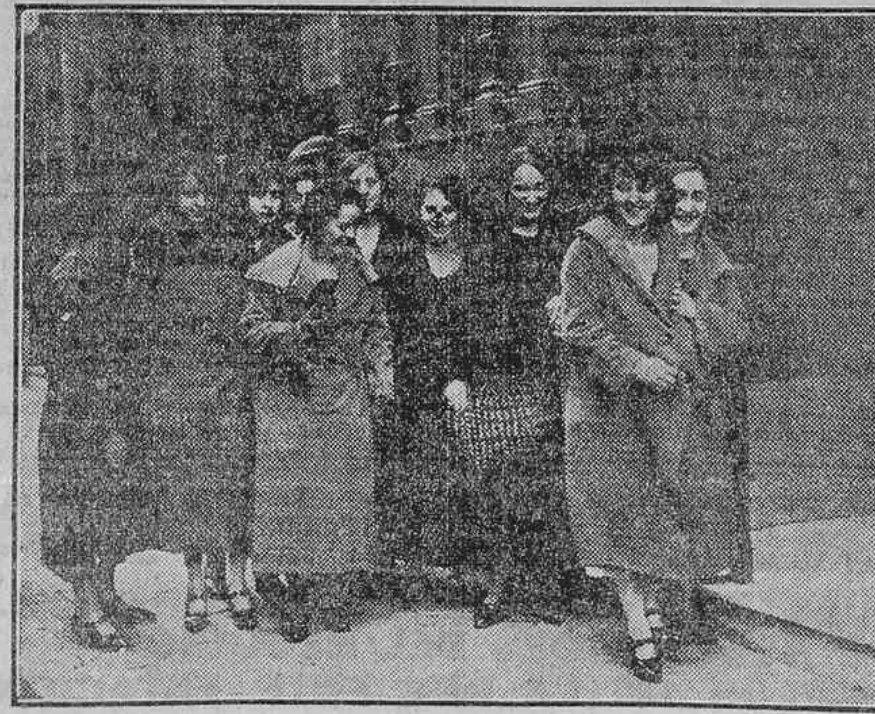
A LAS NUEVE, LA TERRIBLE HORA DEL TRABAJO: LAS MECANOGRAFAS LLEGAN A LA OFICINA, QUE YA NO TIENE MÁS QUE DAR LA VUELTA A LAS BELLAS CHICAS DEL TECLADO, AQUELLA ABRUMADORA VULGARIDAD DE ANTES...

Viene a pasar una visita de inspección a la Administración de Aduanas y otros Centros.