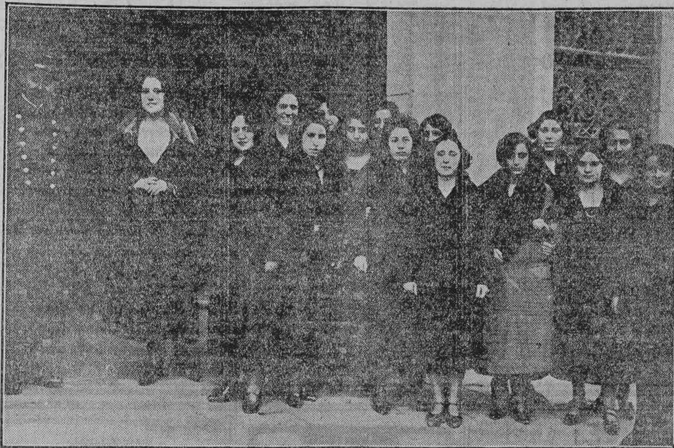
LAS MODISTAS--MADRIGAL DE ESTA SILENCIOSA HORA DE LAS HUMILDES--AGUARDAN EL MOMENTO DE ENTRADA AL TALLER, DE DONDE SALDRAN LUEGO, A LA HORA CLARA DEL MEDIO DIA, PARA LLENAR DE SONRISAS LAS CALLES DE MADRID

Por las mañanas, de siete a nueve...--Siluetas de aguafuerte.--Las modistas.--1910-1923: del chotis al "shimmy".--Las bellas chicas del teclado.--Muere la hora de las humildes