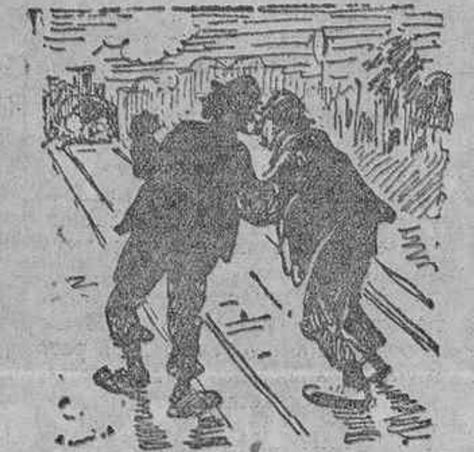
Un borracho al colega: Nada, tu estate quieto. Verás cómo la línea recta es la vía más corta para pasar de un mundo a otro (Le Journal Amusant.)