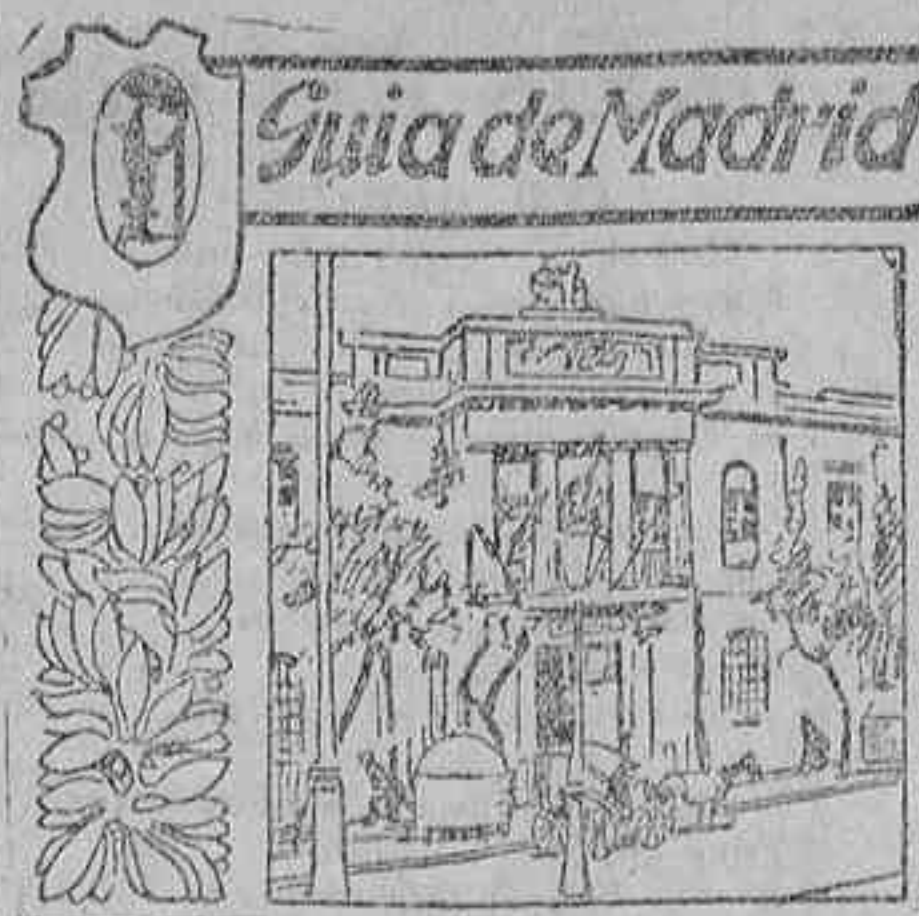
Calle de Atocha