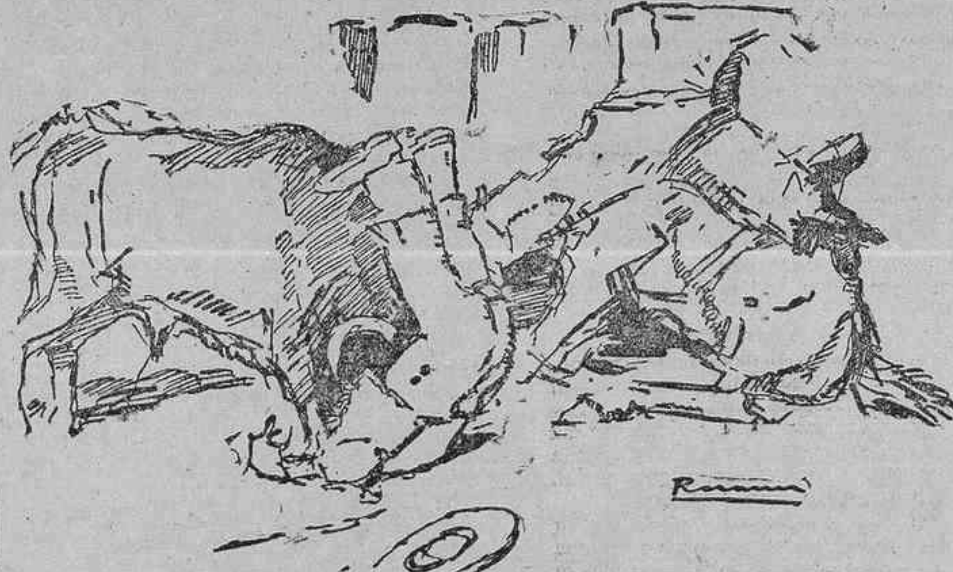
COGIDA DE VENENO

Es verdad que el domingo de Pascua, en Sevilla, no vimos volar a Chicuelo por las alturas a que ascendió en Madrid, y que lejos de eso, apenas si en tal cual lance de capa, en aquel quite y en dos o tres pases, quiso