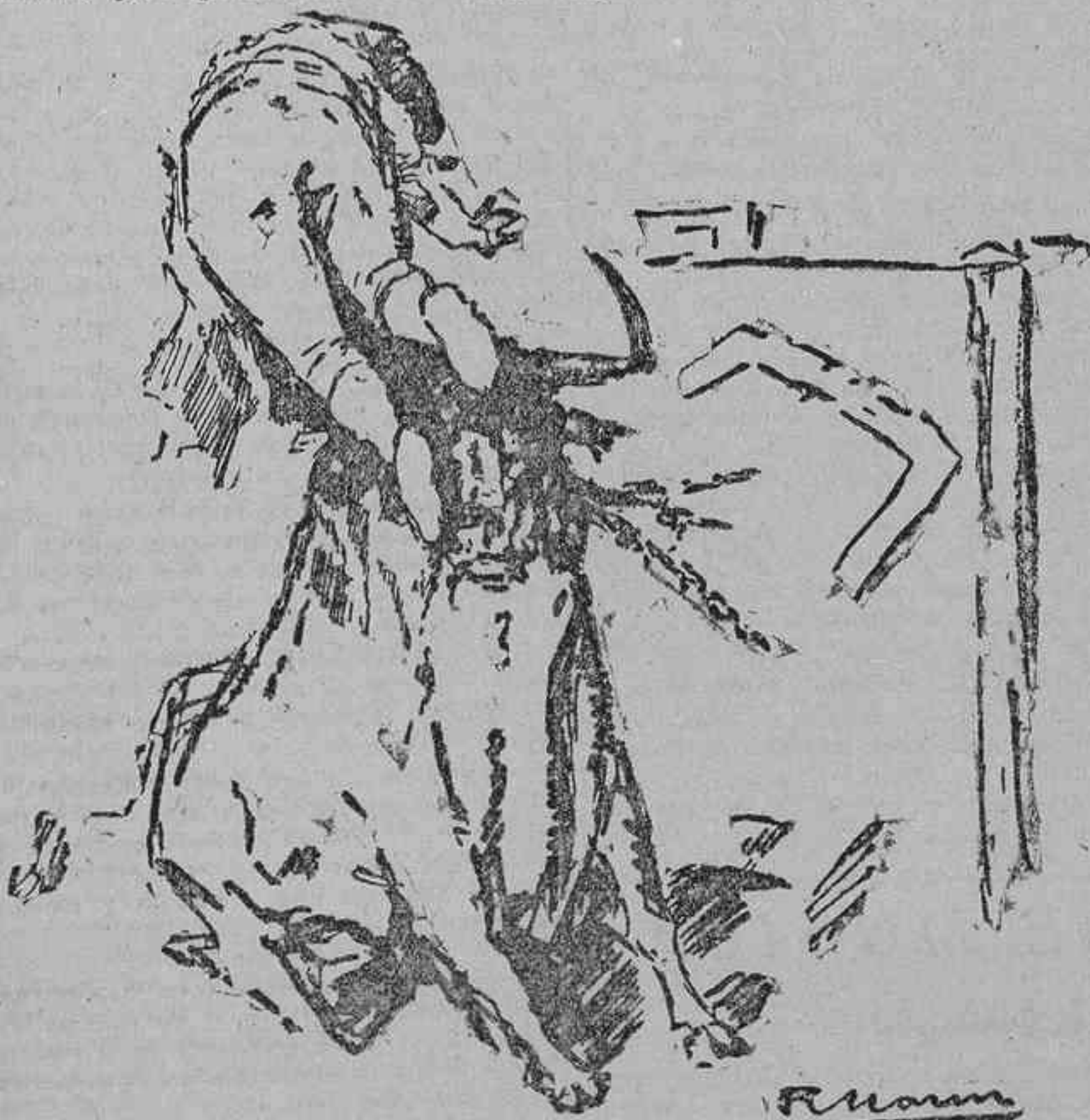
COGIDA DE FREG EN EL CUARTO TORO

Se metió en el toro y ya estuvo. Un natural, que llamaríamos escalofriante si el que le siguió no nos hubiera quitado la temperatura para todo el verano. Y cuando, al iniciar otro, el toro se lo fué a comer, el hombre se lió la muleta al cuerpo y dió el molinete más encuado, más expuesto y más emocionante que hemos visto en nuestra, ¡ay!, ya languita vida. ¡Señores, qué tío más valiente! Ríanse ustedes de los vagones para el equipaje de aquel Pepete. La plaza era un