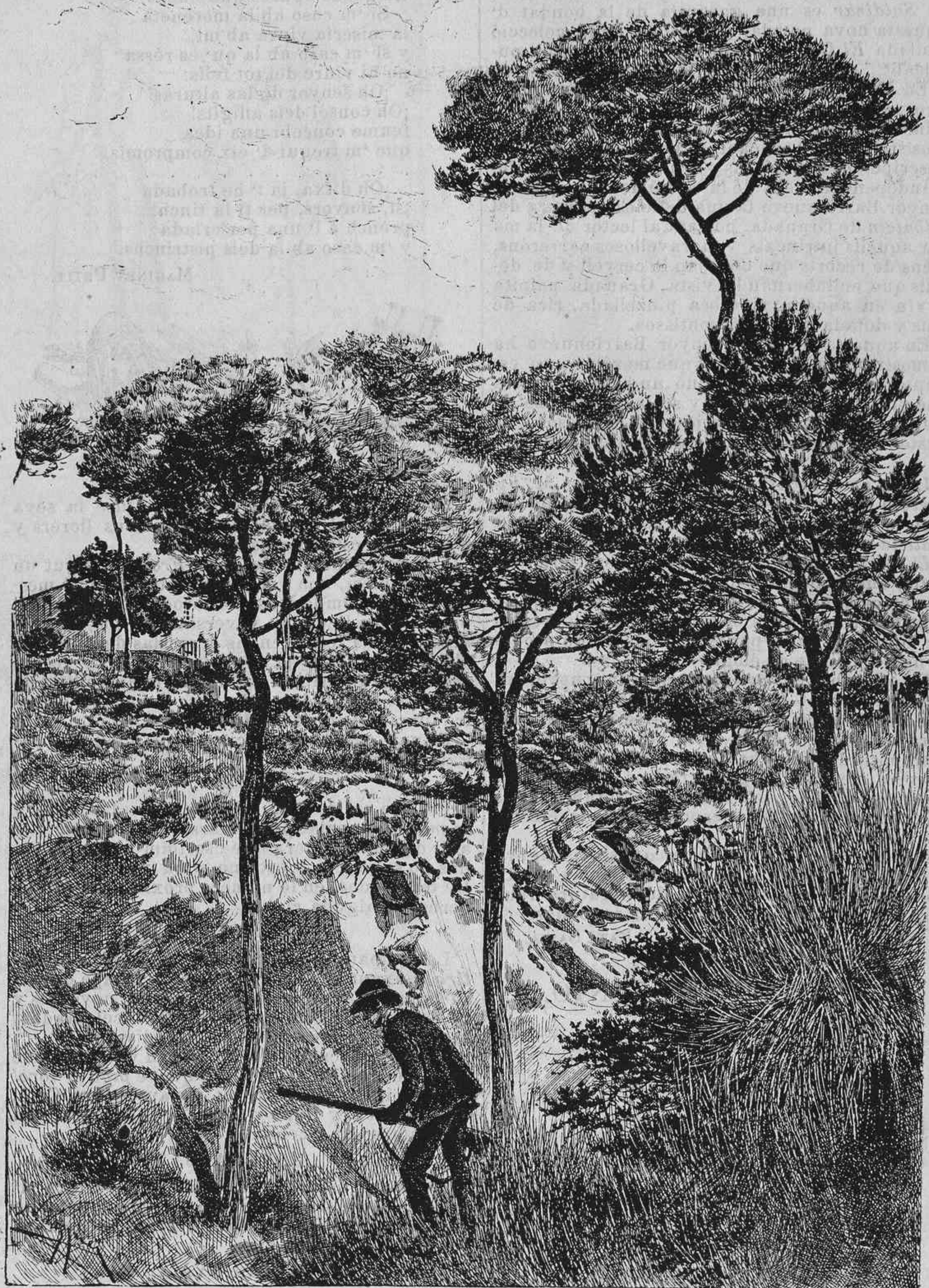
ALREDEDORS DE BARCELONA.