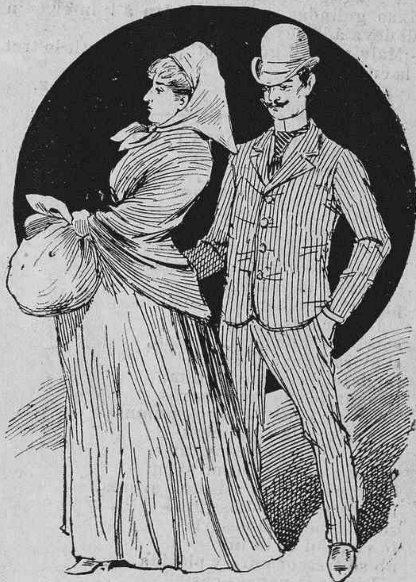
—Sinó que aixó es una carga que 'l diable que la soporti, ara ab molt gust li diria: «Pubilla. ¿vol que li porti?»