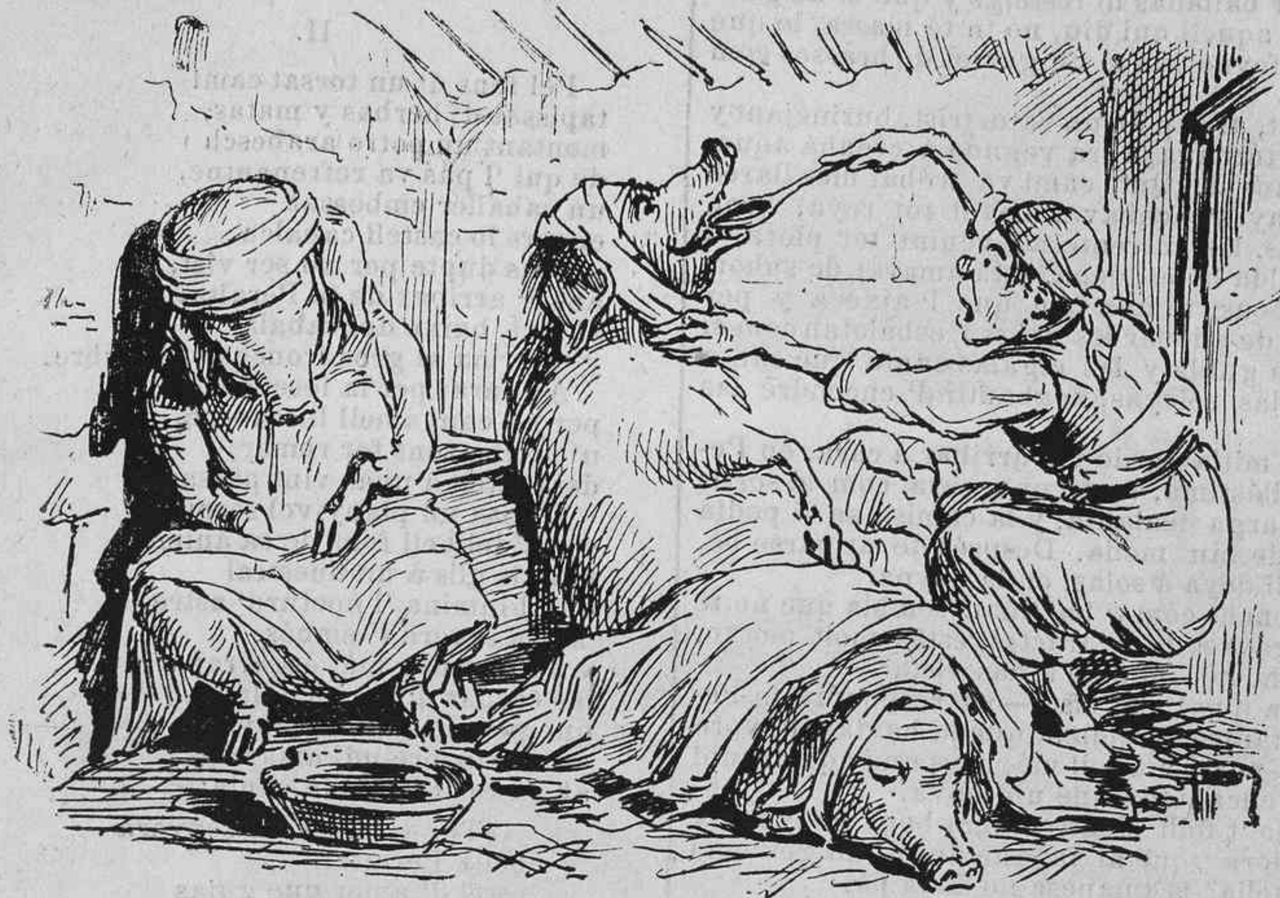
Los tocinos diu que tenen una malaltia extranya... ¡Jo crech que perque no 'ls matin han trobat aquesta manya!

un escamot de gossos tan mal carats y rabiosos, que á no portar un bon bastó de freixa de segur que 'l hagueren espallofat y esbocinat com carn de fer butifarras.