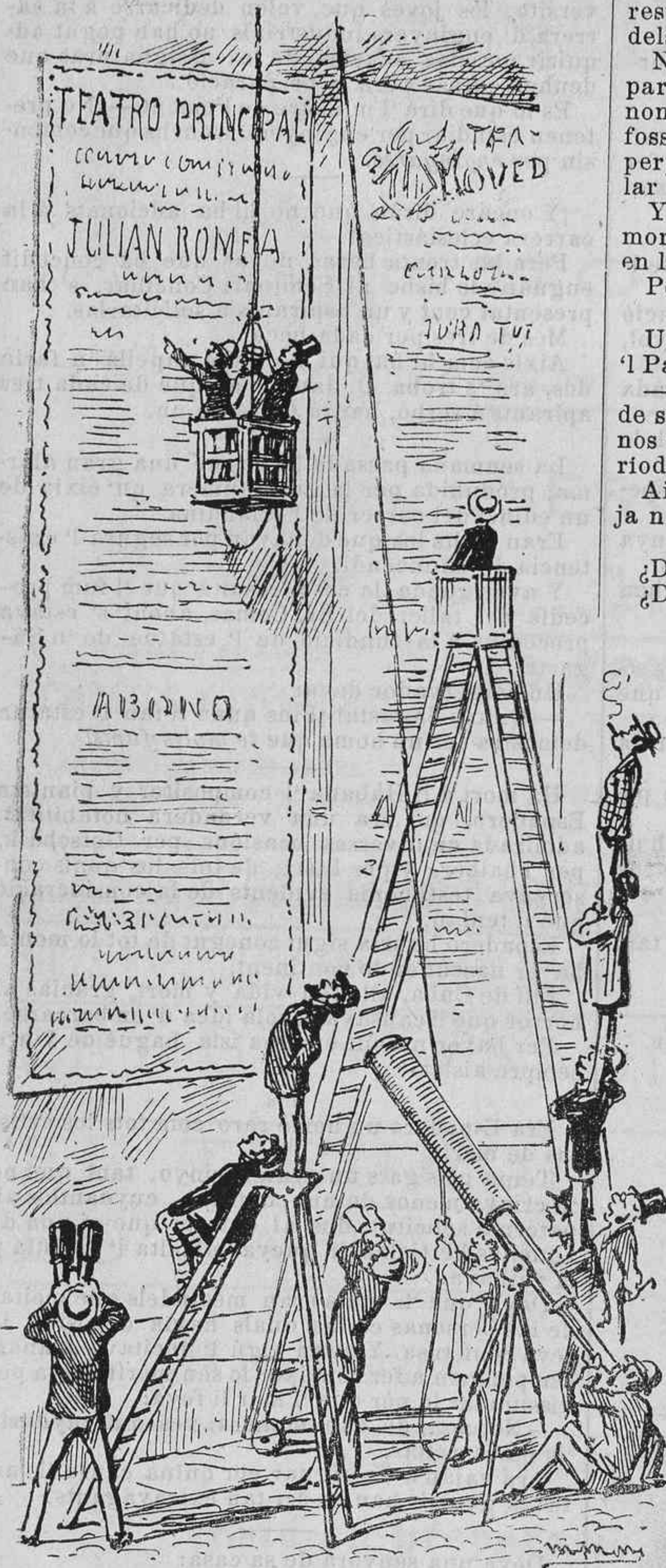
Ja que las empresas fixan uns cartells tan colossals, per llegi'ls hem de valernos de certs medis especials.

Lo concert del vuit de setembre sigüés de tot punt impossible executar cap pessa del autor de Los nèts dels Almogàvers .