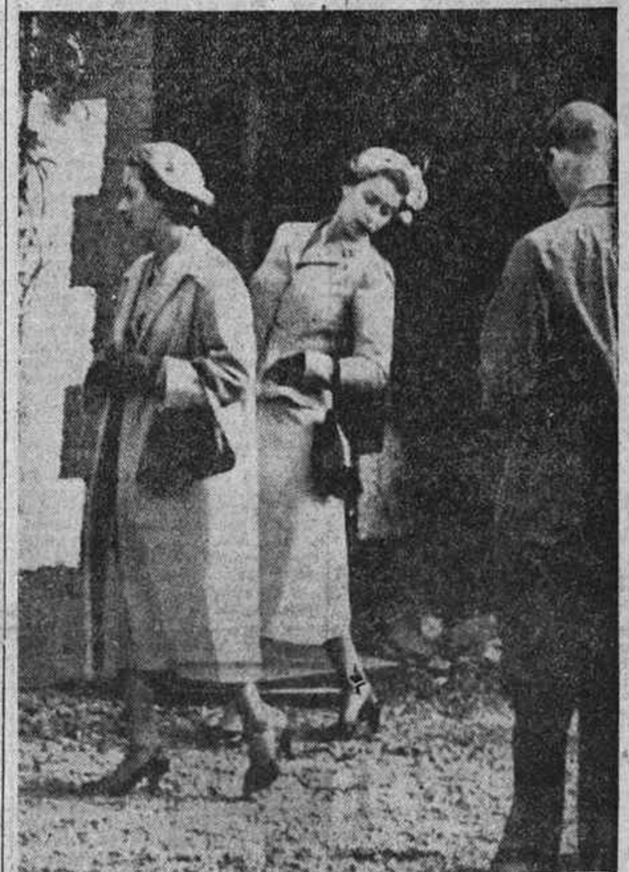
La Reina Isabel de Inglaterra observa el perenne sufrido por su hermana la princesa Margarita en una media. Al ducado de Edimburgo, de espaldas en la foto, no parece preocuparle el "problema".