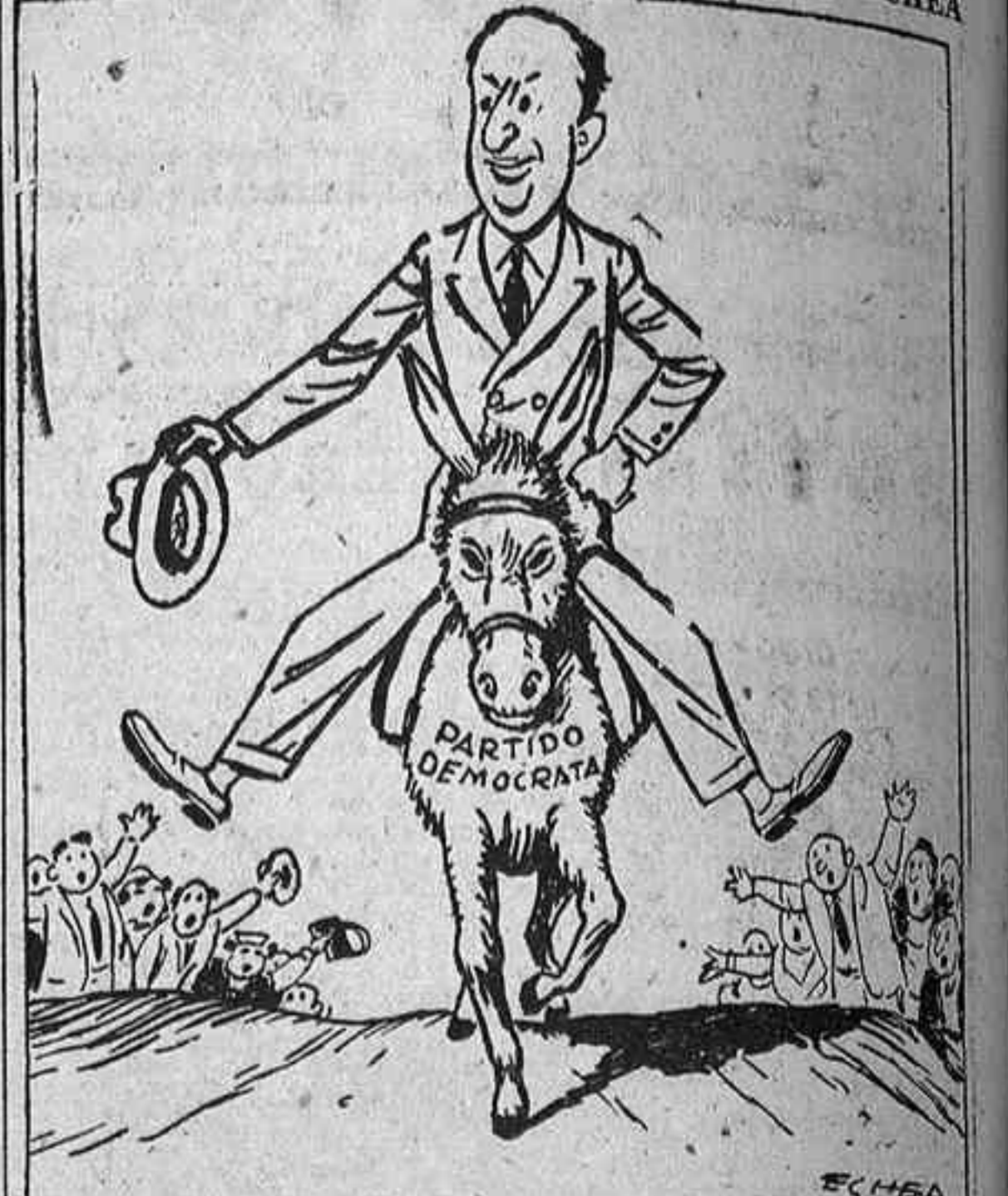
STEVENSON.—Hasta ahora parece que no tiene muy mal andar esta cabalgadura.