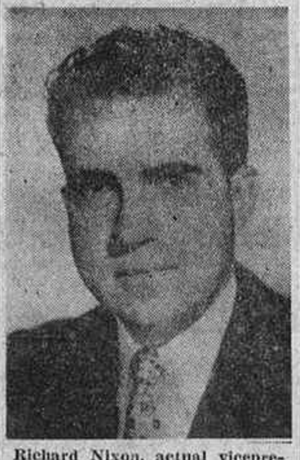
Richard Nixon, actual vicepresidente de los Estados Unidos