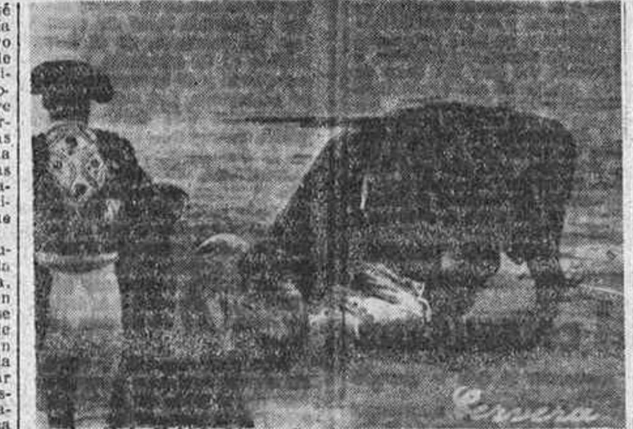
Durante la faena al quinto novillo, en Vista Alegre, el debutante Limeño pasó momentos de grave peligro al buscar presa los cuernos del astado. Por fortuna, todo se redujo a pequeñas erosiones en la cabeza, producidas con las pezuñas del novillo.