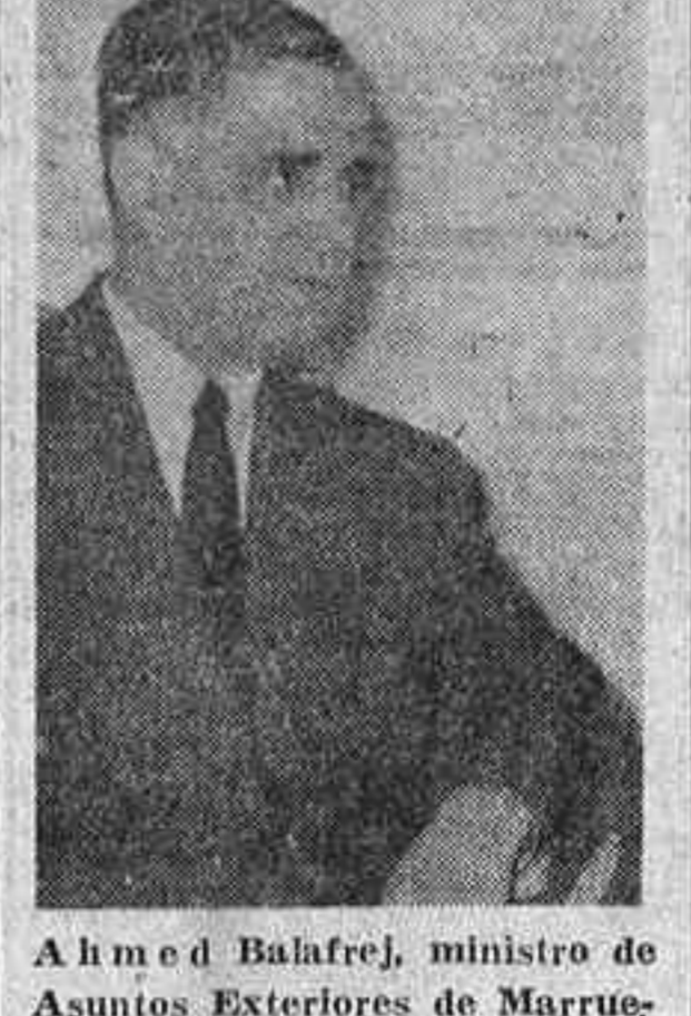
Ahmed Balafrej, ministro de Asuntos Exteriores de Marruecos.