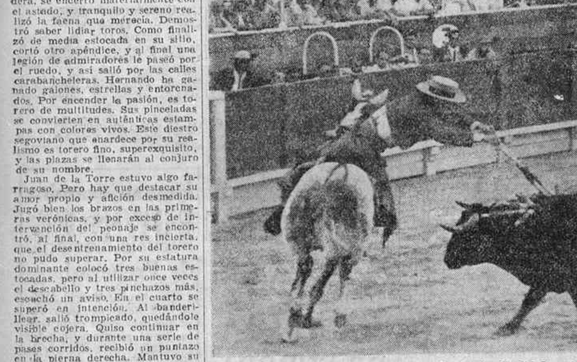
En su primera actuación en la feria de Valencia, Carlos Arruza ha logrado un éxito extraordinario como rejoneador, principalmente por el arte de que ha hecho alarde como caballista al rejonear y poner banderillas a caballo, con un estilo y una perfección que se considerarían increíbles en quien todavía no hace mucho que empezó a practicar el deporte de montar a caballo, para llegar a ser hoy en día uno de los más completos y espectaculares artistas en su especialidad, después de haber sido una de las más destacadas figuras del toreo contemporáneo. Arruza, que fué recibido por el público con clamorosas ovaciones, viéndose obligado a dar la vuelta al ruedo a caballo antes de comenzar su actuación, fué asimismo ovacionado después por sus alardes de caballista y rejoneador, con no menos entusiasmo. Hay verdadera expectación por presenciar su segunda actuación en esta feria, en la que seguramente le espera un nuevo triunfo definitivo.—R.