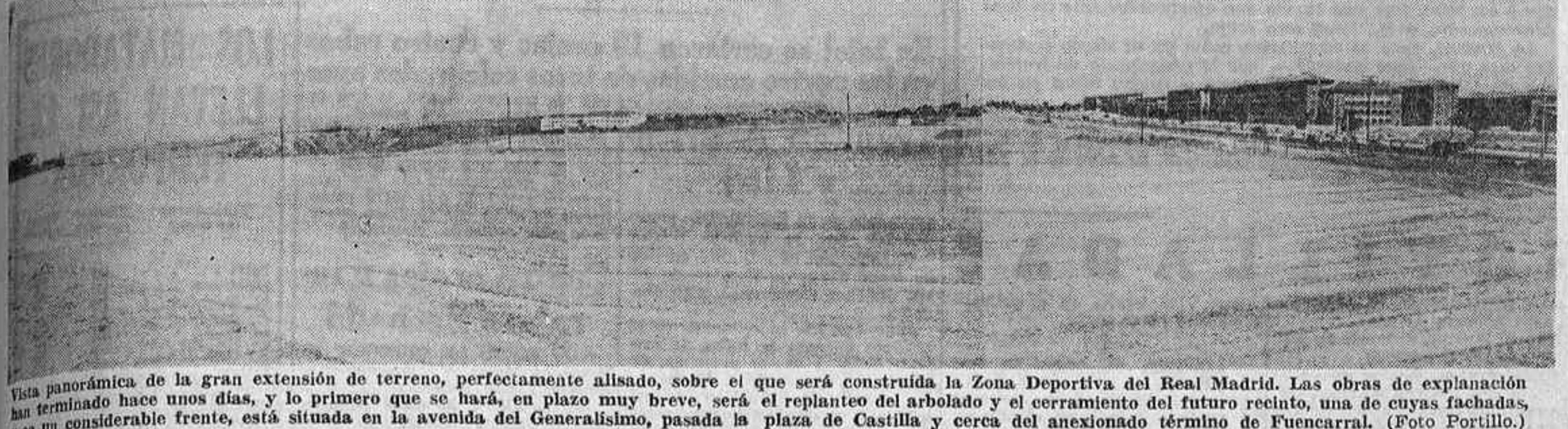
Vista panorámica de la gran extensión de terreno, perfectamente alisado, sobre el que será construida la Zona Deportiva del Real Madrid. Las obras de explanación han terminado hace unos días, y lo primero que se hará, en plazo muy breve, será el replanteo del arbolado y el cerramiento del futuro recinto, una de cuyas fachadas, y en un considerable frente, está situada en la avenida del Generalísimo, pasada la plaza de Castilla y cerca del anexionado término de Fuencarral.

Hace unas horas tan sólo que han finalizado las obras de explanación y organización de los terrenos sobre los que próximamente se levantará la zona deportiva del Madrid. Efectivamente, el pasado viernes fue retirada la maquinaria pesada que ha hecho posible que en veinticinco días se haya hecho lo que normalmente se haría en un año y medio.