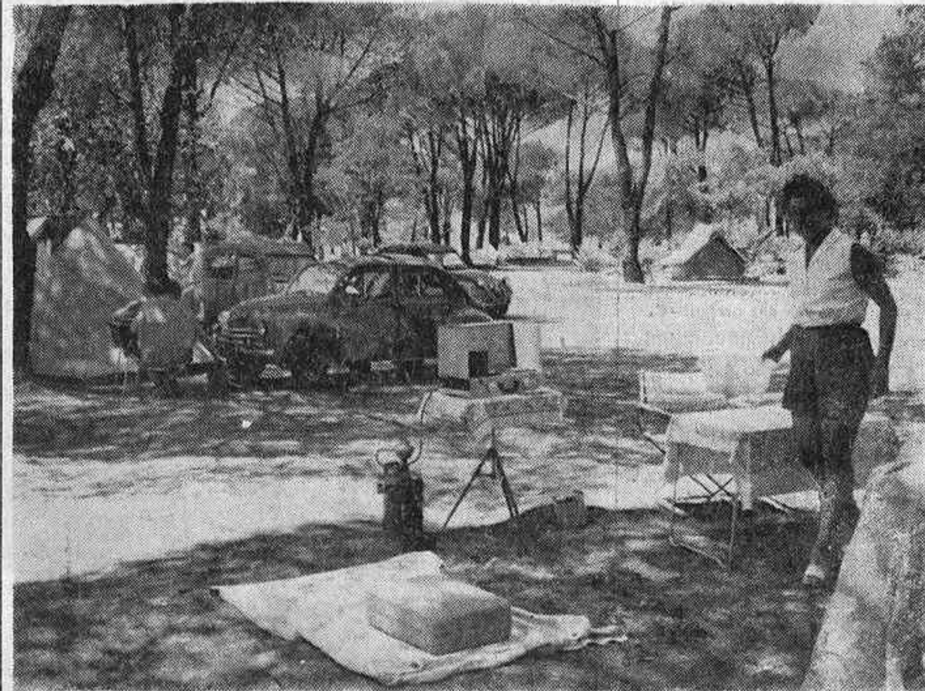
He aquí un aspecto de la zona de la Casa de Campo dedicada a la modalidad turístico-deportiva del "camping". De ese tipo de campamentos, que en esta época pueblan media Europa, esto es lo que puede ofrecer Madrid a los numerosos extranjeros que con sus tiendas de campaña y sus coches con remolques habitables...

Madrid carece todavía de un verdadero campamento turístico-deportivo de tipo urbano, que poseen ya muchas capitales de provincia