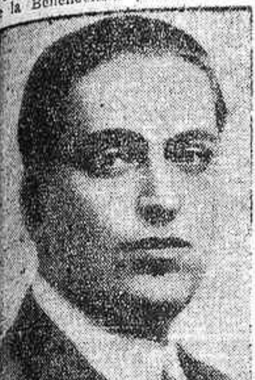
Don José Calvo Sotelo