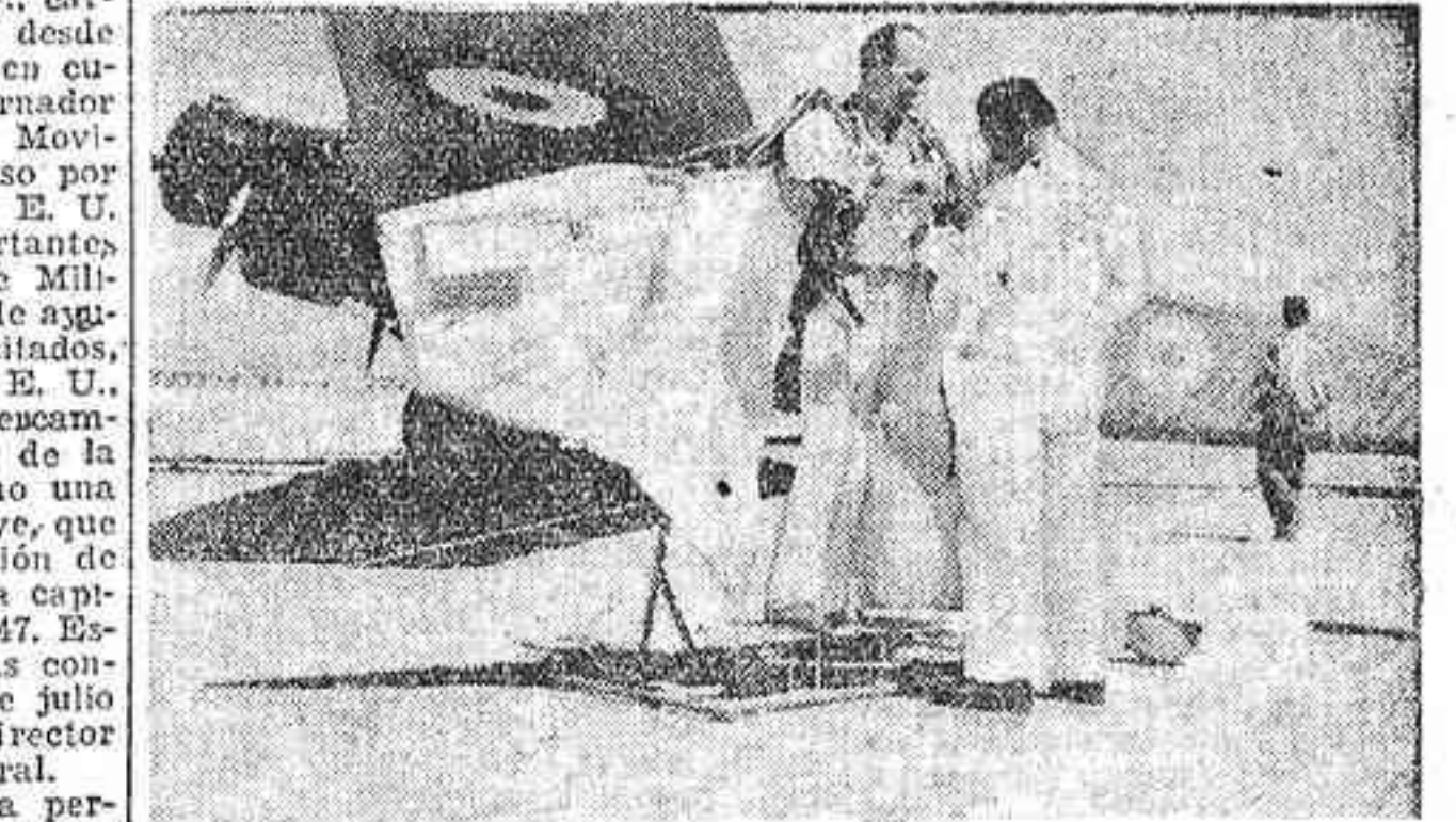
En el aeródromo de Cuatro Vientos, del Aero Club de Madrid, se verificó ayer una exhibición del llamado "hombre-pájaro", el suizo Rudolf Boehlen...

Se titula "el hombre-pájaro" y es empleado del Ayuntamiento de Basilea