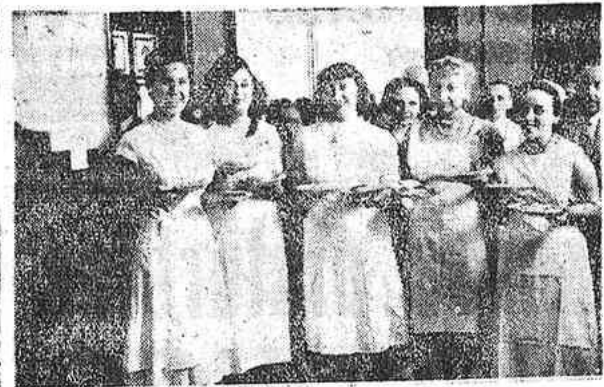
Este grupo de señoritas, entre las que se encuentra la titulada "Señorita Carmen de Chamberí 1952"...

Fueron elegidas la "Carmen de Chamberí 1952" y las señoritas de su Corte de honor