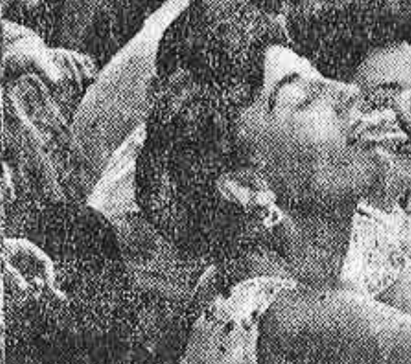
Pese a las orejas que se cortaron y a las ovaciones que se oyeron...