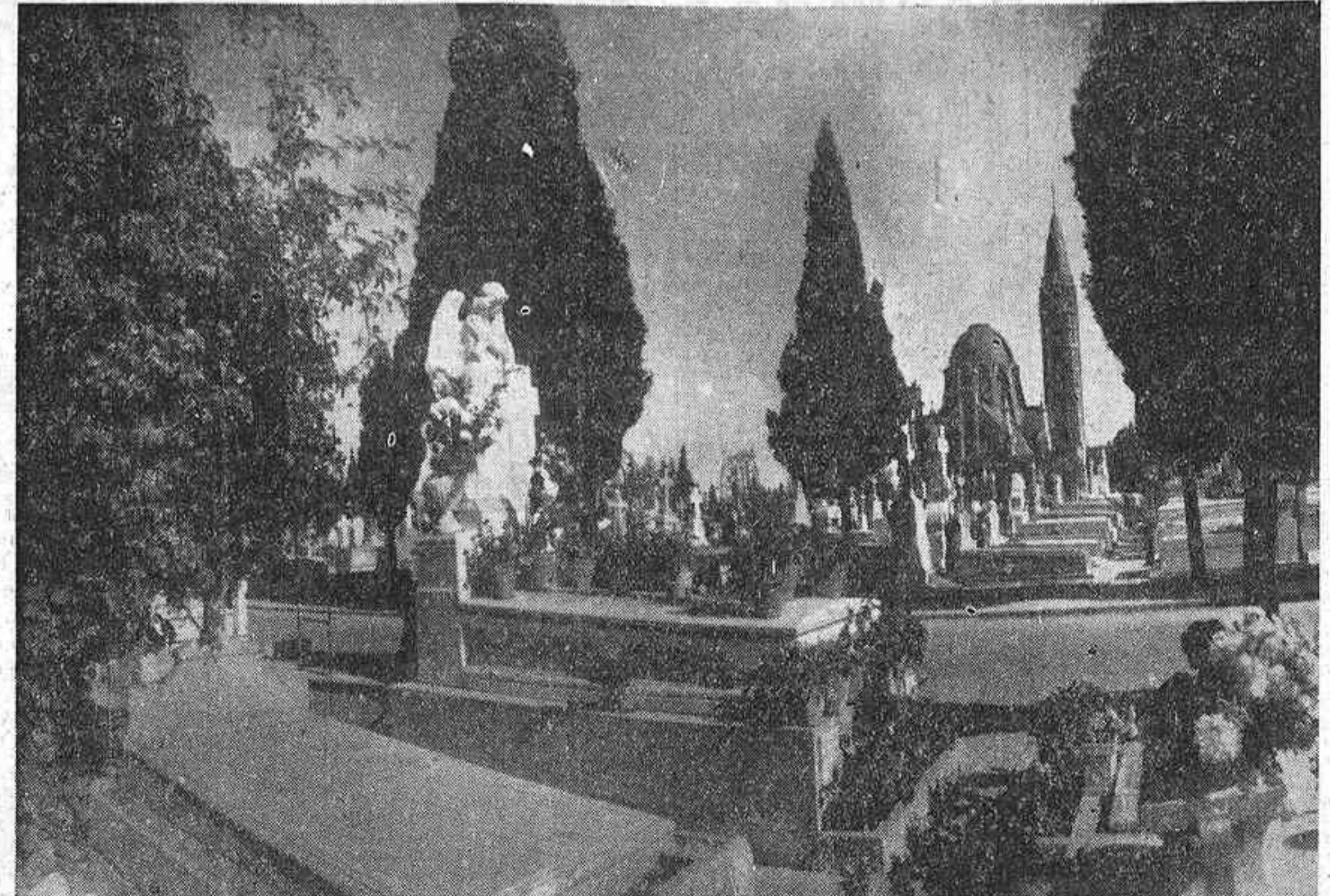
Hoy, como todos los años en tal día, el cementerio de Nuestra Señora de la Almudena y las sacramentales madrileñas son lugares de peregrinación para quienes salen de las penas sin consuelo...