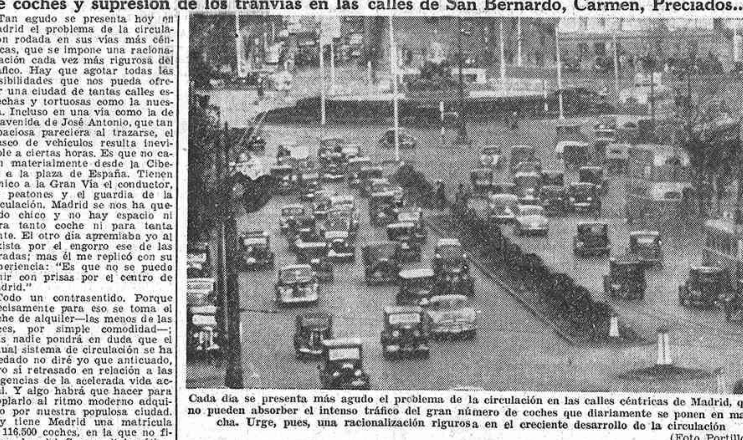
Cada día se presenta más agudo el problema de la circulación en las calles céntricas de Madrid, que no pueden absorber el intenso tráfico del gran número de coches que diariamente se ponen en marcha...