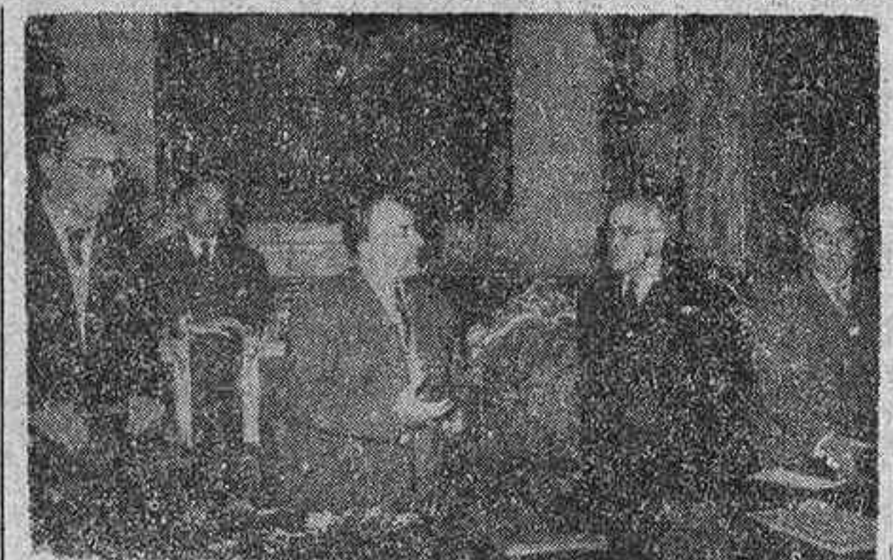
El director general de Prensa, don Juan Aparicio, al contestar a las palabras de bienvenida que pronunció el alcalde de Valencia al dar comienzo al Consejo Nacional y Regional de Prensa celebrado en aquella ciudad.

VALENCIA, 5. —El ministro de Información y Turismo, don Gabriel Arias Salgado, ha clausurado hoy, con un brillante discurso en el salón de Cortes de la Generalidad, el Consejo Nacional y Regional de Prensa. El ministro oyó misa en la Iglesia del Patriarca, y después de un momento de reposo, se dirigió a la Diputación, en unión del director general de Prensa, don Juan Aparicio, y fue recibido por el presidente, señor Cerda. Visitó, primeramente, en el salón de Cortes, la magnífica colección de mariposas e insectos, de don Juan Torres Sala, compuesta por más de 90.000 ejemplares, y a continuación pasó al despacho de la presidencia, conversando con el señor Cerda. Más tarde, en el salón de Cortes, se celebró la sesión de clausura del Consejo. El ministro ocupó la presidencia, y a su derecha se sentaron el capitán general de la región, el gobernador civil y el rector de la Universidad, y a su izquierda, el arzobispo, el presidente de la Diputación, el general jefe de la Región aérea y el alcalde. El salón en el que se verificó este acto es una de las joyas arquitectónicas de Valencia, y en sus paredes cuelgan lienzos que representan antiguos momentos de las Cortes valencianas.