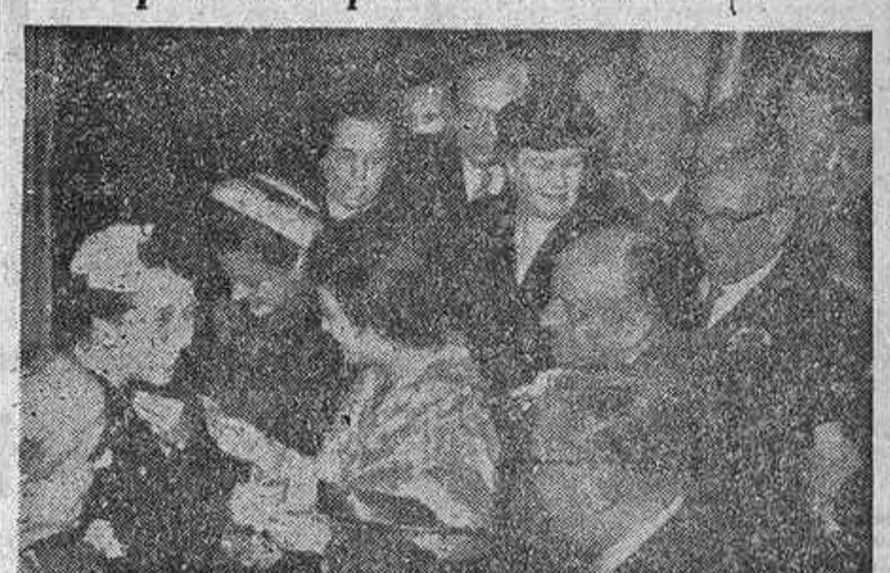
La esposa de Su Excelencia el Jefe del Estado conversando con algunos de los artistas que intervinieron en el festival pro Campaña de Navidad celebrado ayer brillantísimamente en el teatro Calderón.