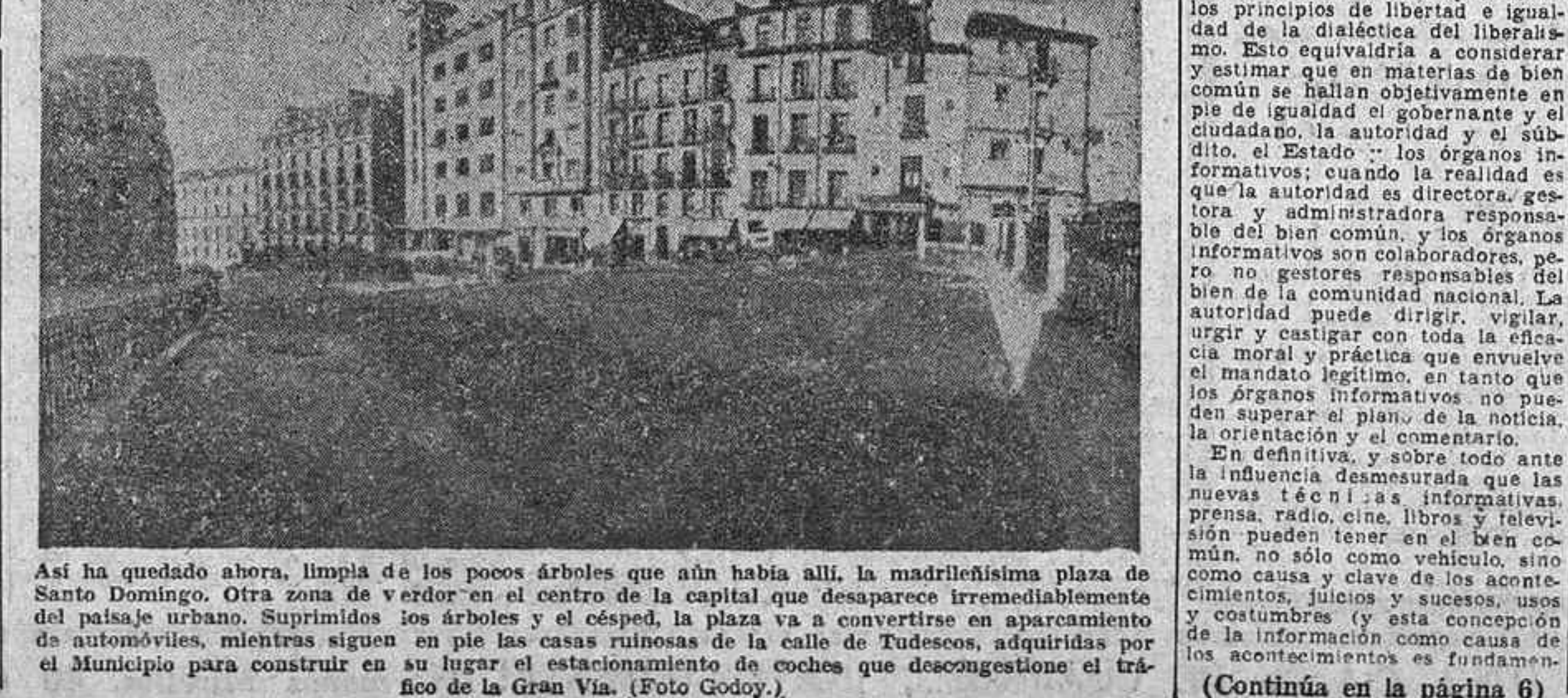
Así ha quedado ahora, limpia de los pocos árboles que aún había allí, la madrilenísima plaza de Santo Domingo. Otra zona de verdor en el centro de la capital que desaparece irremediablemente del paisaje urbano. Suprimidos los árboles y el césped, la plaza va a convertirse en aparcamiento de automóviles, mientras siguen en su lugar el estacionamiento de coches que descomponen el tráfico de la Gran Vía.