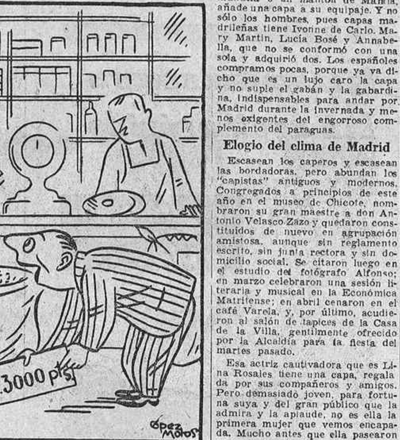
—Mire usted qué bajos pongo yo los precios.