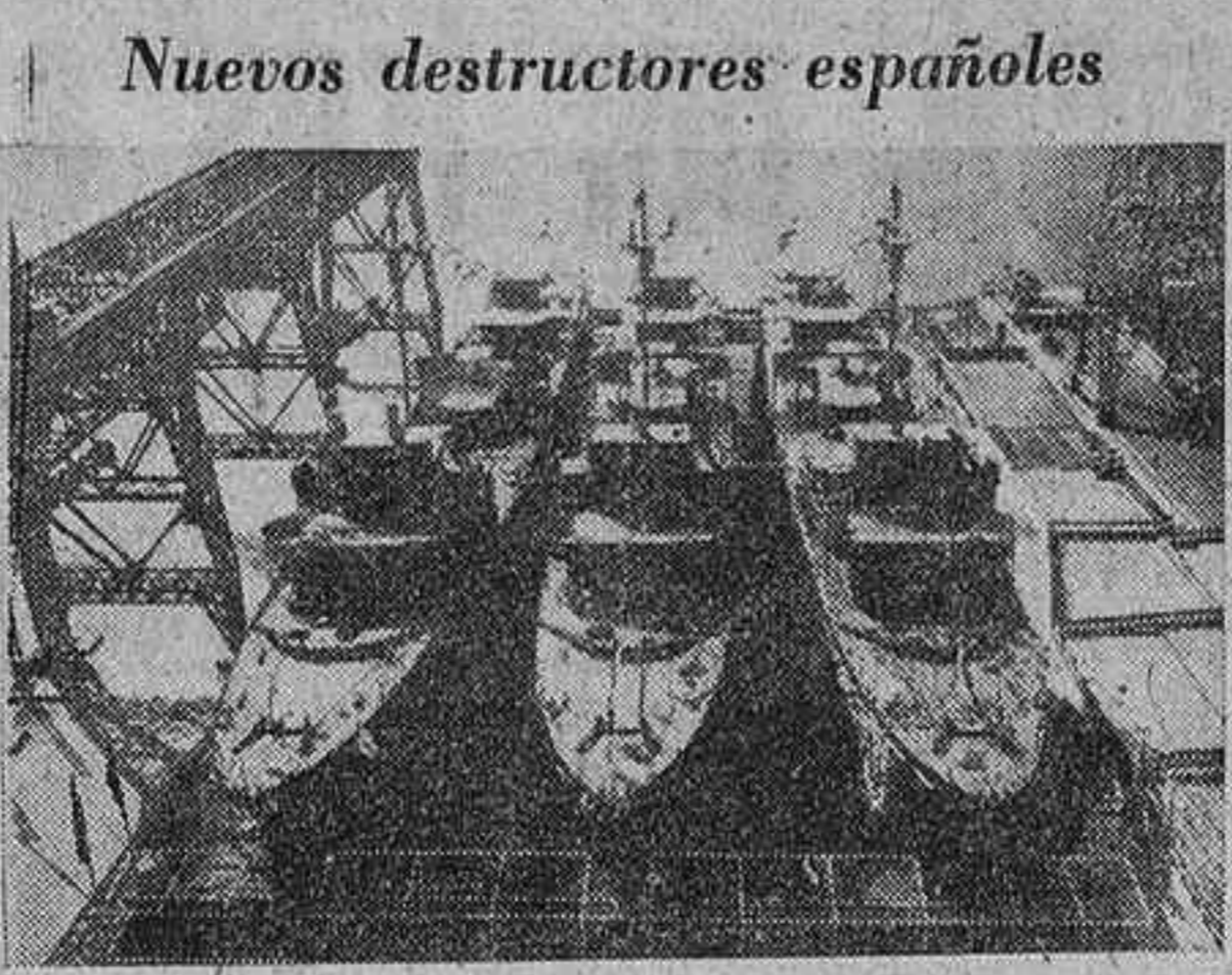
Nuevos destructores españoles. Esta foto muestra en las gradas de los astilleros de El Ferrol del Caudillo, poco antes de su lanzamiento al mar, a los tres nuevos destructores: "Osado", "Rayo" y "Meteoro", construidos para nuestra Marina de guerra. El acto de la botadura fué presidido por Su Excelencia el Jefe del Estado, Generalísimo Franco, con asistencia de varios ministros del Gobierno y otras personalidades. Las características de los buques son: eslora, 93,835 metros; manga, 9,500; puntal, 5,200; desplazamiento, normal, 1.523 toneladas; velocidad, 32,5 nudos. Y el armamento constará de tres montajes sencillos de 105 milímetros antiaviones, dos ametralladoras antiaéreas dobles de 37 milímetros y otras dos dobles de 20, dos equipos triples de tubos lanzatorpedos, cuatro lanzacargas de profundidad y una instalación para fondos de minas. La dotación de cada destructor será de 162 hombres.

Algalá, 23. Avenida Calvo Sotelo, 11, y Palacio Hotel