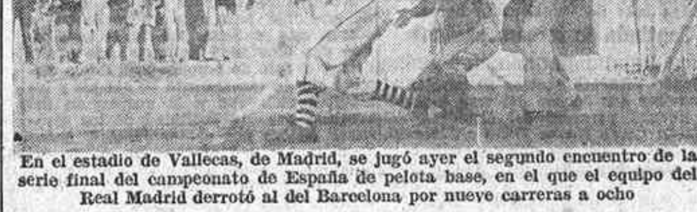
En el estadio de Vallecas, de Madrid, se jugó ayer el segundo encuentro de la serie final del campeonato de España de pelota base, en el que el equipo del Real Madrid derrotó al del Barcelona por nueve carreras a ocho.

GIJÓN.—Con asistencia del ministro de Justicia, señor Fernández Cuesta, se celebró el primer campeonato nacional de traperillas organizado por el Ayuntamiento de la citada localidad y patrocinado por la Dirección General de Propaganda. El jurado de honor estaba presidido por el ministro de Justicia, señor Fernández Cuesta; embajador de Portugal, director general de Propaganda, presidente de la Diputación de Guipúzcoa y otras autoridades.