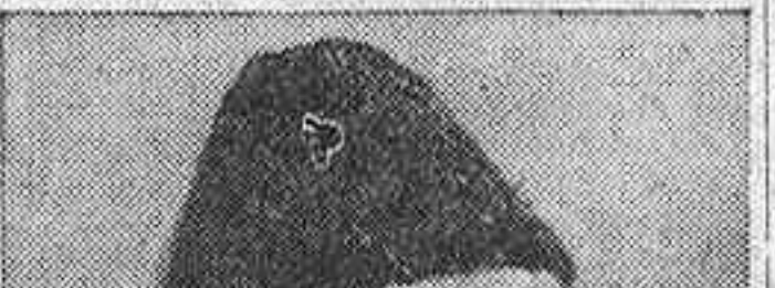
Mohamed Ali Jinnah, gobernador general del Pakistán, que ha sido nombrado presidente de la Asamblea Constituyente del nuevo dominio.

Resultaron cuatro personas muertas y veinte heridas