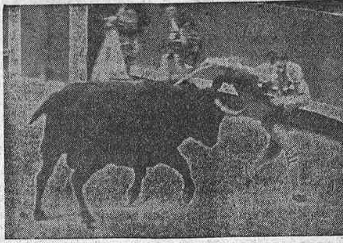
La corrida (?) de ayer en las Ventas constituyó un auténtico desastre. ¿Lo dudán ustedes?... Pues para muestra basta un botón: el de esta fotografía. ¿Y todavía se extrañan los aficionados de que la gente se vaya al fútbol?...