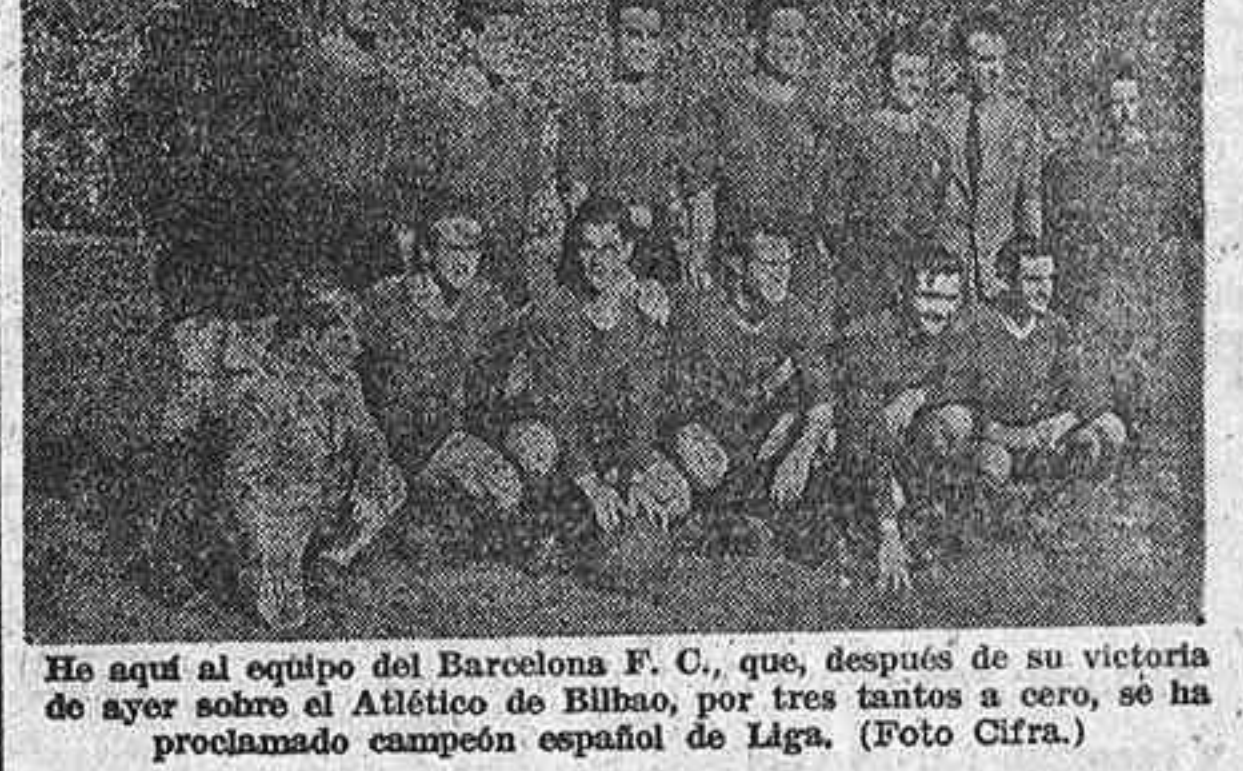
En aquí al equipo del Atlético de Bilbao, por tres tantos a cero, se ha proclamado campeón español de Liga.

En su lugar, ascienden a Primera el Real Valladolid y el Deportivo de La Coruña