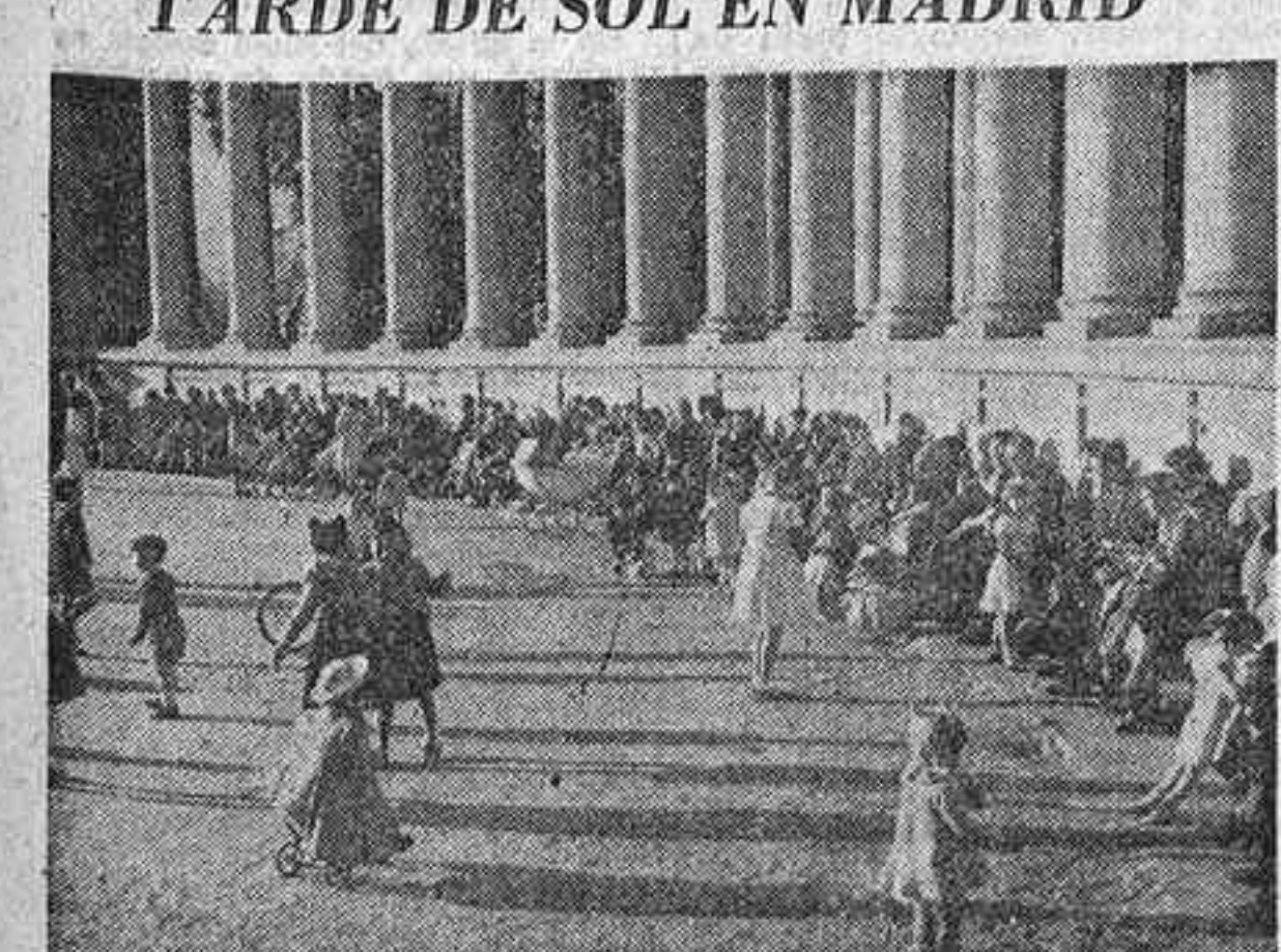
El día de ayer fue realmente de primavera en Madrid. Y aprovechando el sol radiante y la benigna temperatura, la ciudad entera se volcó en las calles y abarrotó los jardines. Nuestro grabado muestra la explanada del monumento a don Alfonso XII en el Retiro, llena totalmente de niños que juegan.