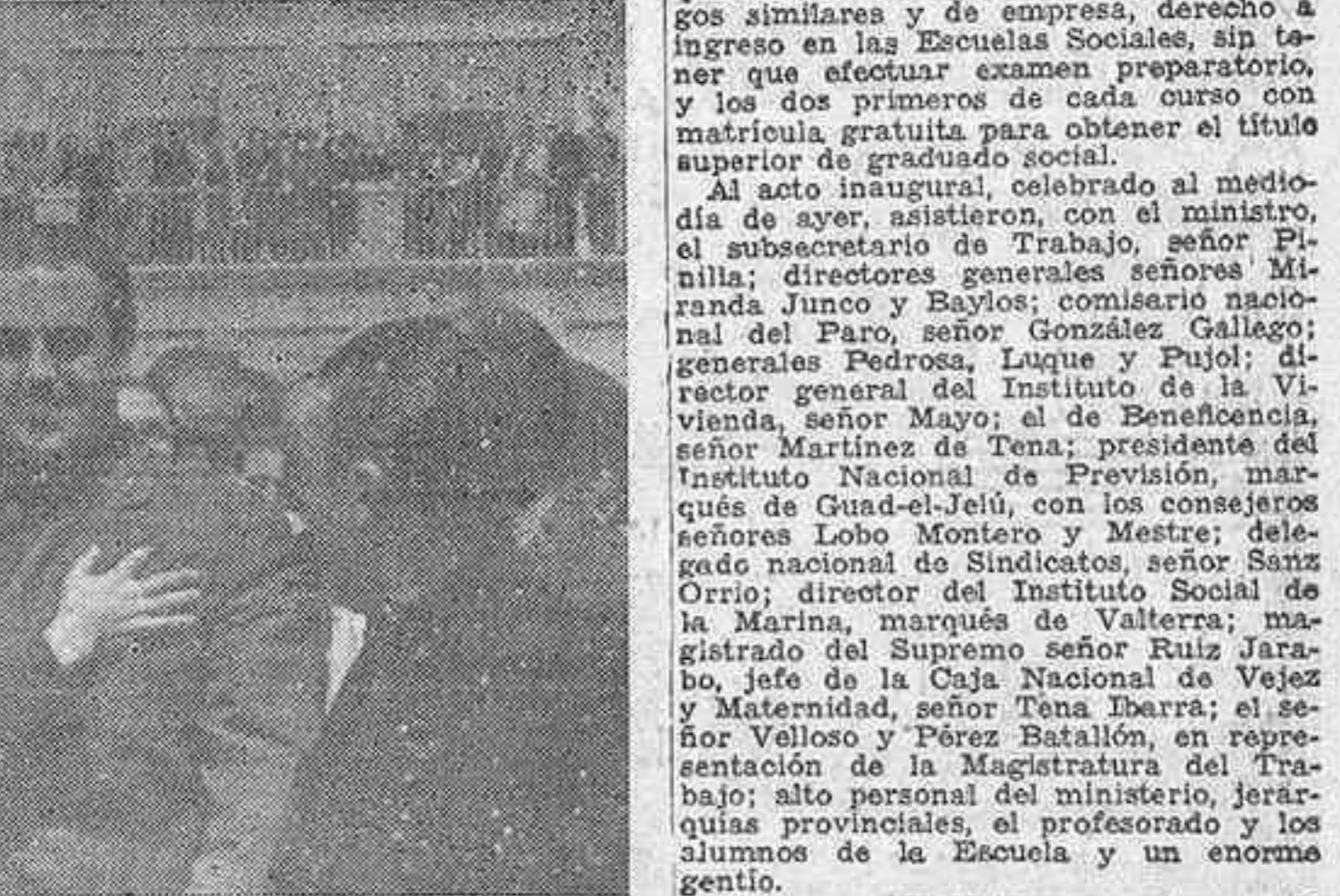
Después del solemne acto inaugural de la Escuela de Capacitación Social de Trabajadores, el ministro de Trabajo, señor Girón, es entusiastamente abrazado por los obreros que estudian en dicha institución.

"Nosotros sabremos oponer, dijo el ministro, a las ficciones políticas, nuestras realidades sociales; a sus egoísmos, el sacrificio; a sus odios, la hermandad"