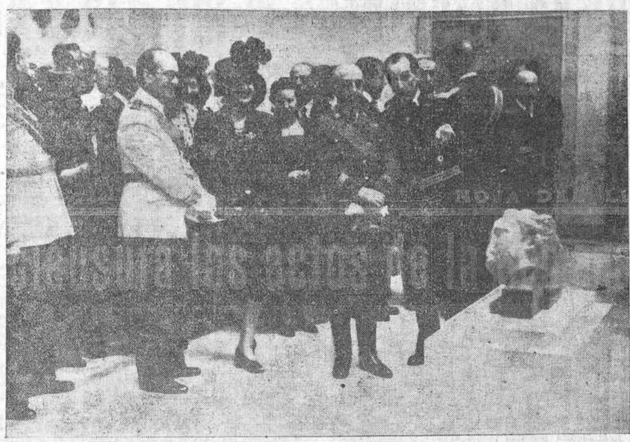
El Caudillo visita las instalaciones del nuevo Museo Arqueológico de Sevilla, por él inaugurado durante su estancia en la capital andaluza. (Foto Cifra).

El Caudillo clausura los actos de la Semana de Nebrija. El generalísimo, don Francisco Franco, clausura los actos de la Semana de Nebrija en el Museo Arqueológico de Sevilla. El generalísimo, don Francisco Franco, clausura los actos de la Semana de Nebrija en el Museo Arqueológico de Sevilla. El generalísimo, don Francisco Franco, clausura los actos de la Semana de Nebrija en el Museo Arqueológico de Sevilla.