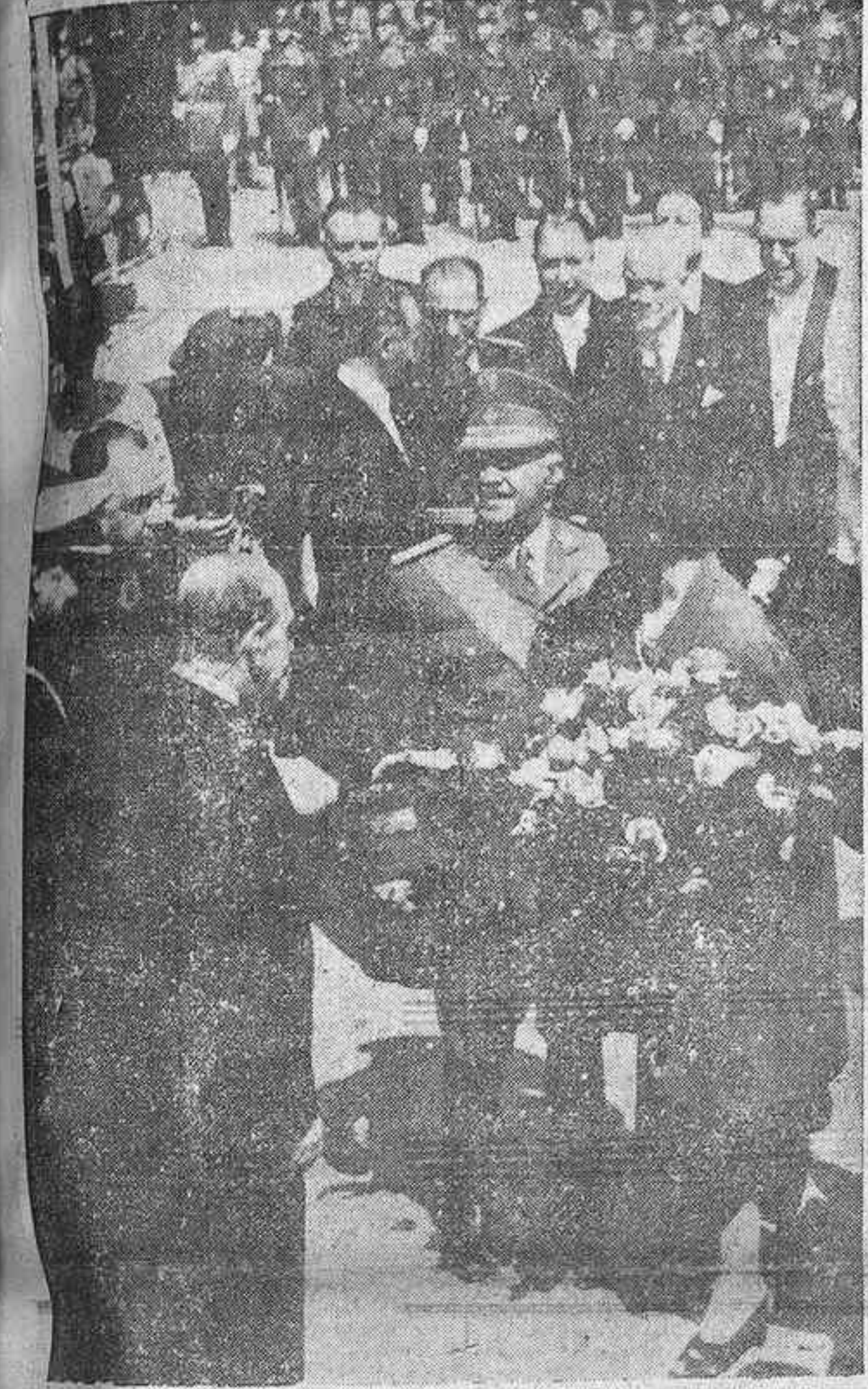
Su Excelencia el Jefe del Estado, acompañado de su esposa, llega al palacio de Bellas Artes de Sevilla y es saludado por las autoridades momentos antes de dar comienzo el acto de inauguración del Museo Arqueológico.