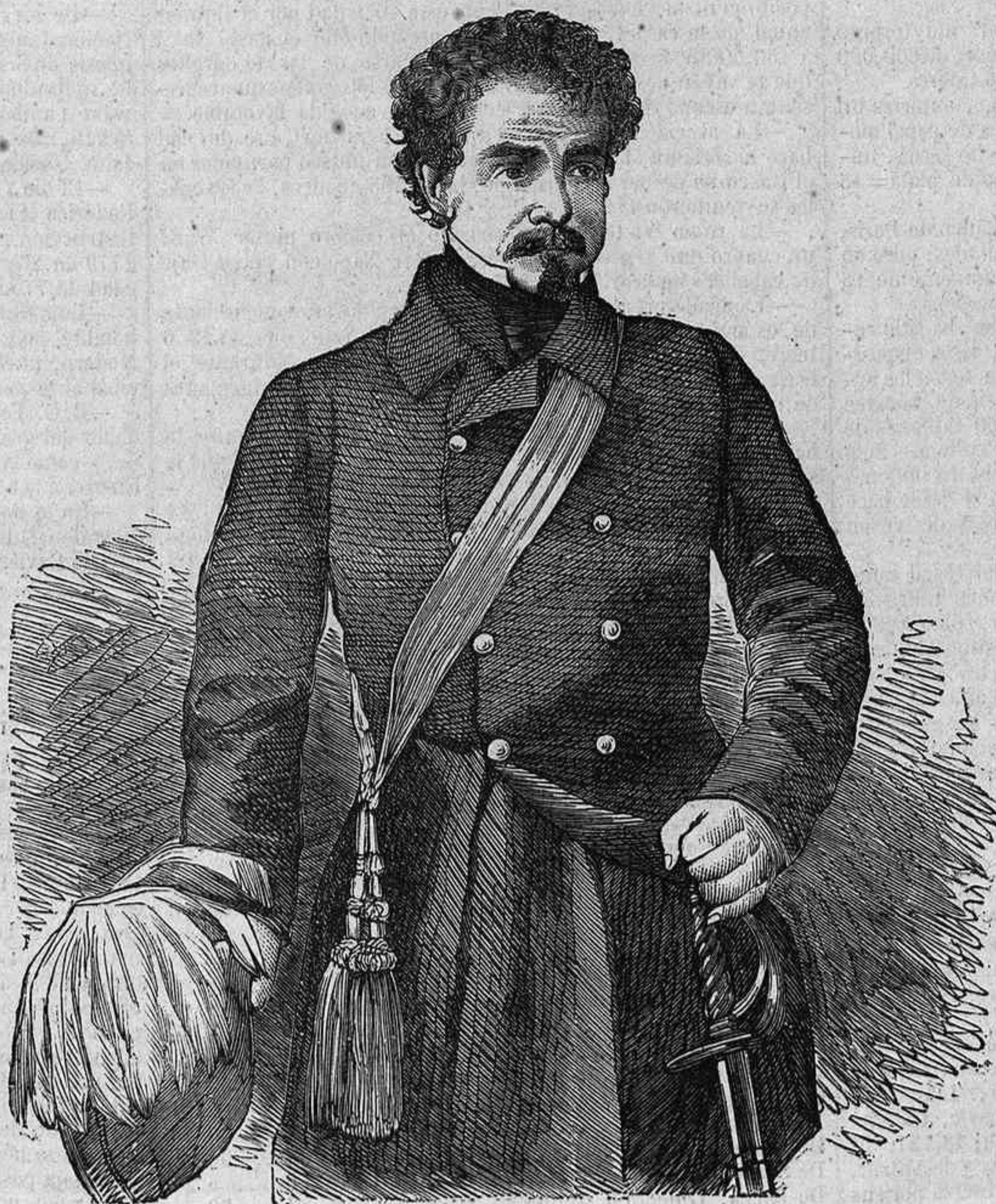
El general SIR COLIN CAMPBELL, jefe de la brigada de montañeses de Escocia en la Crimea.

—El Diario de Francfor dice, que el ministro de Culto é Instruccion pública de Austria, ha requerido á los obispos lombardo-venetos, á que retiren las disposiciones dictadas en cuanto á la censura de obras, y suspendiesen toda ulterior providencia relativa al cumplimiento de las determinaciones com-