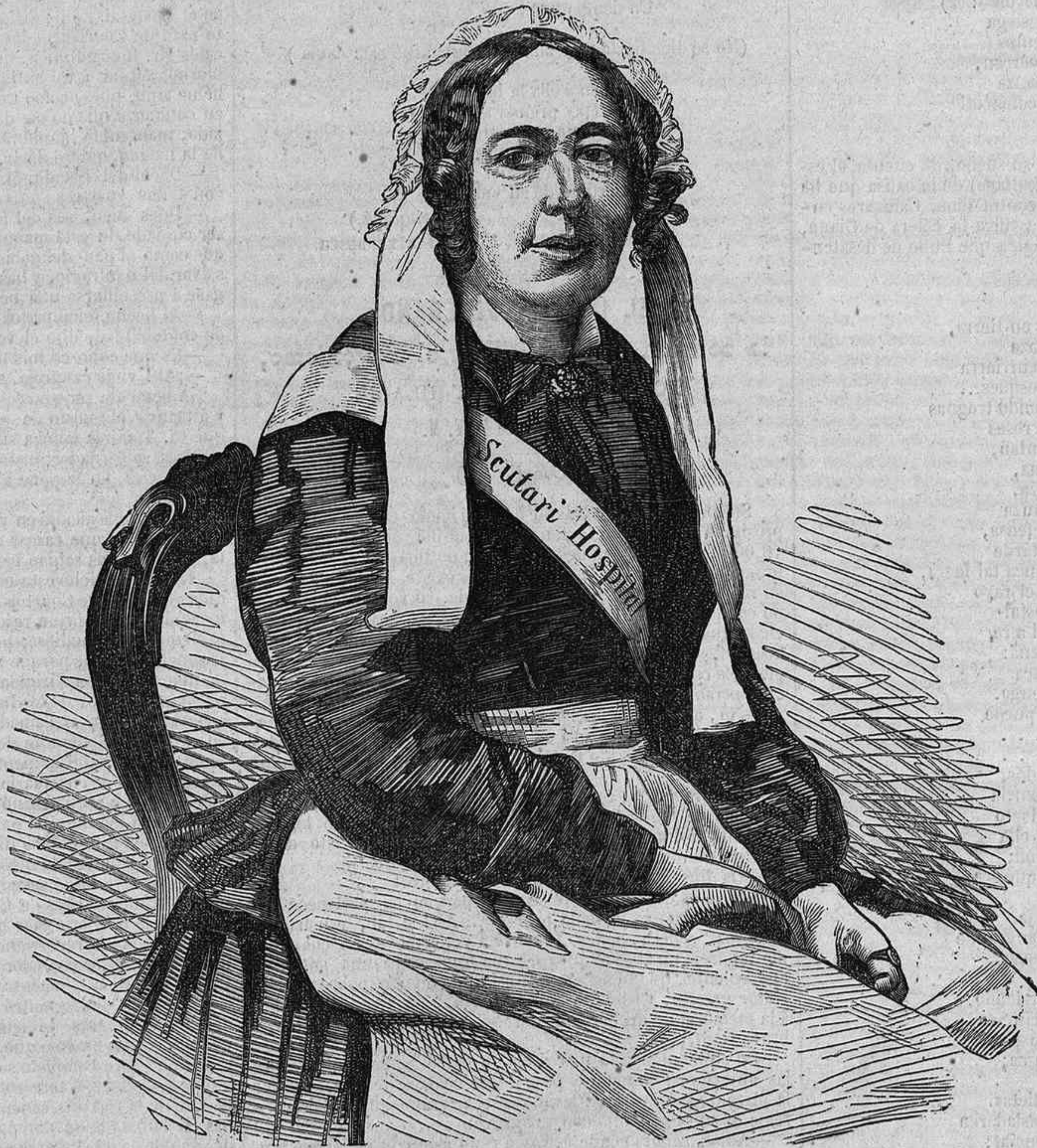
Una enfermera en el hospital inglés de Skutari.