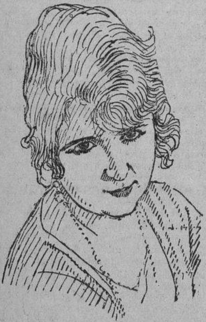
La eminente tonadillera La Goya, creadora de «¿Por qué no me quieres?»

Colabora con casi todos los maestros, y son sus favoritos Font, Adám, Barta y Villarrazo.