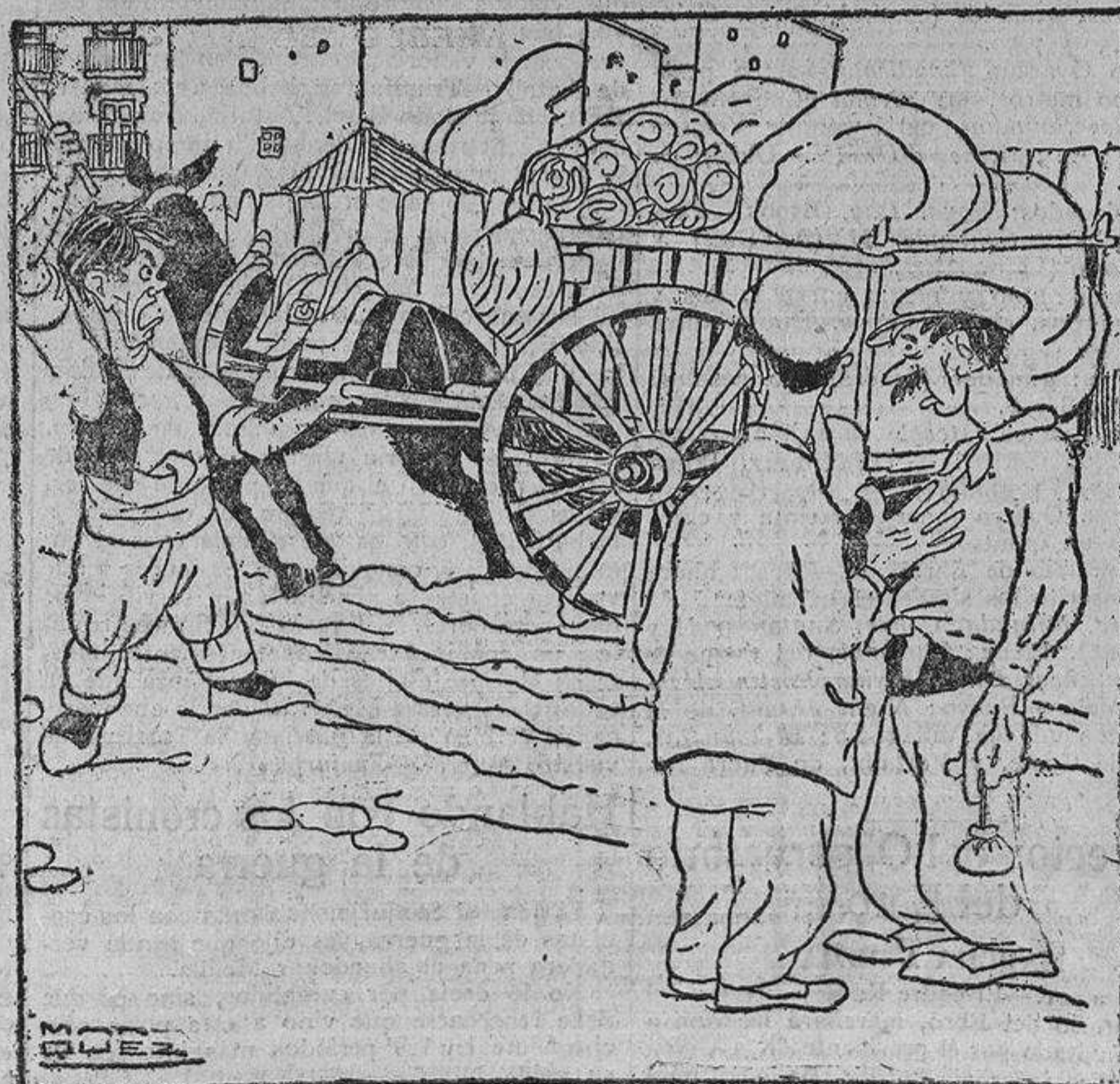
—«Mía» que costar dos «rales» un manojo de cebollas. —Pero, en cambio, escucha... Los «ajos» están «tiraos».