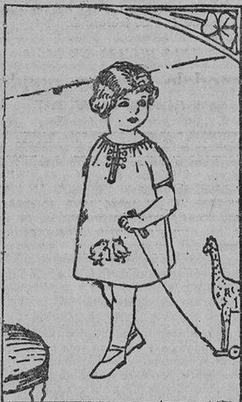
Delantalito para niña, fruncido en el cuello y bordado en el delantero.

Miss Ruby Quets acaba de cumplir veinte años y ha terminado ya sus estudios de leyes con notable aprovechamiento; pero está muy pesarosa porque la ley no le permite recibir