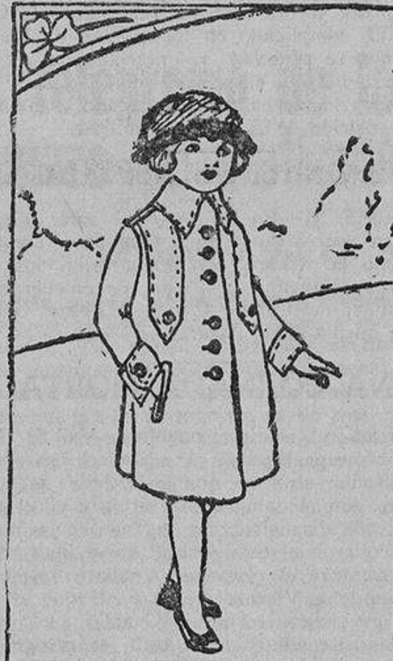
Abrigo de niña, confeccionado con pañete claro.

Por excepción emigran profesoras o insti-