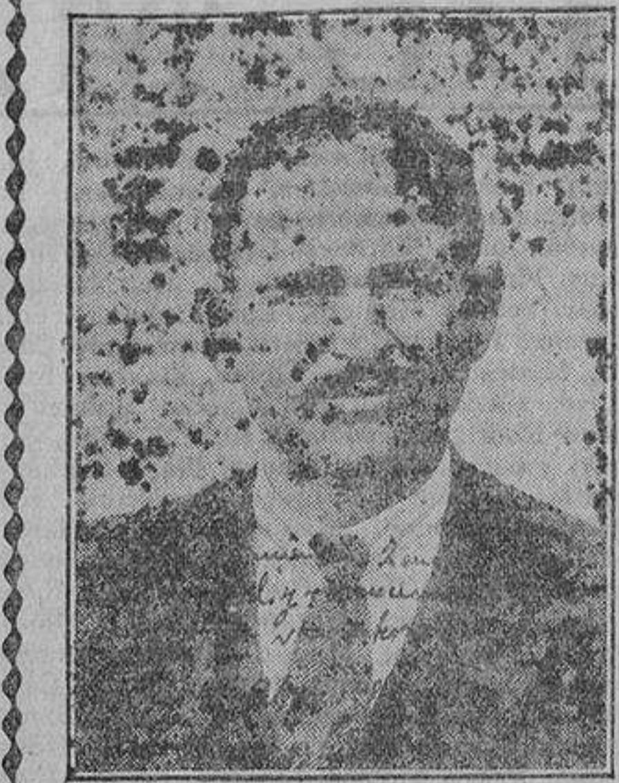
«Excuso decir a ustedes—continúa—que soy un verdadero devoto de los TRATAMIENTOS ZENDEJAS, y que proclamo sus maravillosos resultados a cuantas personas quieren oírme.»

Tetuán, 5.—A propuesta del Jefe, y previo expediente que refrendó el alto comisario, se ha decretado la destitución del ministro de Justicia, Er Noni, por haber pronunciado una alocución en la mezquita, ante el Jefe, en la cual deslizó conceptos encaminados a soliviantar los espíritus, y leyó ver-