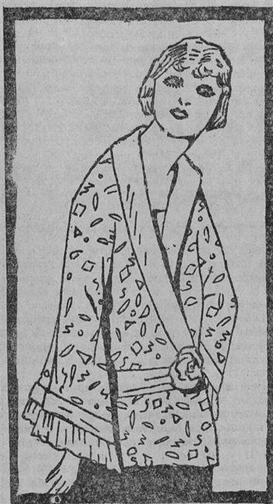
Blusón de tono violeta, confeccionado con seda estampada

No se administrarán los sacramentos de la penitencia o la eucaristía a las personas que no obedecieren a lo mandado en los artículos anteriores. Tampoco se las admitirá como madrinas en el bautismo y la confirmación.