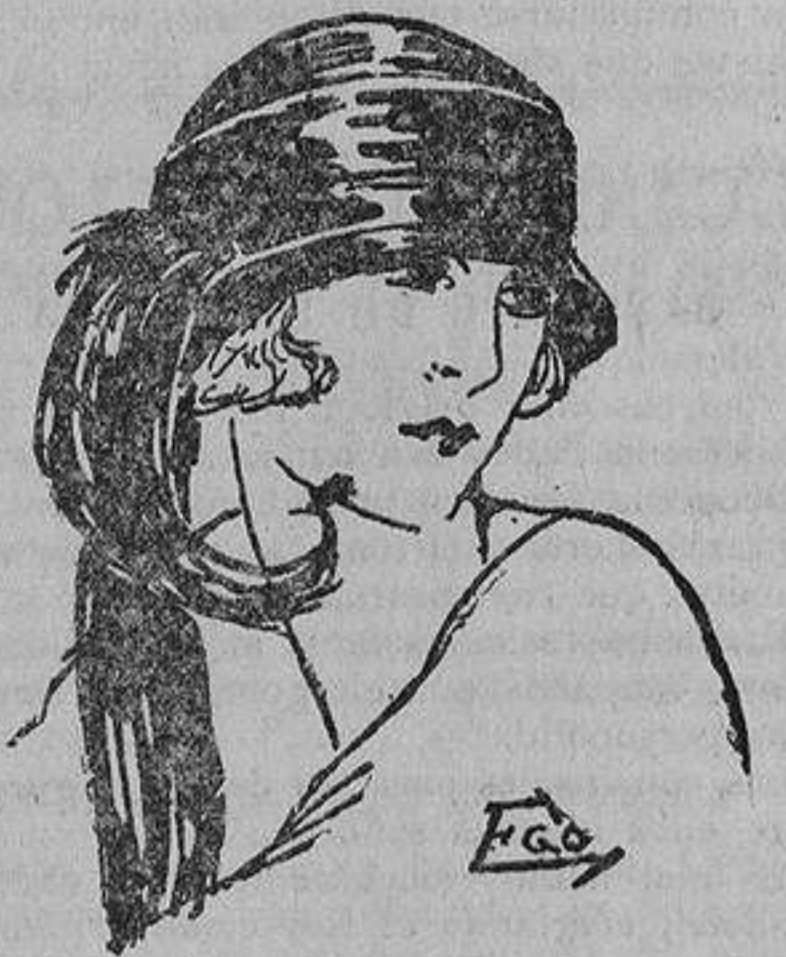
Elegante sombrero de seda adornado con una pluma de Paraíso.

Inesita.—Tengo la seguridad de que si emplea usted con constancia los Polvos de Flores de Talavera, conseguirá corregirlos