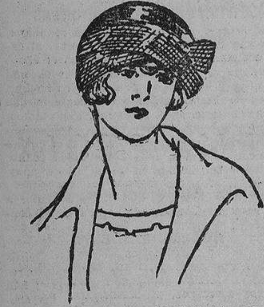
Simple sombrero de seda brillante, adornado con seda mate de color igual.

Madame Jeanne Paquin, la fundadora de la célebre Casa Paquin, que durante treinta y tres años dirigió las orientaciones modísticas de París, declaró hace poco sus ideas sobre el porvenir de la moda. Según ella, el traje femenino no llegará nunca a tener, pese a las sufragistas, un carácter de uniformidad como el que desde hace medio siglo impera en el atavío masculino. La ilustre modista dijo que los trajes de hoy están pareciéndose cada día más a los que vestían a las egipcias, y que esta tendencia es sensible al comparar nuestros modernos mo-