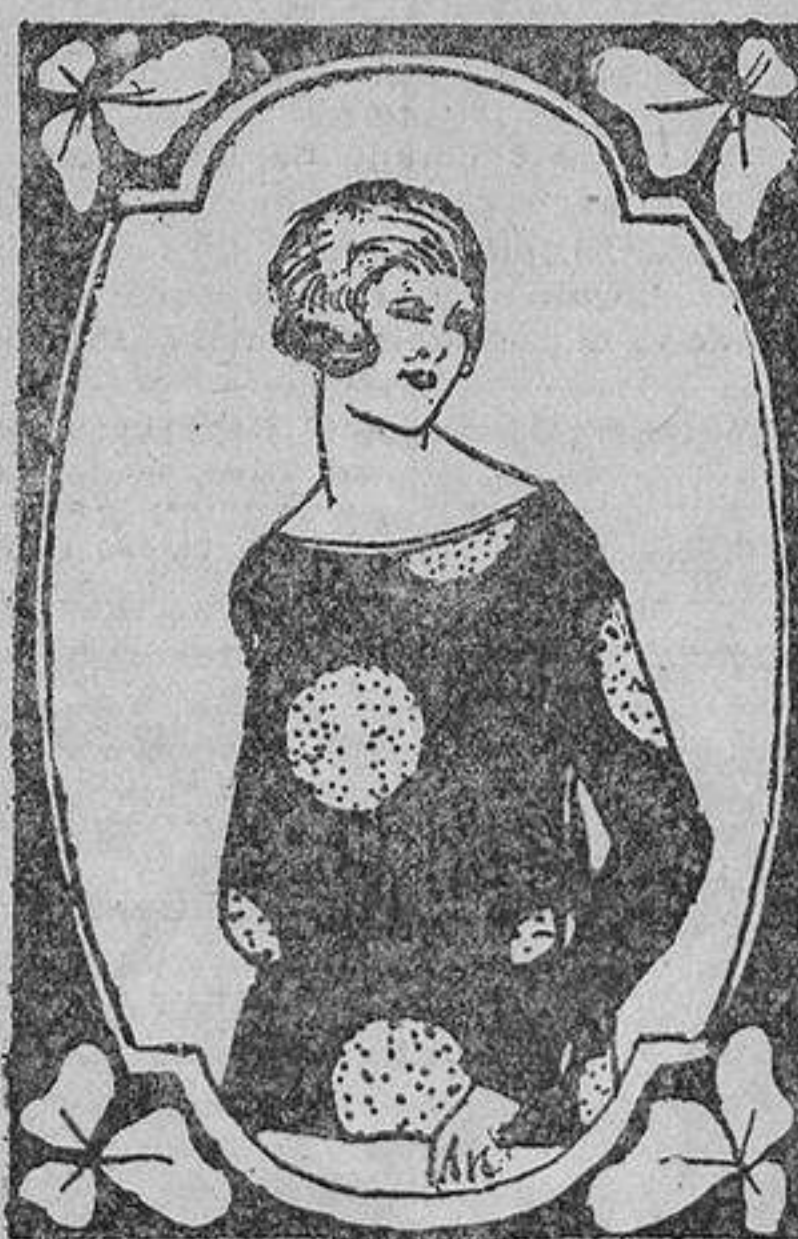
Blusa de manga larga, confeccionada con seda estampada

La causa inicial de la diferencia extraordinaria registrada entre el número de varones y hembras, estriba en el hecho comprobado por las estadísticas de que, si bien nacen más niños que niñas, la muerte en los