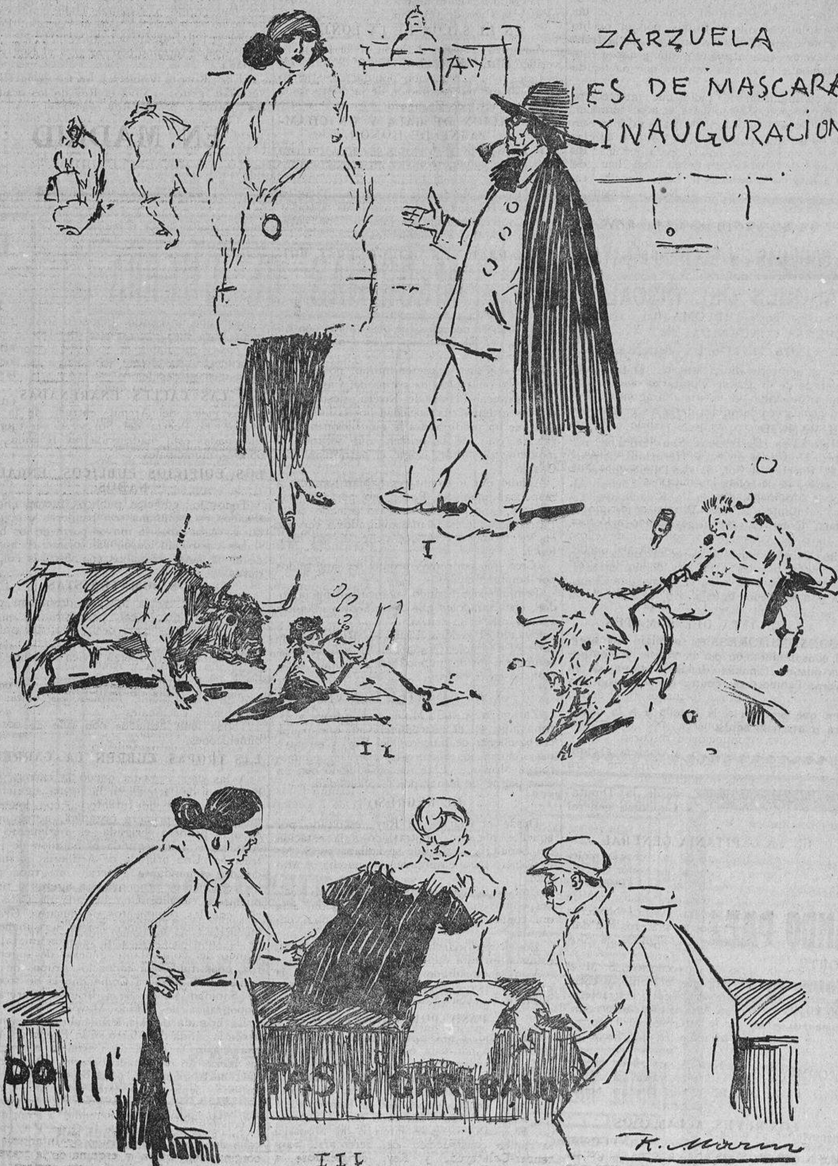
I. —Oye, tú, intelectual, dime un traje de máscara para dar el golpe en «la Zarzuela». —Pues iría con uno de «la época del Directorio». — II. Anverso y reverso del arte taurino de Ultramar según sea por cable o fotografía. — III. En el saldo de ropa interior: —Ahí tiene usted, «señá Patro», camisetas de todos colores, negras, blancas, rojas...—Ella: —Yo creo que te las debes comprar negras, que se ven menos las manchas.