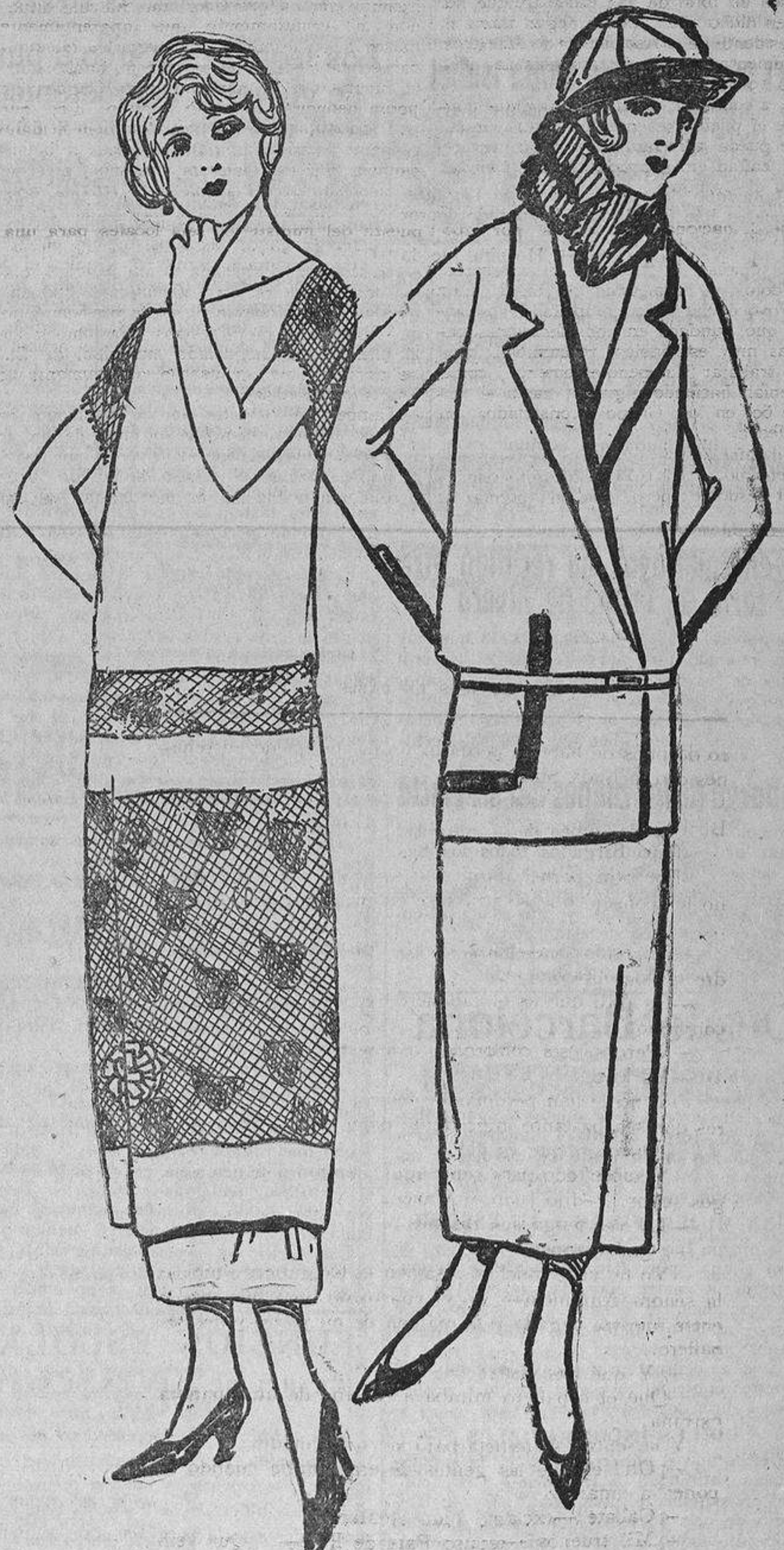
El primero de estos dos modelos se confecciona con techinacépe estampada y lino. El segundo es un traje de calle compuesto de falda y levita. Se adorna con galones de tejido igual al del vestido, en tono más oscuro. Completa el adorno de este vestido un cuello de piel.