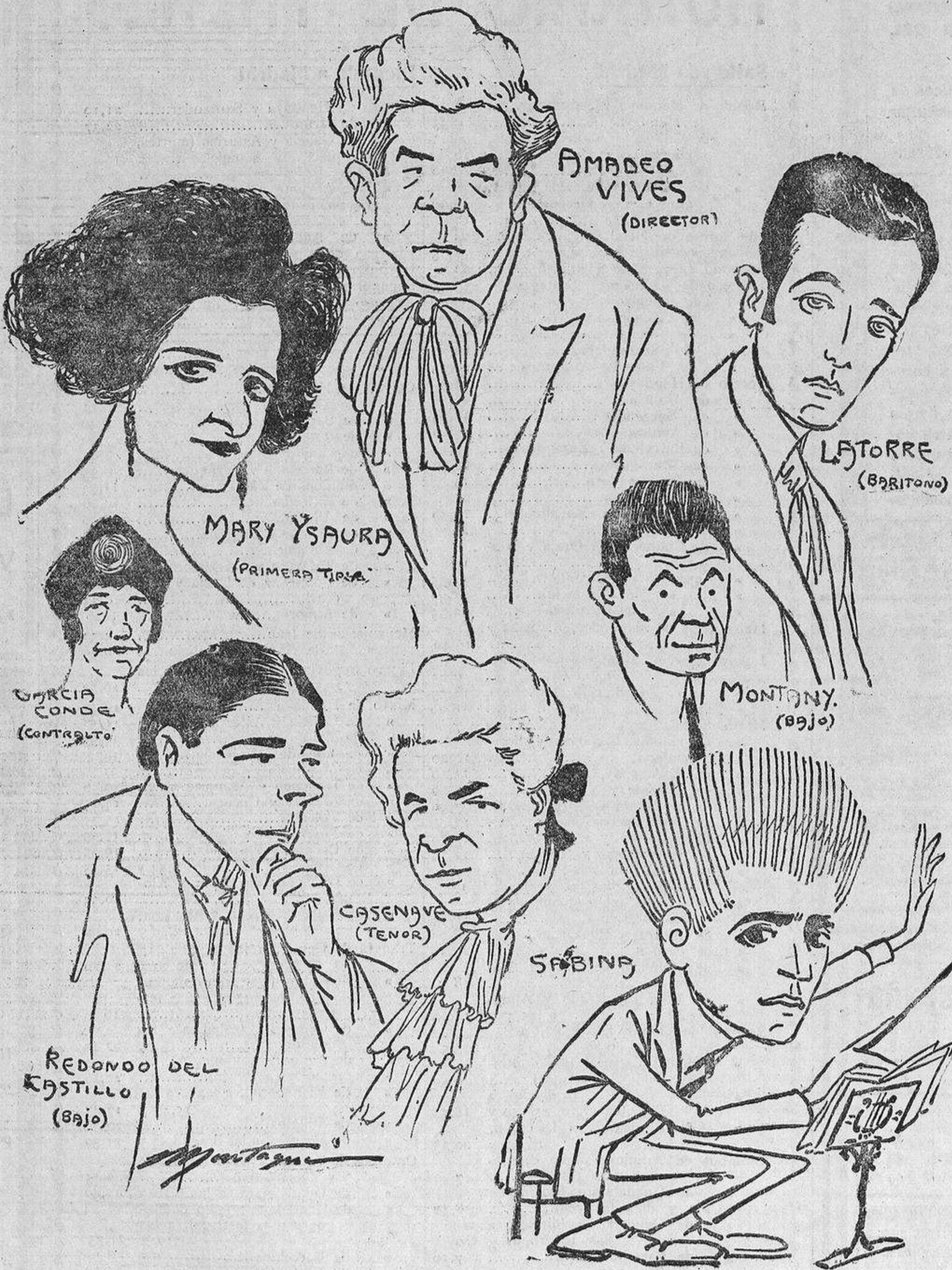
Figuras principales de la compañía que debuta hoy