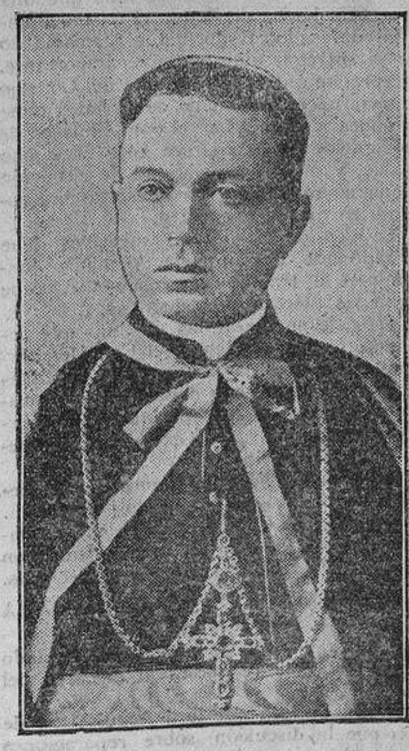
Monsiñor Tedeschini, nuncio de Su Santidad en Madrid, que lleva, en representación del Vaticano, las actuales negociaciones con el Gobierno español.