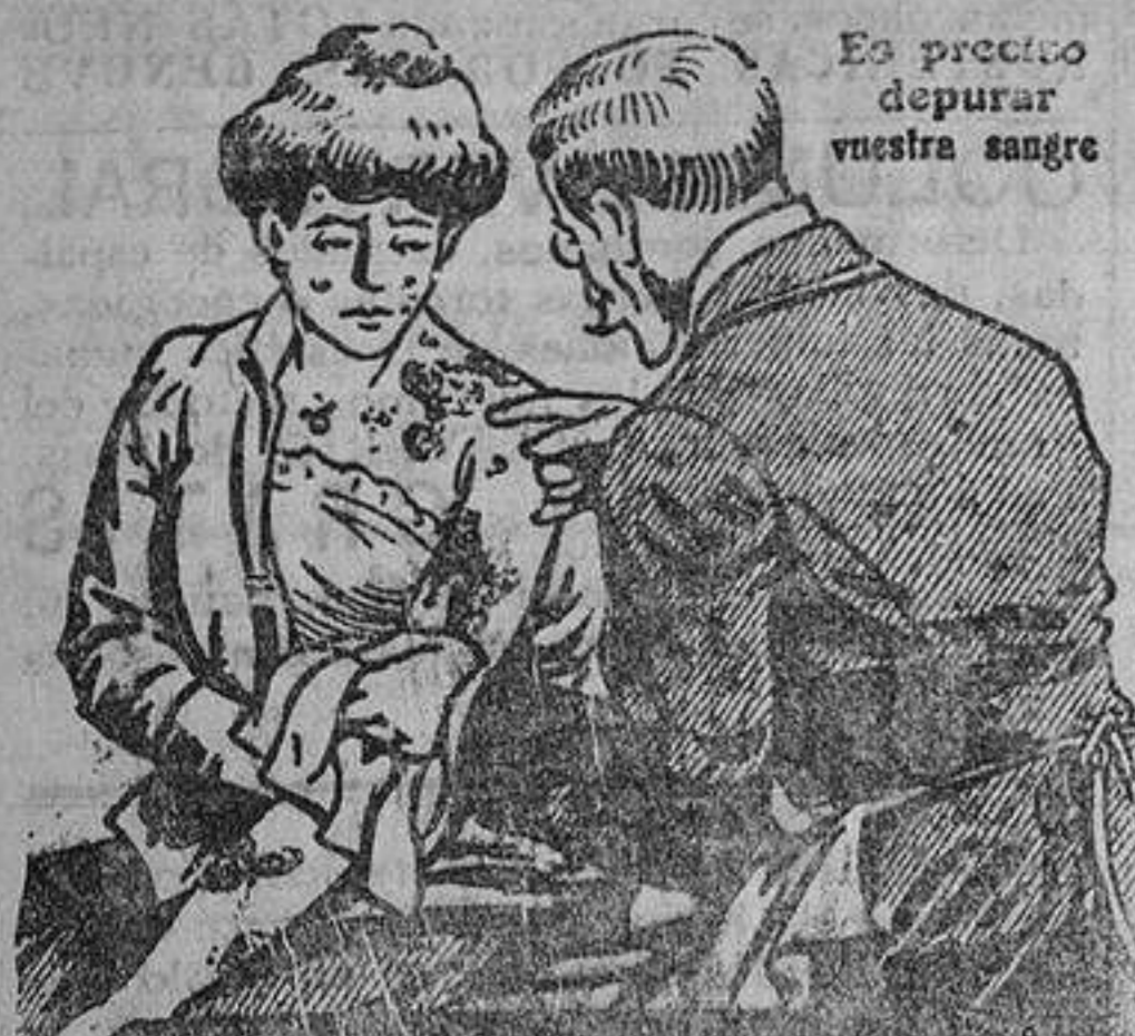
Es preciso depurar vuestra sangre