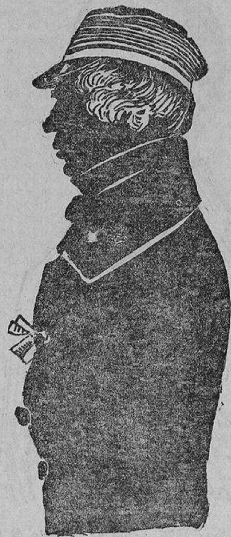
Siluetta de Bismarck cuando era estudiante.

padre, subí al Trono, siguió, como antes hice resaltar, la generación del nieto a la del abuelo. Se saltó, por lo tanto, toda la generación del Emperador Federico. Esta, merced a las naturales relaciones sostenidas con el Príncipe heredero Federico Guillermo, tenía muchas reformas en proyecto, que habrían de ser ejecutadas bajo su dirección al ser proclamado Emperador. Sobre este punto se vió defraudada en sus esperanzas toda la generación, especialmente el sector político, que