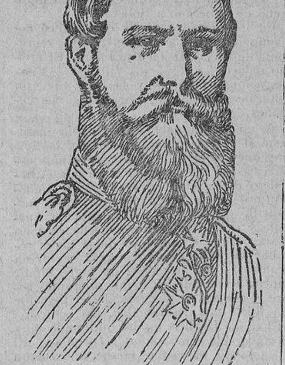
El Emperador Federico III, padre de Guillermo II.