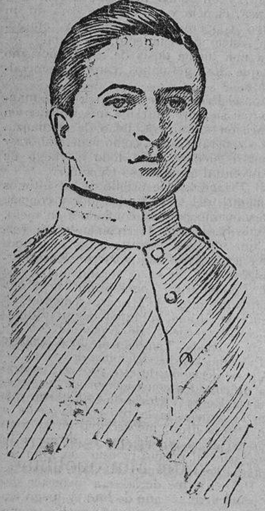
Guillermo II en la época del advenimiento al Trono.

La contestación que redacté guardaba la cariñosa forma exterior que imponía el cercano parentesco; la carta fué la de un nieto que se dirige a la abuela, que le tuvo de pequeño en sus brazos, y que era reverencia, por su edad, a toda clase de deferencias y respetos; pero en ella se hablaba de las obligaciones que me imponía el hecho de ser Emperador de Ale-