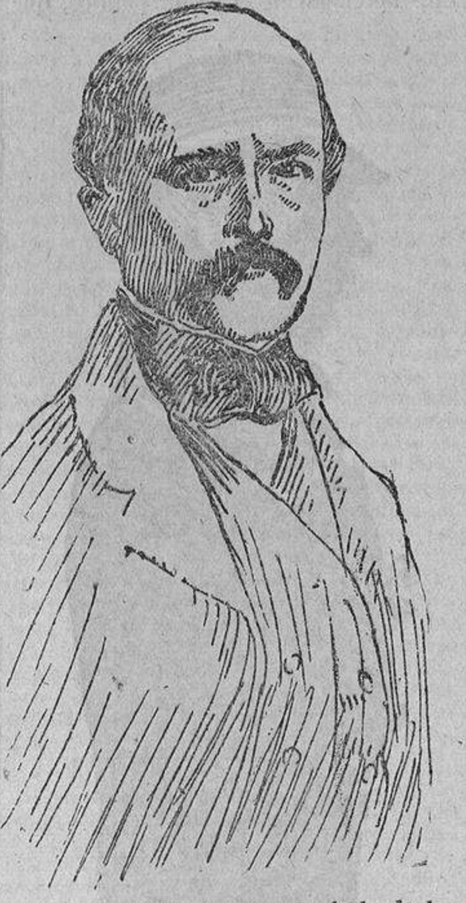
Bismarck en 1866, según un grabado de la época.

La cuestión agraria discutida apasionadamente en 1866, según un grabado de la época.