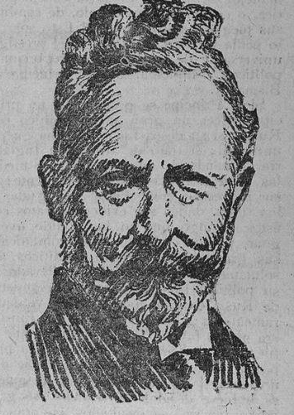
El ex Kaiser Guillermo II en la actualidad.

(5) Adlerberg. — Estadista ruso, a quien Nicolás II dispensó gran protección. Fue compañero de armas y consejero del Zar durante toda la vida de éste. (6) Se refería al alto elemento oficial.