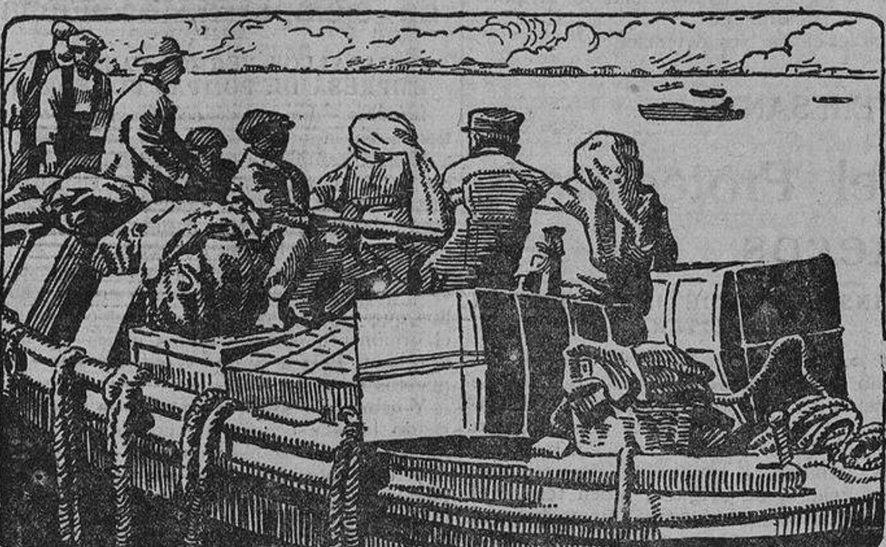
Griegos y otros europeos huyendo de Esmirna ante los horrores del incendio.

Opina que desde la terminación de la guerra mundial, acontecimiento alguno ha amenazado en tal grado la situación política de Europa.