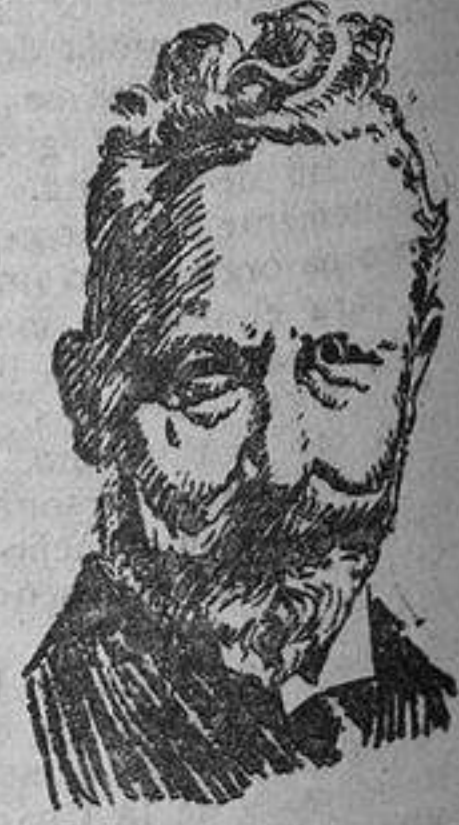
El ex Kaiser en la época de escribir sus Memorias.

estimada como el acontecimiento periodístico más sensacional del siglo XX.