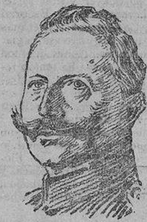
El Kaiser al estallar la guerra.