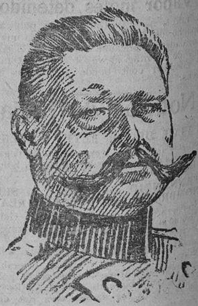
El general Hindenburg.

Diríjanse las suscripciones y pedidos a las oficinas de “La Correspondencia de España,” Arenal, 1, Madrid. Apartado núm. 12-16.