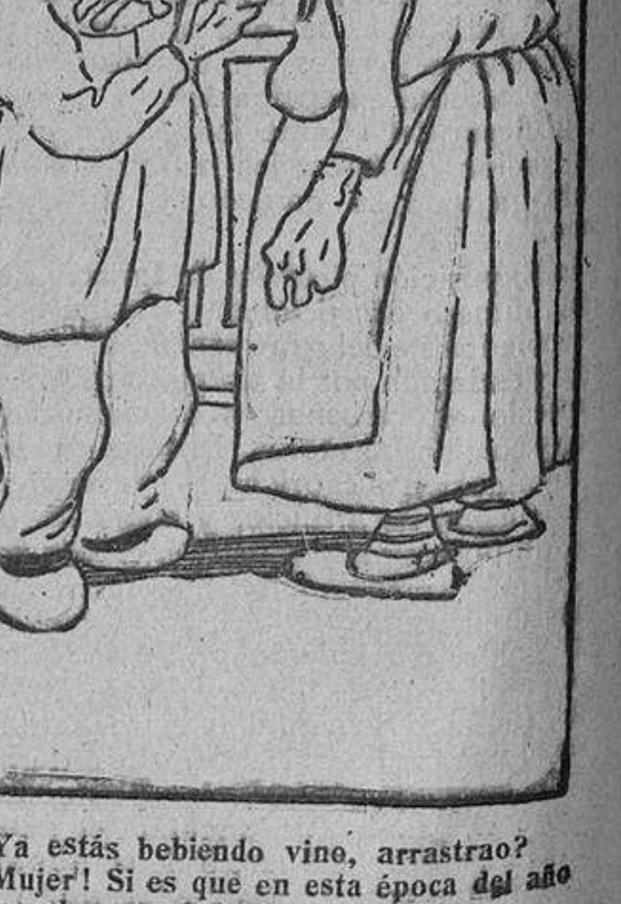
—¿Ya estás bebiendo vino, arrastrao? —¡Mujer! Si es que en esta época del año hay que ahorrar el agua.

Barcelona, 10.—El encargado del cierre del diario La Publicidad, de setenta y cuatro años, ha disparado esta mañana dos tiros de revolver contra la dueña del piso donde vivía, dejándola en gravísimo estado. Creyéndola muerta, el agresor se arrojó por una ventana del patio de la propia casa muriendo instantáneamente.