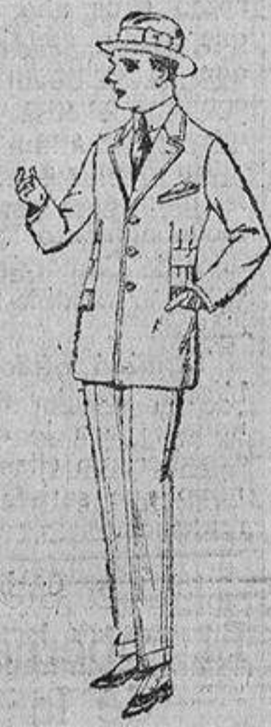
Trajes de patén, vicuña o jerga, forma sport, para niños y juvenicos de diez a diez y seis años. De ptas. 40 a 55.