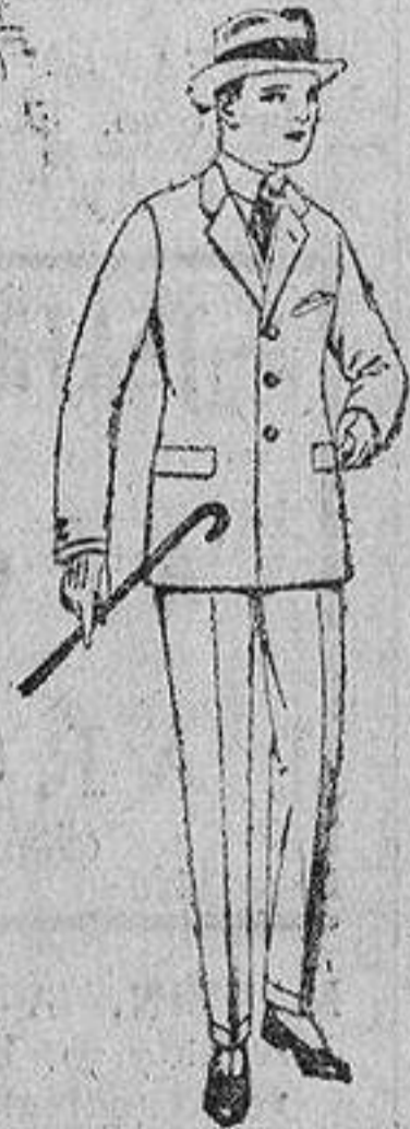
Trajes de patén, vicuña o jerga, para niños y juvenicos de diez a diez y seis años. De ptas. 30 a 55.