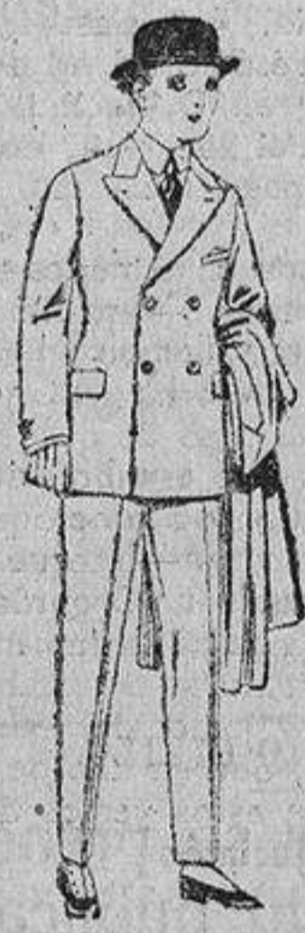
Trajes de patén, vicuña, etcétera, para niños y juvenicos de diez a diez y seis años. De ptas. 32 a 55.