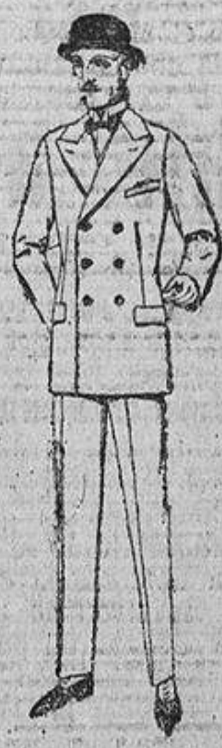
Trajes de melton, estambre, vicuña, jerga, cheviot, etc. De ptas. 38 a 170.