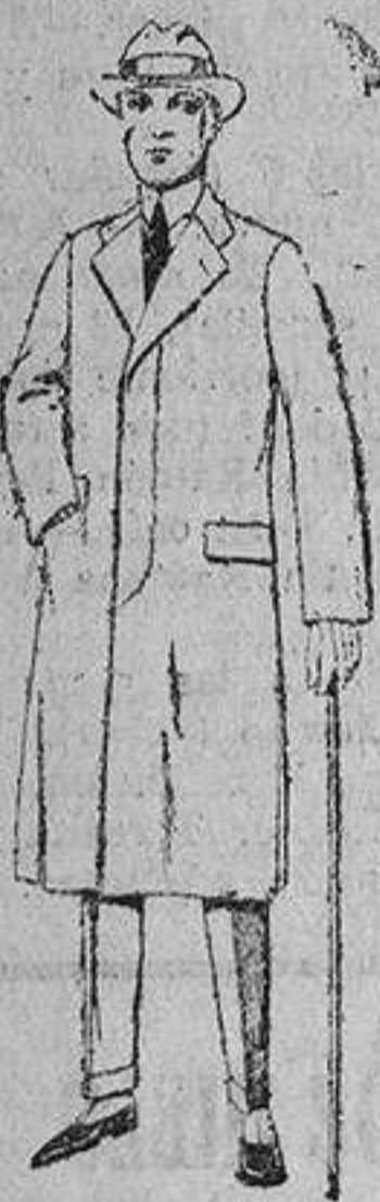
Gabanes de cheviot, gamuza, patén, etc. De ptas. 45 a 140.