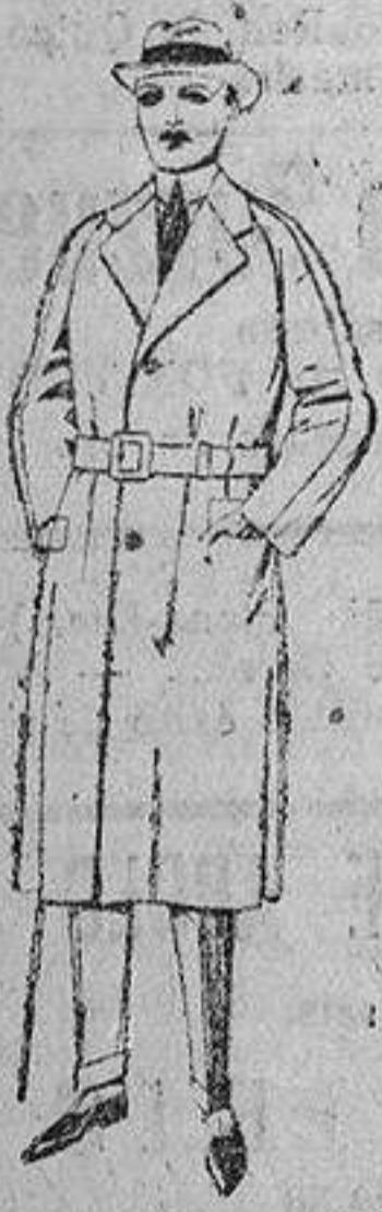
Gabanes forma "ranglón", de patén, gamuza o cowar. De ptas. 60 a 200.

SUCURSALES: Barcelona, Alicante, Almería, Bilbao, Cádiz, Cartagena, Gijón, Granada, Málaga, Palma de Mallorca, Santander, Sevilla, Valencia, Valladolid y Zaragoza.