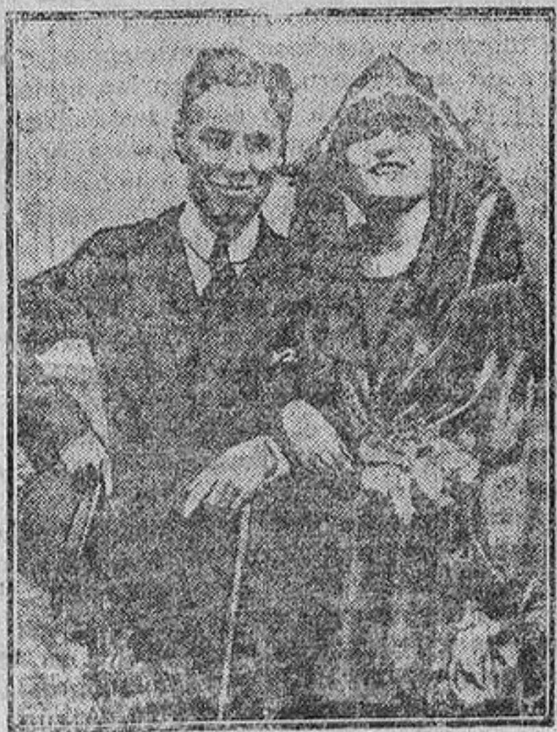
El célebre Charles Chaplin (Charlot), despus de su boda con la actriz cinematográfica alemana «Pola Negri».

Nos lleva a esta conclusión el hecho de que hemos visto gobernar a hombres de tan limpia conciencia y tanta autoridad como Cánovas y Maura y Canalejas, y algunos otros, que no han podido extinguir el juego,