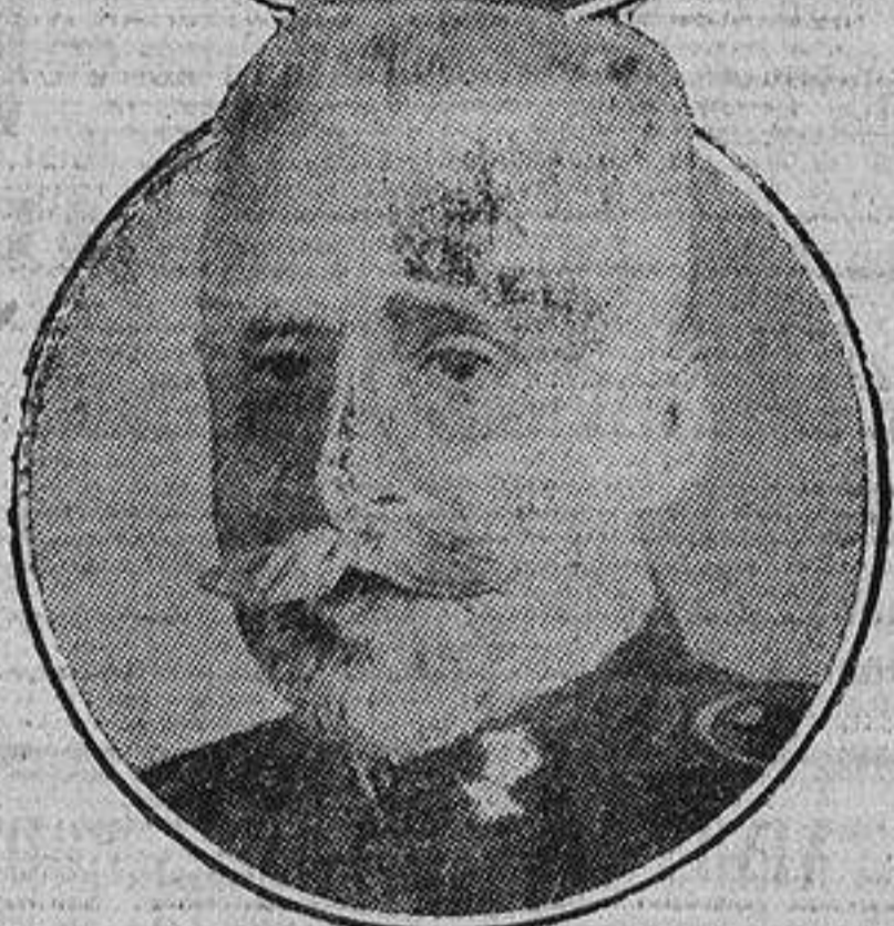
El general Diaz y el almirante Tahan de Revel, dos de los catorce ministros que forman el Gabinete fascista.