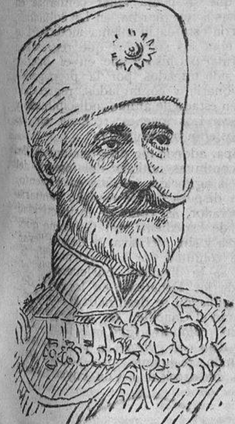
El Gran Duque Nicolás de Rusia.

sustitutos del Canciller los llamados a dirigir la nave del Estado en peligro, porque los sustitutos no pueden nunca tener la autoridad del jefe de Gobierno responsable. Pero la autoridad entonces estaba ausente. Según he llegado a saber, no se ha-