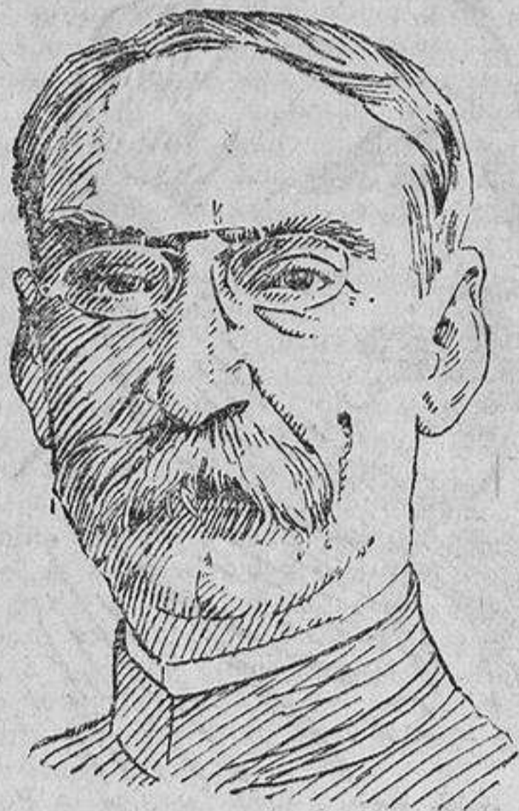
Gallieni, general francés.

mi se me orientase sobre el particular, hasta que al fin, cuando la última nota a Wilson, di a entender a Solf por medio de mi jefe de Gabinete, en forma bien clara, que exigía se me diese a conocer el contenido de la nota antes de ser despachada. Vino Solf y me la presentó; muy orgulloso por la antítesis entre deponer las armas (Waffenstreckung), que era la exigencia de Wilson, y armisticio (Waffenstillstand), que era lo que en la nota se proponía. Como quiera que yo entonces llamase la atención sobre los rumores de abdicación y exigiese que el ministerio de Estado tomase posiciones en la Prensa