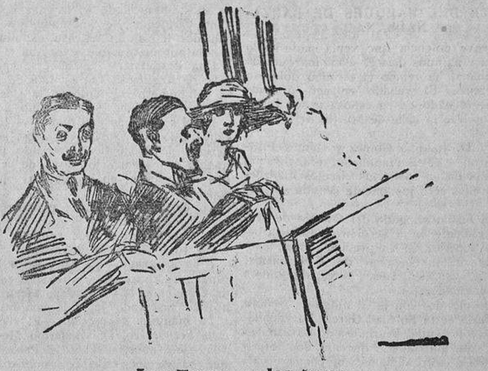
Los Reyes en los toros

tes sirvan, por lo menos, para evitar que tengamos ocasión de lamentarnos de hechos análogos en lo sucesivo. Los funcionarios son muy respetables y más aún los derechos que reclaman; pero el ambulante culpable de tales anomalías no podrá hablar seguramente, en las reuniones de estos días, de tales derechos.