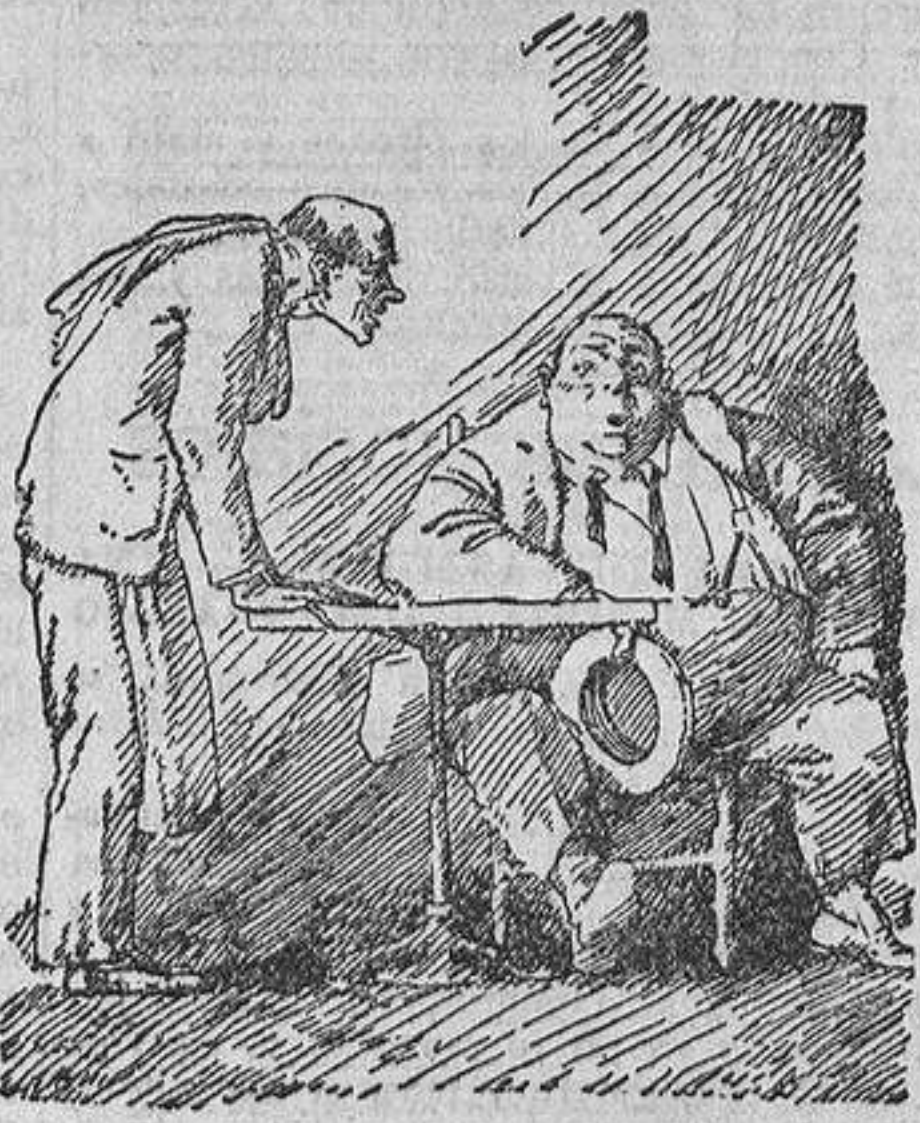
—¿En qué piensa usted, D. Teódulo? —Pues en que acabo de echar una carta y con su importe me podía haber ido a vernear a Austria...

está siendo objeto de grandes comentarios por las manifestaciones gratísimas hechas a la Prensa, que no olvidará jamás los altos conceptos expuestos por el Soberano.