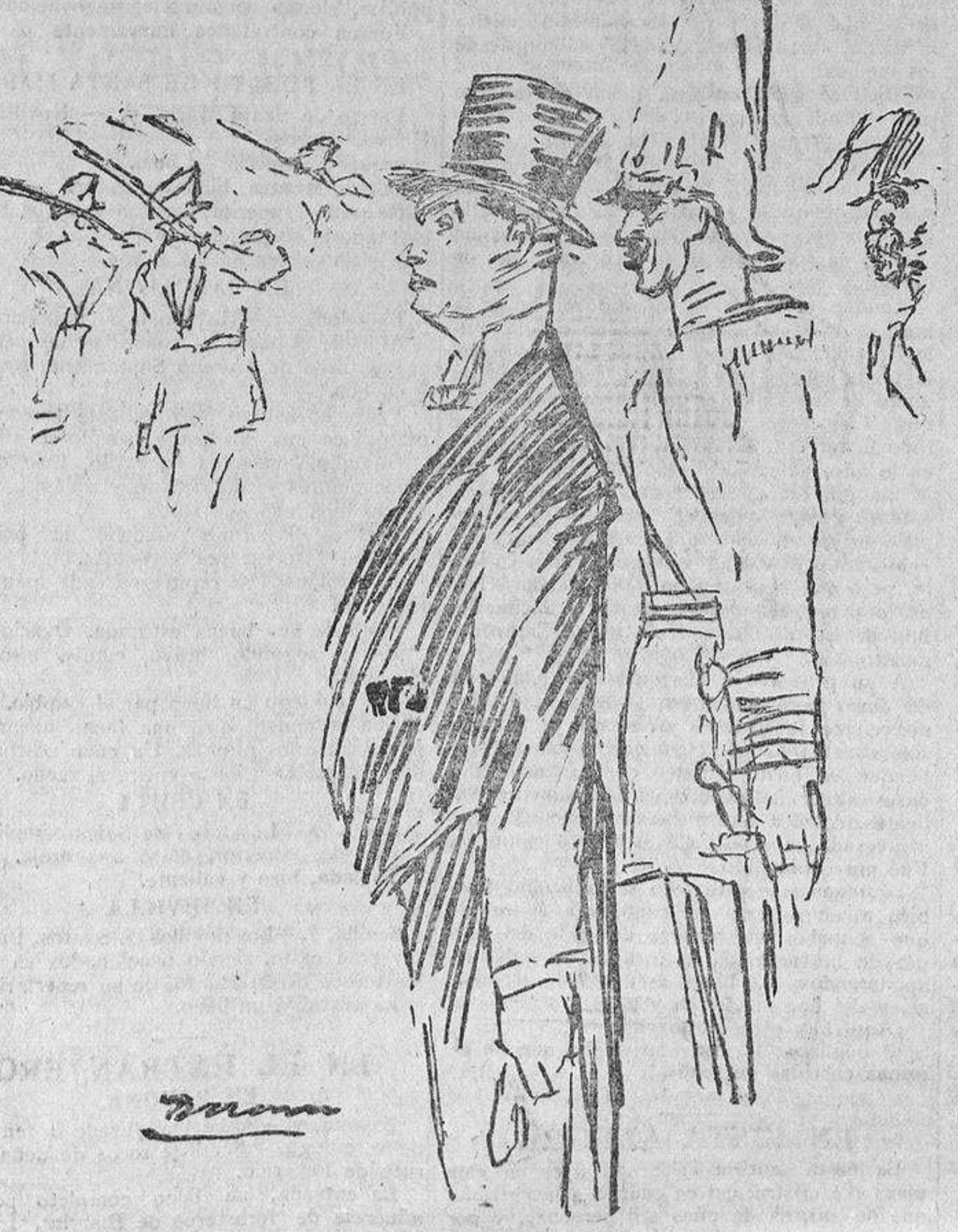
Presenciando el desfile