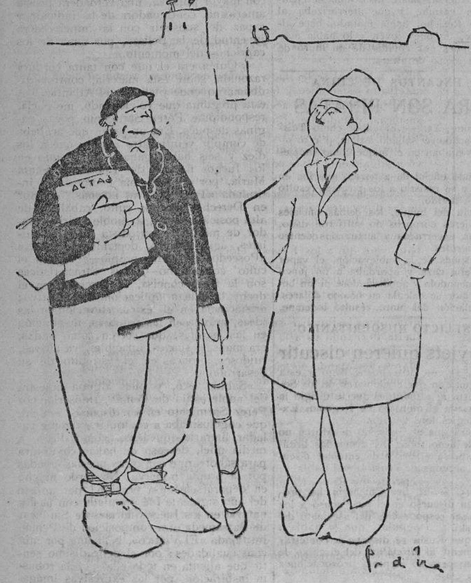
El dicitado electo.—Lo malo, ahora, es el Supremo... El cacique.—Vaya escudiao, señorito; aquí no hay más Supremo que yo.