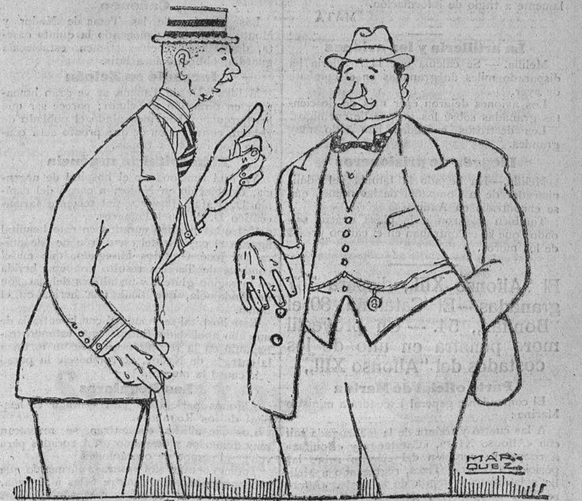
—El Gobierno está decidido a presentarse el 20 en las Cortes. —No sé para qué, puesto que estando cerradas cobramos igual las quinientas del ala.