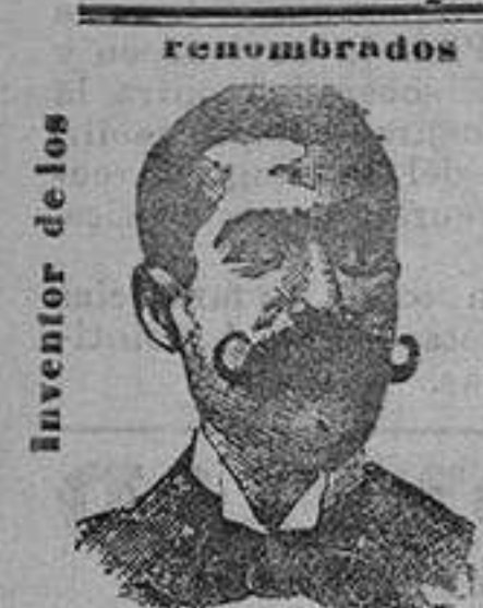
inventor de los medicamentos

Dirección Postal y Telefónica: A LAURIN, en León.