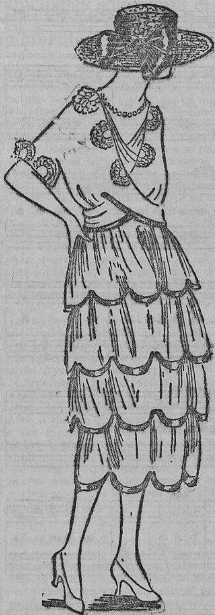
Sobre un viso rosa pálido o carne, volantes de tul del mismo color o crudos, ribeteados con vivos rosa muy fuerte. En el cuerpo semicírculos de puntillita fruncida.

Otra forma de capa, tan sencilla como ésta, es la de un modelo de Chanel, que en las carreras pasea triunfante lo mismo en los regios hombros de nuestra Soberana como en los aristocráticos de una súbdita suya.