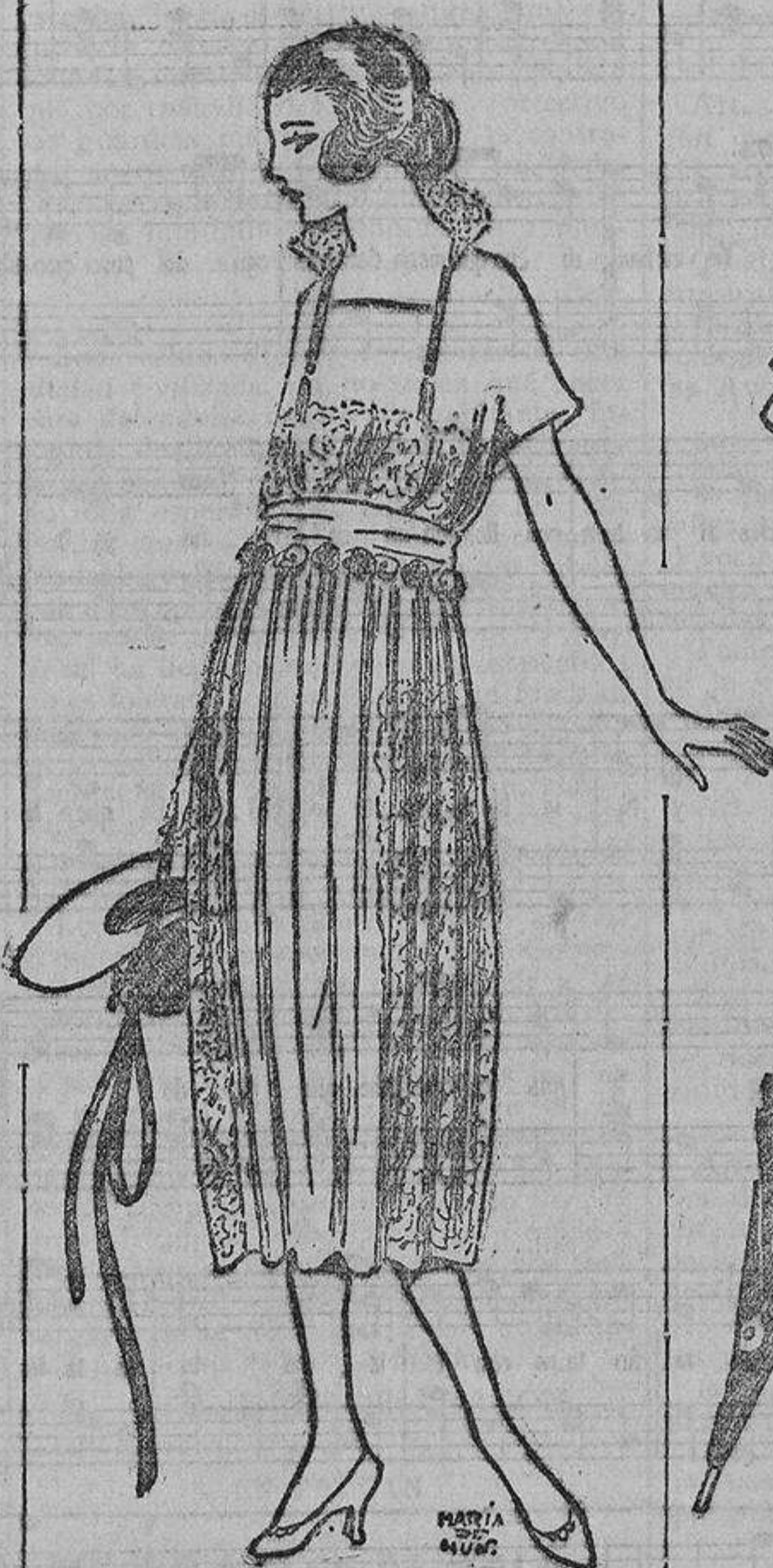
Sencillamente ideal, este vestido de crepón de China rosa muy pálido y encaje de Malines crudo. Rosas de tafetán en tonos azul verde y rosa viejo, hechas a mano. Cinta de plata que cae del cuello y borlitas ídem.