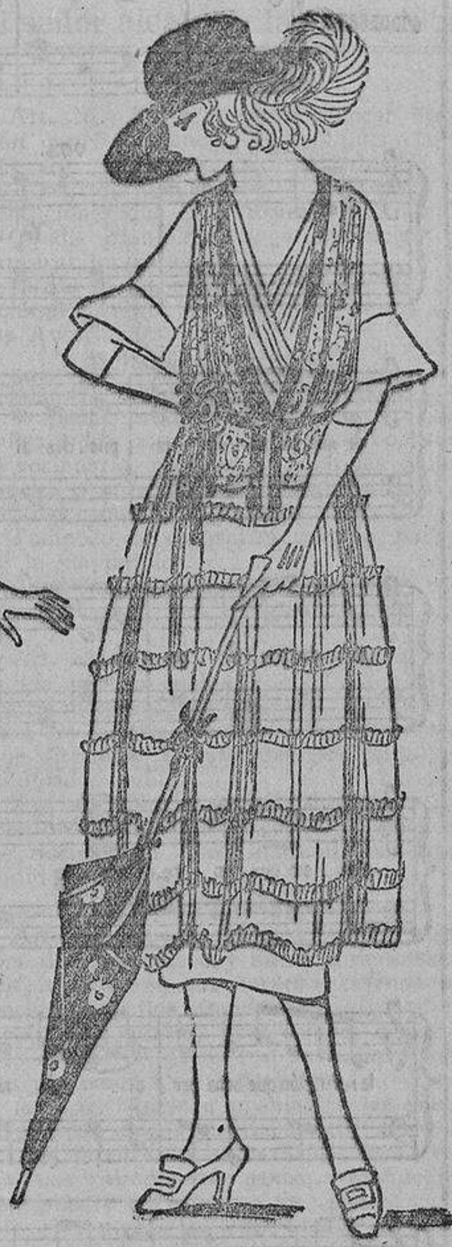
Ya que todos los volantes se colocan hacia abajo, este modelo, por llevar la contraria, tiene los volantes plisados y puestos hacia arriba; el vestido crepón de China color paja con encaje en el cuerpo.

rana como en los aristocráticos de una súbdita suya.