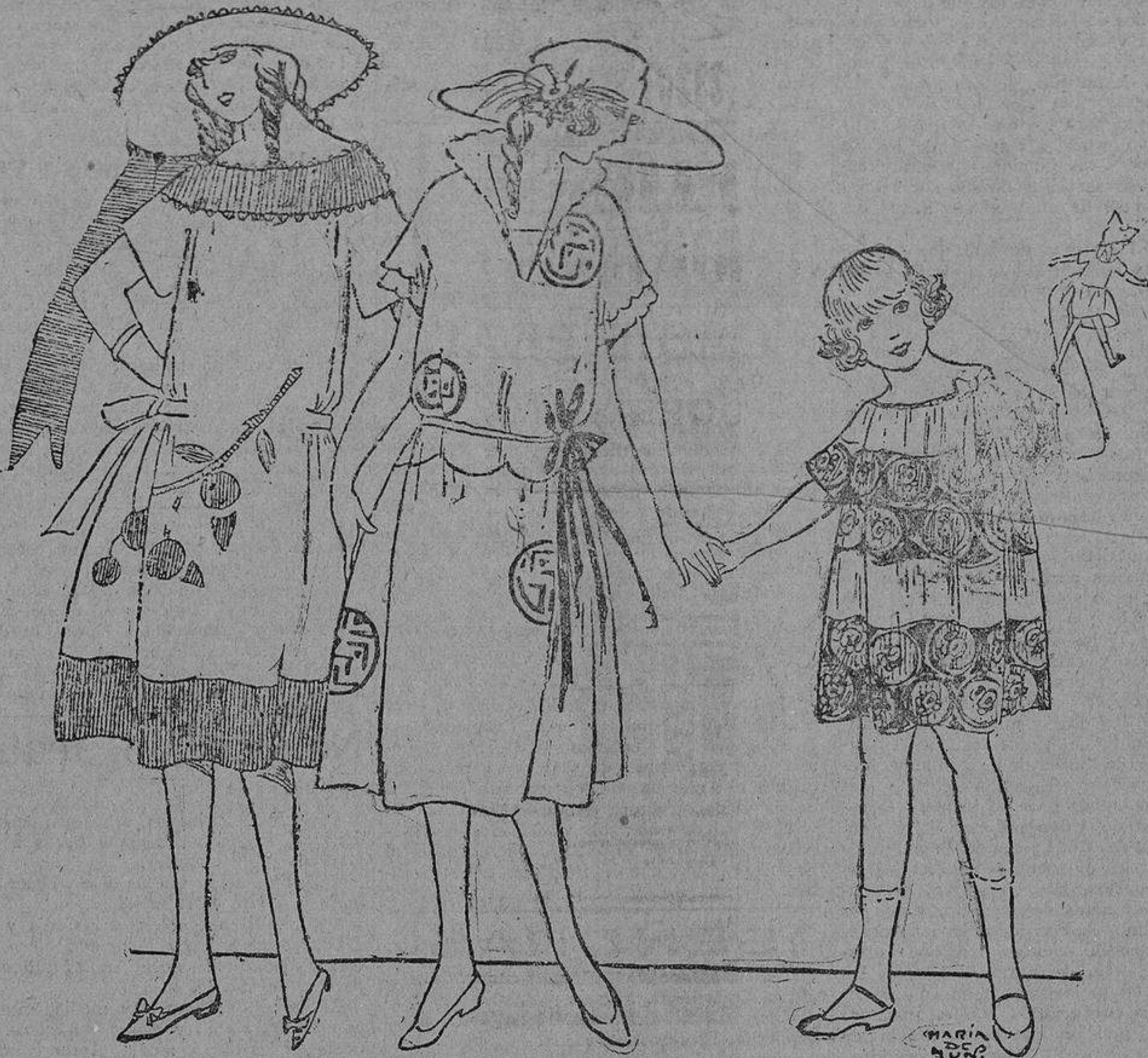
Qué monada este vestido, de crespón de algodón blanco y crespón amarillo, con el cual se le ha puesto una rama incrustada.