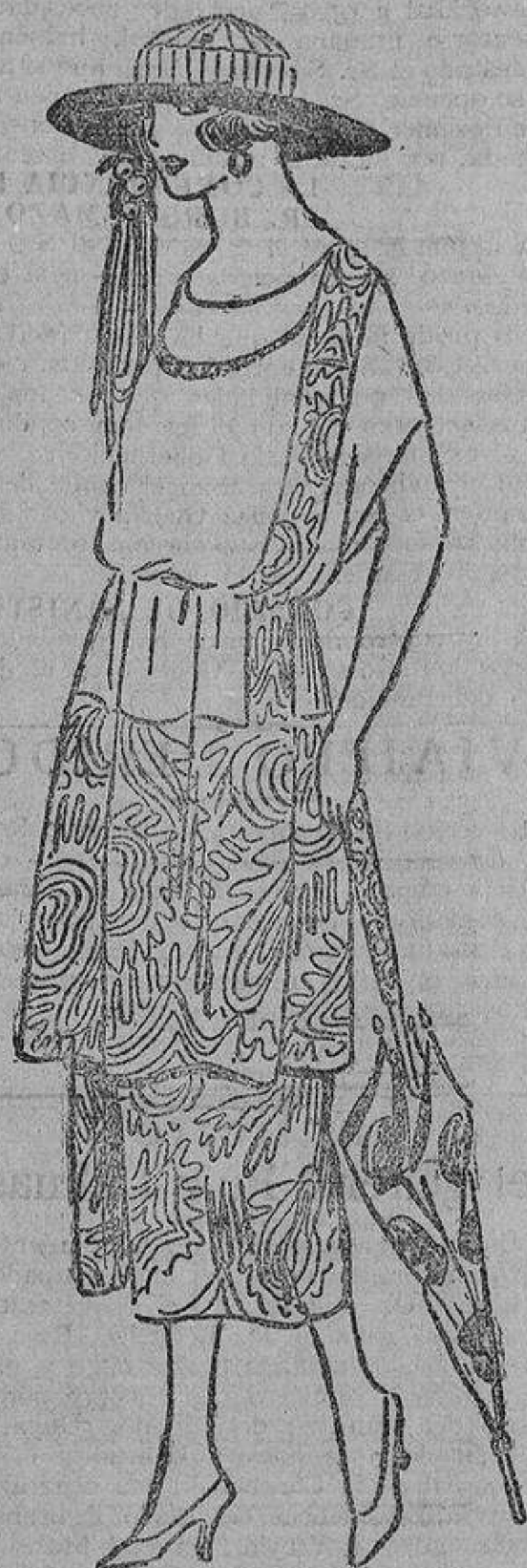
Puede ser todo del mismo tejido (crepón), liso y bordado, o bien combinado con dos tejidos, uno estampado y liso el otro... o con encaje...