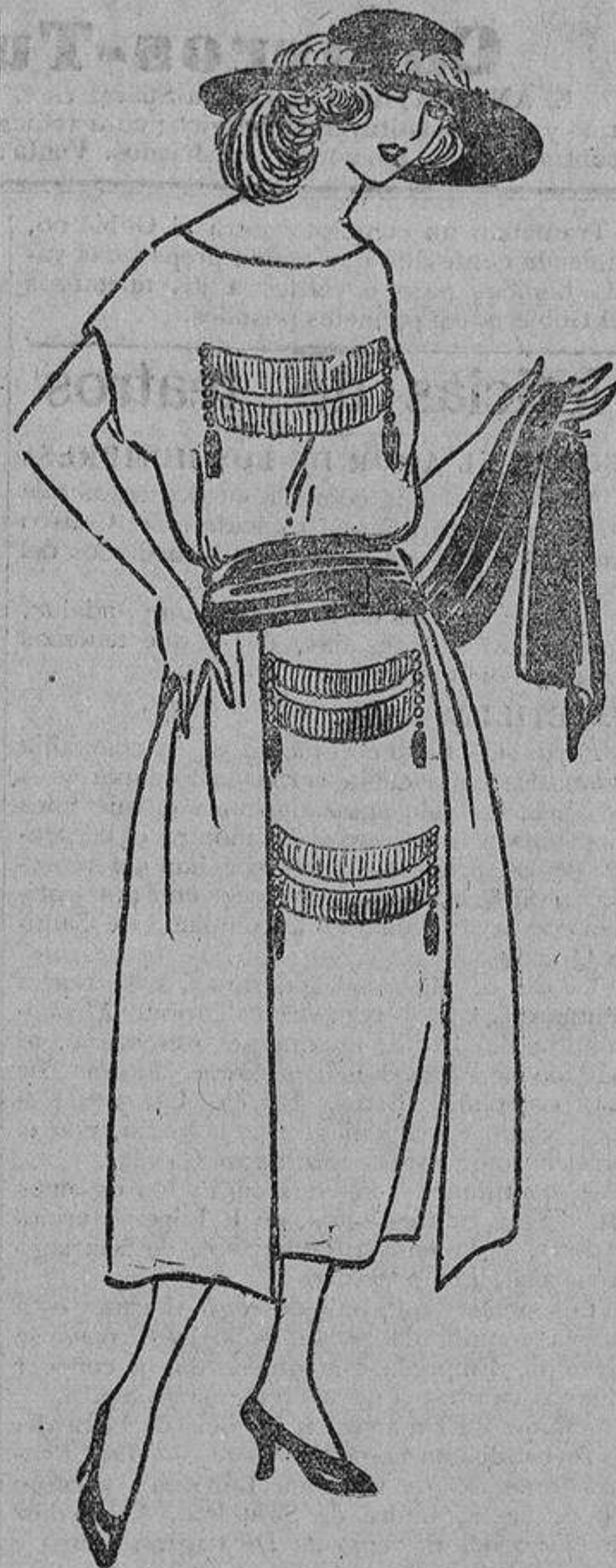
Este vestido puede hacerse en tafetán o crepón, con dos paños sueltos a los lados, más largos que la falda, y delante fleco, entredós y borlas de oro.

Apruebo la idea de esos novios sentimentales que ahora implantan el casarse