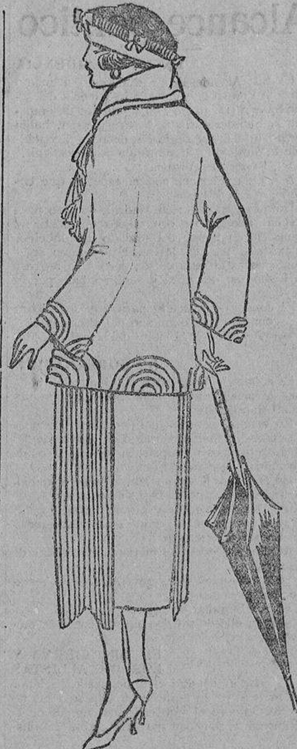
De paño pan tostado, aplicaciones de tela recortada sobrepuestas. Falda plisada delante.

en una modesta iglesia pueblerina, en un sitio pintoresco, ahí, lejos de los burlescos, de los envidiosos, de los indiferentes, de los «amigos»; en esas poéticas ermitas enclavadas en los repliegues de las colinas que dan al mar, rodeados de una naturaleza risueña y en que un sacerdote santificado por la vida sencilla, les da una bendición que es amarle de la buena suerte. ¡Felices los matrimonios que pueden guardar el recuerdo inolvidable de toda esta sencilla y pacífica belleza!