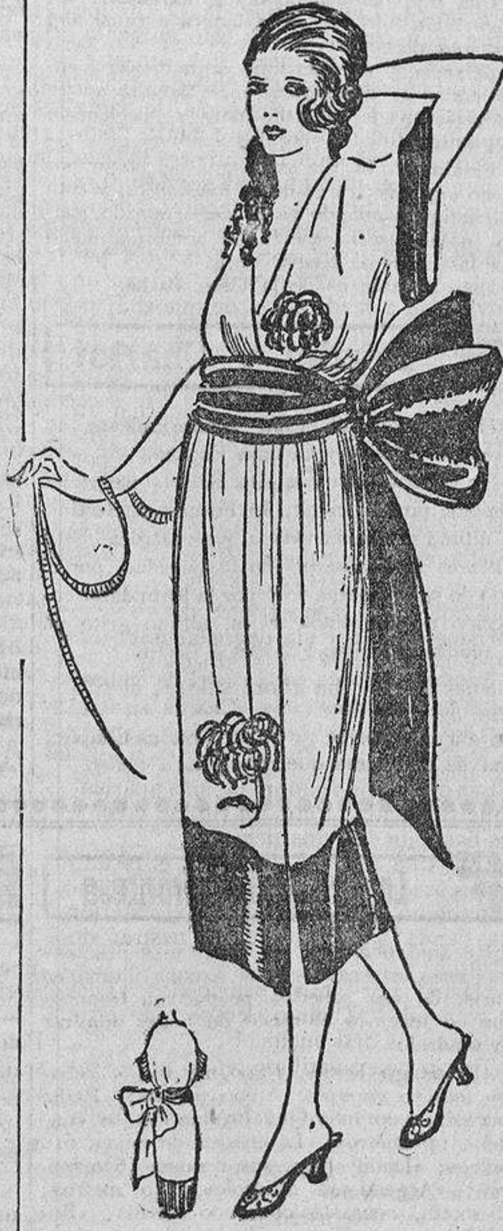
Kimono de seda lavable color canario, con crisantemos bordados azul Talavera; de dicho color es la banda y bleses.