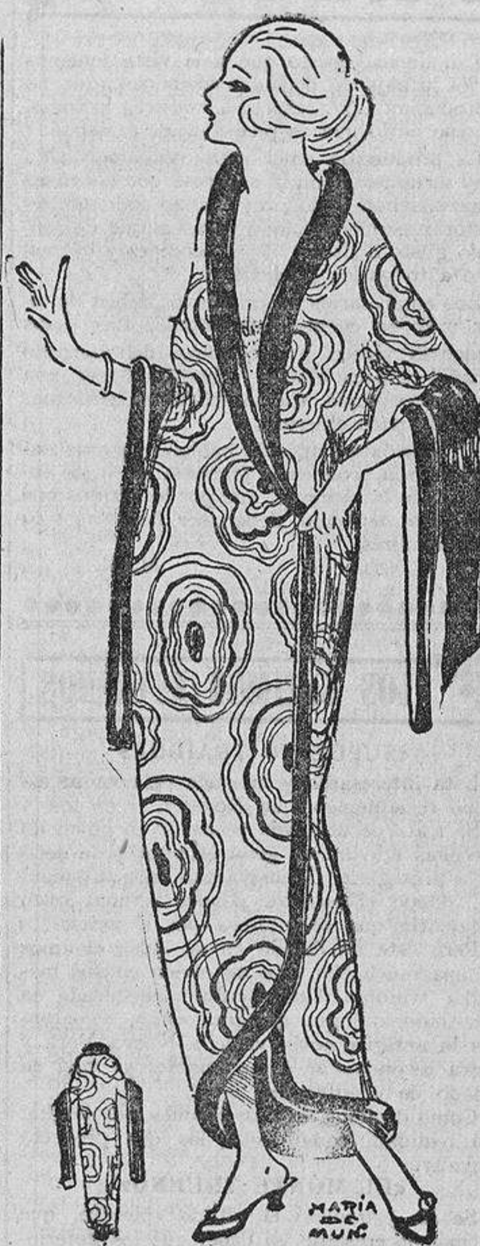
Salto de cama de crespón de seda estampado en colores. Para bordearlo se elegirá el tono más oscuro de la estampación, con preferencia azul, morado o negro.

das, son encantadores para vestidos vaporosos.