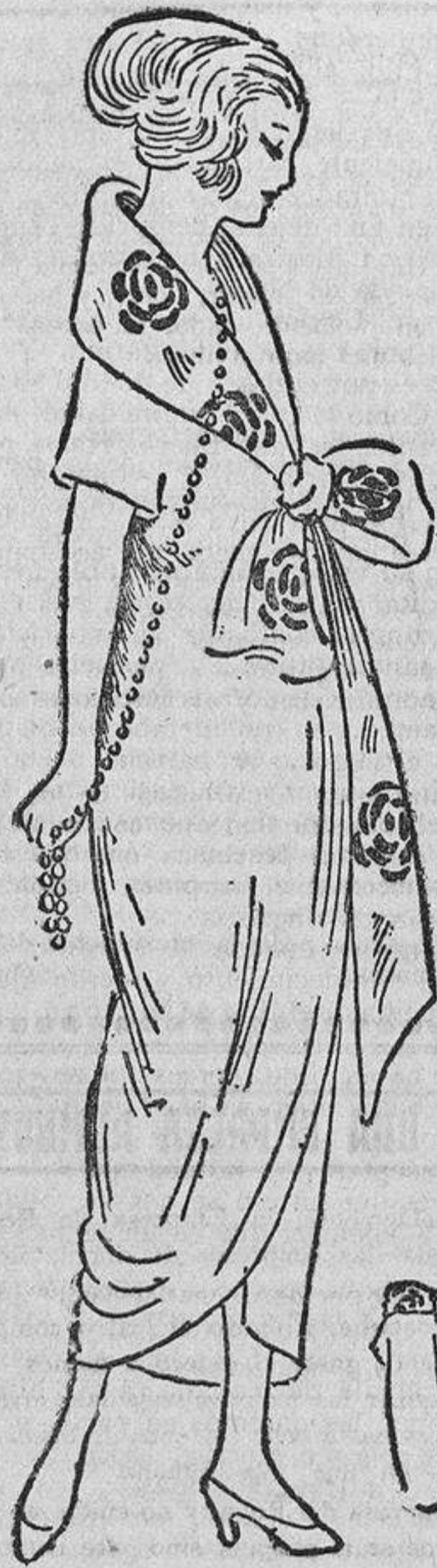
Sencilla bata de lana acrespada rosa pálido; cuello y lazo de «Joulard» del mismo tono estampado en azul «lavande».

Las muselinas, los tejidos de seda adornados con flecos cortitos o de perlas irisa-